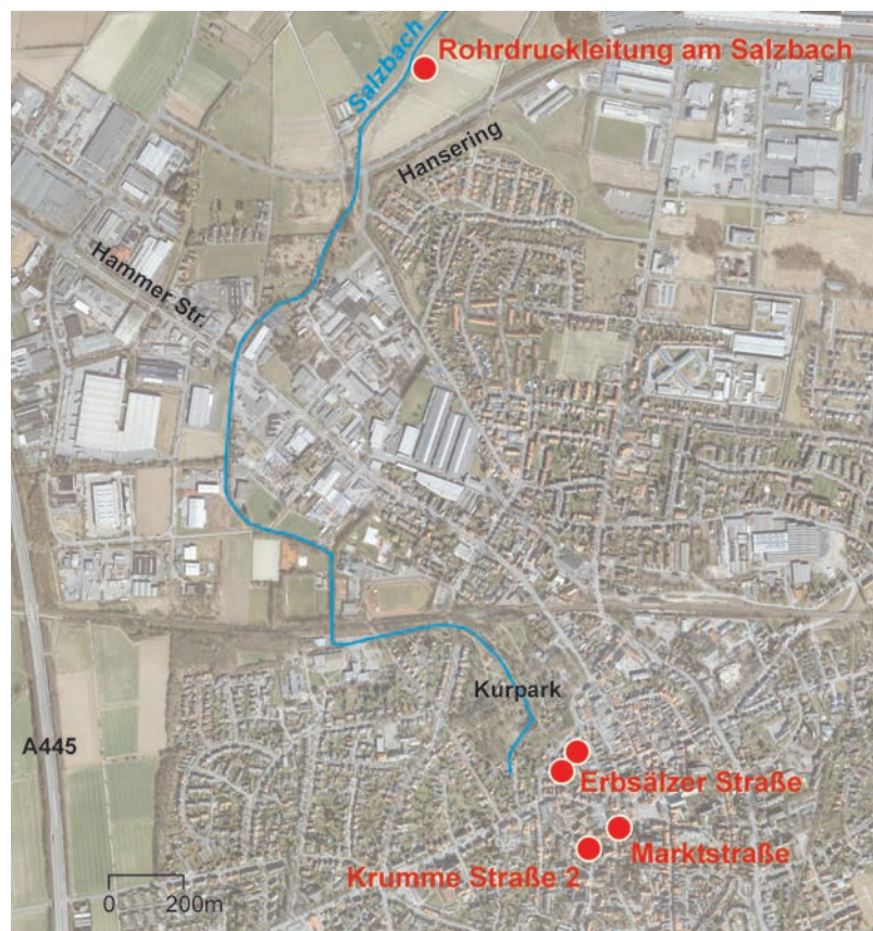
Abb. 1 Eisenzeitliche Fundstellen in Werl (Grafik: LWL-Archäologie für Westfalen/M. Zeiler; Kartengrundlage: Luftbildkarte NRW des digitalen Fundpunktverzeichnisses der LWL-Archäologie für Westfalen).

Weiter südlich in der Stadtmitte, an der Krummen Straße 2, legten Baumaßnahmen 1995 eine Grube mit einziehenden Wänden und mehreren Verfüllschichten frei, die eisenzeitliche Keramik und Briquetagen enthielt, aber schon durch mittelalterliche Bodeneingriffe gestört war.