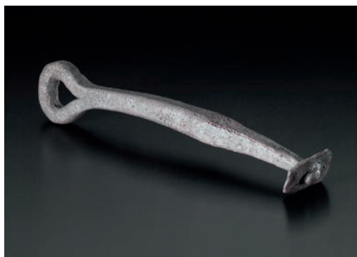
Abb. 3 Der ca. 20 cm lange Ösenstift wurde quer zu einer rot verbrannten Balkenspur vorgefunden. Diente er einst als Maueranker oder gelangte er durch Verschleiß in diesen Bereich? (Foto: LWL-Archäologie für Westfalen/S. Brentführer).

Speerspitzen wurden zwar diesmal nicht vorgefunden, doch lässt ein anderer Befund auf Kampfhandlungen schließen: Bei der Grabung wurde noch ein kleiner Teil des südlichen Grabenkopfes angeschnitten. Unmittelbar unter und zwischen den verstürzten Kalksteinen der ehemaligen Verblendung fanden sich Pferdeknöchel. Die endgültige Auswertung der Ausgrabung lässt also noch einige spannende Ergebnisse erhoffen.