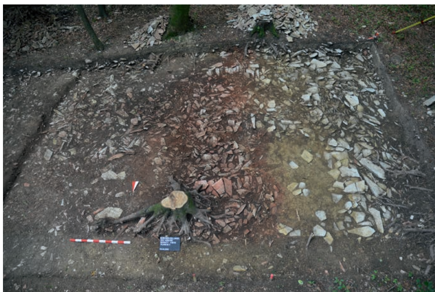
Abb. 1 Planum 3 von Norden nach Osten dokumentiert lässt in dem rot verbrannten Bereich bereits die Überreste der Mauer erahnen, direkt davor schließt sich eine Berme mit anstehendem gelben Lehm an, bevor der Graben mit unverbrannten verstützten Kalksteinen ansetzt. Bei dem schmalen Streifen unterhalb des Baumstumpfes handelt es sich um den verfüllten Schnitt der vorherigen Grabungskampagne (Foto: LWL-Archäologie für Westfalen/T. Meglin).

Als Befund zeigte sich zunächst der bereits genannte Kalksteinversturz der Mauer. Die