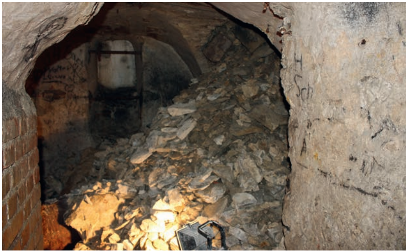
Abb. 4 Blick vom Keller- raum A in den zum Teil verschütteten mittelalter- lichen Kellerraum B.