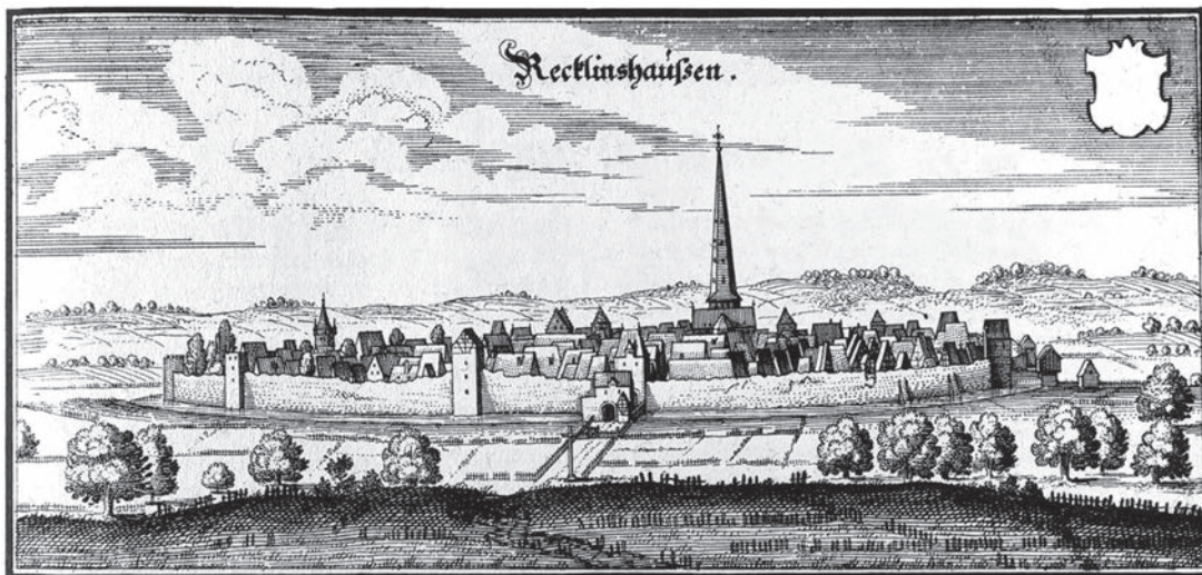
Abb. 1 Recklinghausen, Stadtansicht von Osten, Kupferstich von Wenzel Hollar/Werkstatt Matthäus Merian der Ältere, Einzelblatt 8 cm x 17 cm (Grafik: Institut für Stadtgeschichte Recklinghausen, Inv.-Nr. 2510).

Nördlich des Kirchengebäudes befand sich von alters her der Friedhof, der erst im frühen 19. Jahrhundert zugunsten einer neuen Anlage extra muros aufgelassen wurde. Südlich der Pfarrkirche, deren Patrozinium kölnische Einflüsse birgt, entwickelte sich im Hochmittelalter eine Marktsiedlung. Dieses Oppidum gehörte schon in vorstädtischer Zeit zum kölnischen Herzogtum Westfalen. Grundlage hier-