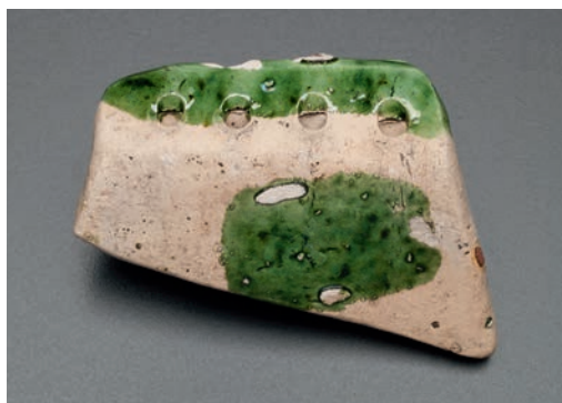
Abb. 4 (linke Seite) Plan der Ausgrabung (UNEARTH/W. Essling- Wintzer).

Excavations showed that a continuous pre-urban occupation and development existed to the west of St. Peter's as early as the 11 th and 12 th centuries. It left behind numerous features characteristic of their time and locality from the High Middle Ages to the early post-medieval period, which fit seamlessly into the basic development of the city's history. It was not possible to find any trace of a 9 th century palace, which had previously been assumed to have existed and to have had imperial privileges, although there is no mention of it in the written records either.