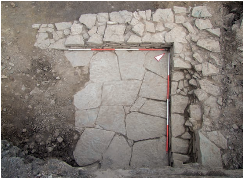
Abb. 4 Befund 18, die ältere Phase des Steinkellers.