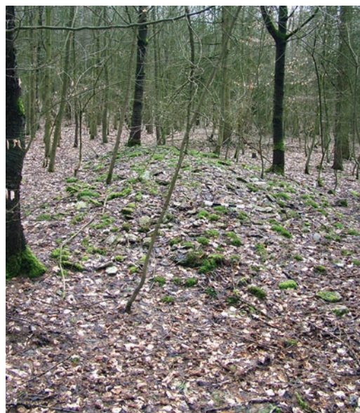
Abb. 4 Lesesteinhaufen auf dem Plateau des Räuschenberges.

Im unteren Bereich des Bielenberg-Südhanges sind ebenfalls langgestreckte Ackerterrassen zu beobachten. Auf eine spezielle gartenbauliche Nutzung dürften hingegen unregelmäßige Terrassen und parallel zur Hangneigung verlaufende Steinwälle in den oberen Hangbereichen verweisen, die unterschiedlich große Parzellen bilden (Abb. 5). Möglicherweise gehen sie, zumindest teilweise, auf die Anlage eines Weingartens am Bielenberg durch den Corveyer Abt Widukind (1189–1205) zurück. Der Jahresertrag wurde zu Widukinds Zeit mit sechs Fudern Wein beziffert, woraus mit aller Vorsicht auf eine Anbaufläche von etwa 2 ha geschlossen werden kann. Ihre Lage wird nicht näher beschrieben. Aufgrund des relativ großen Wärmebedarfs von Weinreben kommt aber in erster Linie der Südhang infrage. Die Überlieferung des Corveyer Weingartens zieht sich bis ins 17. Jahrhundert hinein, wobei aber noch nicht geklärt ist, ob zu dieser Zeit noch Weinbau betrieben wurde. Für das frühe 14. Jahrhundert ist zudem Hopfenanbau am Bielenberg überliefert. Anhand dieser drei Beispiele zeigt sich bereits, welche Qualitäten und Möglichkeiten die Auswertung von digitalen Geländemodellen unter Zuhilfenahme historischer und archäologischer Quellen in sich birgt.