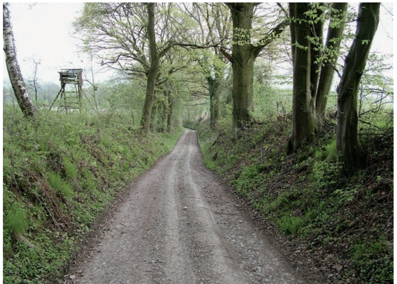
Abb. 2 Hohlweg zwischen Langstreifenflur und B 64/83.