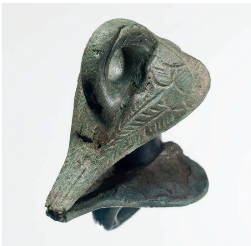
Abb. 3 Henkelattasche aus Bronze mit einer Höhe von 4,95 cm, 3./4. Jahrhundert n. Chr. (Foto: LWL-Archäologie für Westfalen/ S. Brentführer).

Abb. 2 Wahrscheinlich wurden die vier Backräume des Feldbackofens 8082 nacheinander genutzt. Die Funde aus den Verfüllungen stammen aus allen Teilen des römischen Imperiums (Foto: J. Markus).