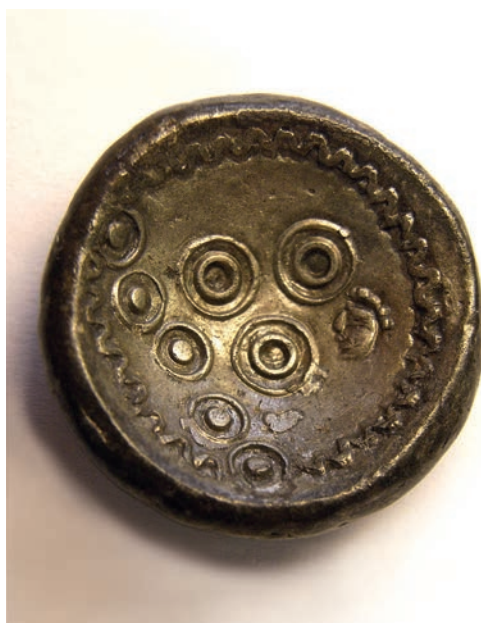
Abb. 1 Silbernes Regenbo- genschüsselchen aus Ickern (Foto: A. Speckmann).

dem höher gelegenen Flugsandrücken. Neben dem bereits 2009 freigelegten Hausgrundriss konnten zahlreiche weitere Befunde der vorrömischen Eisenzeit und der frühen römischen Kaiserzeit dokumentiert werden, darunter weitere Speicherbauten.