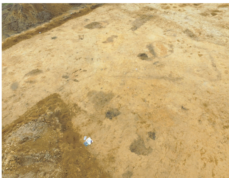
Abb. 2 Hausgrundriss aus der Vogelperspektive, Blick nach Süden (Foto: LWL-Archäologie für Westfalen/M. Esmyol).

seite erhalten, ein kaum erkennbares Wandgräbchen schließt nach Osten ab. Die Wandgräbchen hatten annähernd ebene bis schwach gewellte Sohlen. Indizien dafür, dass in ihnen stärkere Pfosten gestanden hätten, fehlen. Eher ist hier an eingegrabene senkrechte Boh-