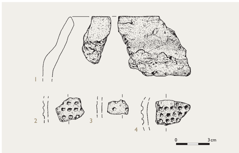
Abb. 4 Ausgewählte Keramik. 1: Randscherben (Bef. 138A); 2–4: Scherben mit Grübchenverzierung (Bef. 129, 214, 157) (Grafik: LWL-Archäologie für Westfalen/M. Kloss).

chene, ehemals wohl zylindrische Vorratsgrube dokumentiert, die durch den anstehenden Schluff bis an eine Eisenschwartzschicht des Tertiärs reichte. Ein Speicher befindet sich 3 m westlich des Hausgrundrisses, ein weiterer, schon in den Suchschnitten des Jahres 2015 entdeckter Vierpfostenspeicher 23,5 m südlich. Zwei schmale Gräbchen bilden offensichtlich eine durchgehende Linie, die auf die Südwestecke des Grundrisses Rücksicht zu nehmen scheint. Das vorgeschichtliche Alter dieser fundleeren Struktur bleibt aber fraglich.