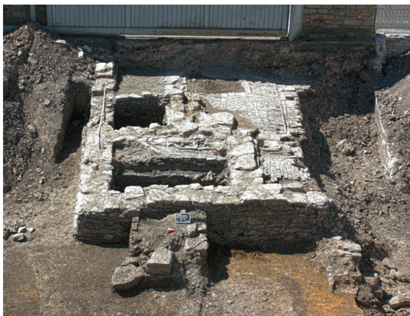
Abb. 5 Fläche 17: Gut erkennbar ist der gepflasterte und kanalisierte Hofbereich und der sich im Vordergrund andeutende Latrinenschacht.

bindung bringen lässt. In der Folge wurden im Untersuchungsbereich zwei Grundstücke angelegt, von denen das nördliche mit der ältesten Steinbauphase durch die Unterkellerung der Nachkriegsbebauung in weiten Teilen gestört war. Die zeitliche Einordnung der vielschichtigen Bauabfolge fällt aufgrund des Fehlens von datierendem Fundmaterial schwer. Die wiederum überlagernden Planierschichten datieren frühestens in die Zeit der klösterlichen Neugestaltung. Auch die räumliche Zuordnung der Strukturen war aufgrund jüngerer Bodeneingriffe bzw. Überlagerungen durch eine Verbreiterung der Straße Spitalmauer nicht möglich. Dennoch konnte die Nutzung eines Teilbereiches als straßenseitiger Hof mit sogenanntem Tudorfer Pflaster und oberirdischem Kanal belegt werden ( Abb. 5 ). Ein trocken gesetzter, annähernd quadratischer Latrinenschacht schloss sich im Osten an. Die Errichtung des Kapuzinensienklosters im frühen 17. Jahrhundert beendete auch hier letztlich die Geschichte aller mittelalterlich-frühneuzeitlichen Grundstücksstrukturen.