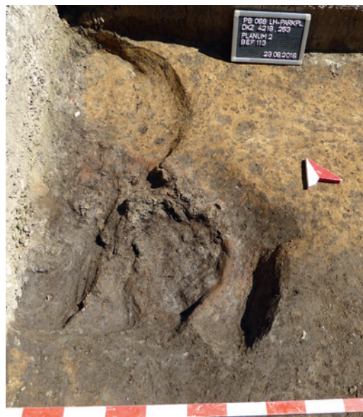
Abb. 2 Eine schlichte Ofenanlage zur Metallverarbeitung aus dem 12./13. Jahrhundert (Foto: LWL-Archäologie für Westfalen/E. Manz).

in Verlängerung der Königsstraße von der Kisau nach Norden und erschloss die hinteren Grundstücksbereiche bis hin zur Pader. Dass im 12. und 13. Jahrhundert nahe dem Neu-