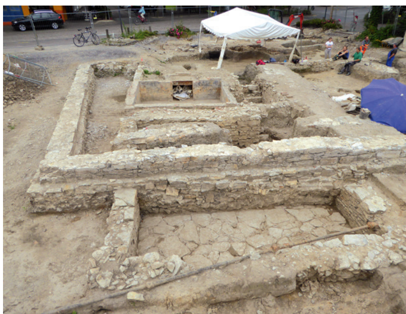
Abb. 4 Das kaiserzeitliche Grubenhaus mit eingefallenem, verziegeltem Wandlehm (Foto: LWL-Archäologie für Westfalen/R. Süße).