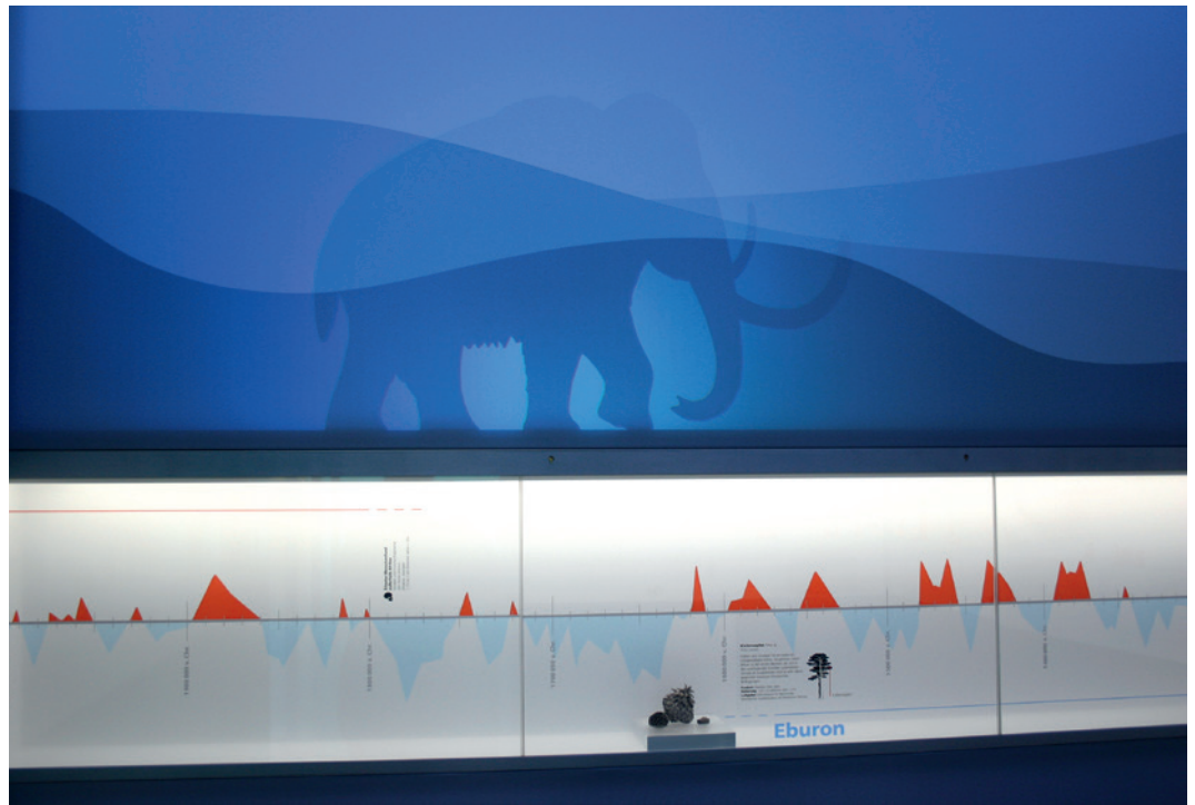
Abb. 4 Ein Blick auf die Wand im Klimakubus, an der die Kaltzeit vor 2 bis 1,5 Millionen Jahren dargestellt wird (Foto: LWL-Museum für Archäologie/ S. Jülich).