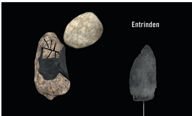
Abb. 5 In einer Animation wird die Herstellung eines Faustkeiles demonstriert. Hier ein Standbild von einem der ersten Arbeitsschritte, dem Entrinden des Kerns mithilfe eines Schlagsteins. Rechts im Bild ist das Endprodukt zu sehen (Animation: LWL-Museum für Archäologie/ Fa. Puppeteers).

Der Klimakubus im neuen Kleid ist jetzt fertig und das Ergebnis ist ein stimmungsvoller Raum. Wer nicht viel lesen will, erfährt allein durch die wechselnde Lichtstimmung und die auftauchenden und wieder verschwindenden Tiere vom klimatischen Wechsel (Abb. 4). Wer mehr Interesse hat, kann sich anhand der Klimakurve mit eingebauten Exponaten aus der Zeit von 2.000.000 bis 20.000 Jahren v. Chr. und deren Erläuterung über den Wandel informieren und über die Bedeutung, die dieser Wandel für die Menschheit hat.