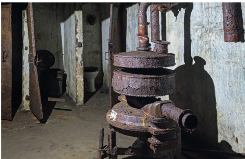
Abb. 4 Luftförderer der Firma Auer im Vordergrund, Aborte mit Spülwasserbehälter im Hintergrund.

Das Fassungsvermögen richtete sich nach der Wasser- und Frischluftversorgung. Da ein Luftförderer vom Typ »MR 2400« der Berliner Auergesellschaft AG erhalten geblieben war, können präzise Aussagen getroffen werden: Laut Werksangaben versorgte das Gerät