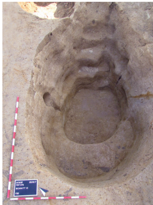
Abb. 1 Befund 35, bei dem es sich wohl um ein Deckungsloch handelte, im Endplanum (Foto: Stadtarchäologie Soest/ J. Ricken).

Mit dem Ausbruch des Krieges 1939 wurde die noch unfertige Kaserne zum sogenannten Stammlager für Kriegsgefangene, dem »Stalag VI E«, erklärt. Bereits im Mai 1940 trafen die ersten französischen Offiziere ein, sodass das Lager im Juni 1940 offiziell in »Oflag VI A« umbenannt wurde. Gemäß der Genfer Konvention durften die gefangenen Offiziere