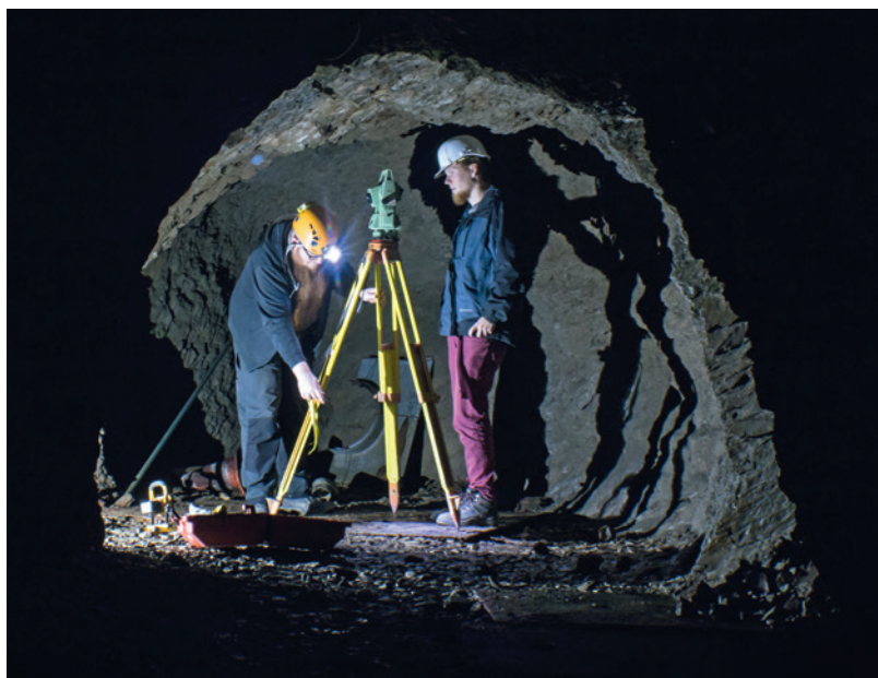
Abb. 1 Tachymetrische Vermessung unter Tage im Siegener Luftschutzstollen (Foto: LWL-Archäologie für Westfalen/T. Poggel).

Die erste geschossene Strecke (Sprengtechnik) maß ca. 9 m in der Länge und 1,6 m in der Breite. Am Ende führte sie westlich in einen 5 m 2 großen Vortriebsbereich und östlich mit einer Länge von ca. 8 m und einer Breite von 2 m auf einen Bunker zu. Die zweite, geschrämte Strecke (Handarbeit) war ca. 7,5 m lang und nur 0,95 m breit. Sie führte in nord-östlicher Richtung zum Bunker. Ferner existierte ein weiterer ca. 10 m 2 großer Vortriebsbereich Richtung Norden, der abrupt abgebrochen worden war: Fertige Bohrlochpfeifen warteten auf ihre Bestückung mit Sprengstoff (Abb. 2). Der rechteckige Bunkerausbau selbst war ca. 9,6 m × 5,3 m groß und besaß einen Boden aus Betonestrich. Eine verputzte Ziegelwand in Längsrichtung stabilisierte den Raum und teilte ihn in zwei Bereiche. Die Firsthöhe in der gesamten Anlage variierte zwischen 1,9 m und 2,5 m. Die Decke wurde von mehreren Metern Gestein überdeckt.