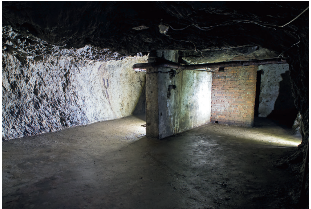
Abb. 3 Bunkerausbau mit nachträglich eingebauter Splitterschutzwand.

mehr dokumentiert werden. Der östliche Eingang war in der Nachkriegszeit überschüttet und überbaut worden. Des Weiteren waren rechtwinklig abknickende Zugänge oder Schutzkonstruktionen im Vorfeld der Anlage vorgesehen, um vor Splintern und Druckwellen zu schützen. Dieses Objekt besaß im Innern ein Hindernis in Form einer 0,32 m starken Ziegelwand parallel zur Eingangstür (Abb. 3).