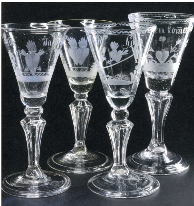
Abb. 5 Kelchgläser mit Herzsymbolik, thüringisch-fränkischer Typus, 18. Jahrhundert.