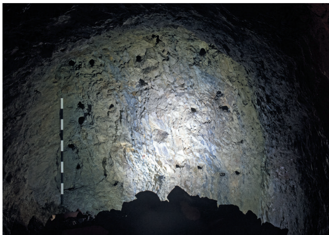
Abb. 2 Querschnitt durch den Stollen mit dem Vortriebsbereich mit bis zu 1,20 m × 0,06 m großen Bohrlochpfeifen.

Für den baulichen Luftschutz war das Reichsluftfahrtministerium verantwortlich, das Anforderungen an einen Schutzraum aufstellte. Der Siegener Schutzraum wurde als Hangstollen angelegt, was im Vergleich zu Tiefstollen und Hochbunkern weniger Bauaufwand bedeutete. Idealerweise sollten ein Haupteingang mit Gasschleuse und ein Notausgang existieren. Zwar besitzt der Siegener Stollen zwei Zugänge, aber eine Schleuse in Form eines zusätzlichen Raumes oder zweier gegenseitig verriegelnder Türen konnte nicht