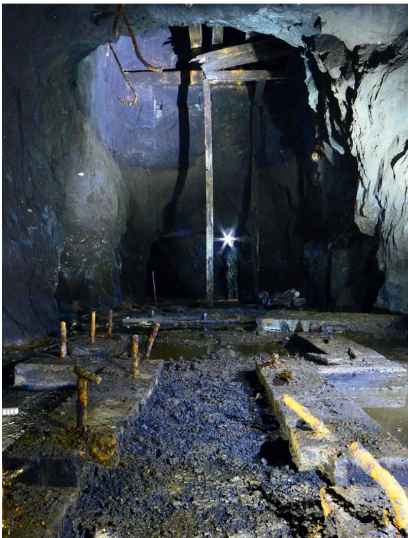
Abb. 2 Blick vom Dampfmaschinenfundament im Vordergrund in die Schachthalle der Grube Brüche mit dem teilweise noch erhaltenen Schachtgerüst und der Bühne (Foto: Altenberg- & Stahlbergverein e. V. Müsen/R. Golze).

wechselweise für Scanner oder Zielzeichen, deren Aufstellung im teils hüfthohen Wasser viel Zeit benötigte, aber trotz widriger Bedingungen möglich war. Zur Aufnahme des gesamten zugänglichen Grubenbaus waren 35 Scannerstandpunkte notwendig. Da nur ein Tag zur Vermessung zur Verfügung stand, mussten die Standpunkte im Stollen weit voneinander entfernt gesetzt werden. Da der Fokus auf den Schachthallen lag, wurden