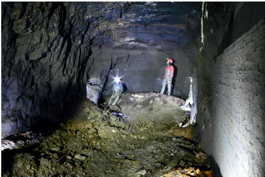
Abb. 5 Blick von Westen in die dritte Halle unbekannter Funktion (Foto: Altenberg- & Stahlbergverein e. V. Müsen/R. Golze).

Das Ergebnis der gemeinsamen Dokumentation der Kooperationspartner ist nichts weniger als die bislang größte montanarchäologische 3-D-Vermessung untertage in Westfalen. Sie ermöglichte die erste vollständige Darstellung des komplexen Blindschachtbereichs der Grube Brüche samt Anschlüssen: Selbst in den jüngsten Kartierungen fehlte eine komplette Maschinenhalle. Auch für das Umfeld zeigt der Vergleich zwischen neuer und alter Kartierung aus der Zeit um 1880 deutlich, dass die historische Karte nur in Teilen ein Abbild der Realität und damit ein wichtiges Beispiel dafür ist, dass selbst relativ junge historische Dokumente in ihrer Aussagekraft sehr beschränkt sein können.