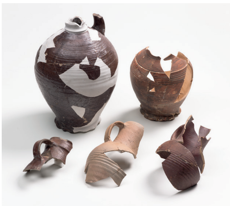
Abb. 3 Keramikbruch, darunter von rotengobiertem Protosteinzeug, von der Ortsstelle Wiebelhausen bei Burbach.

(Bergmann/Thede 2012) und war später nur noch eine Kapelle. Diese ist dann 1571 abgerissen worden. Die Ortsstelle Wiebelhausen nahe der Kalteiche zeigt eine Nachbarschaft von Siedlung und Eisenverhüttung. Aus dem Umfeld mehrerer Podien der Ortsstelle liegt extrem großformatiger Keramikbruch vor, darunter von bauchigen Krügen mit Wellenfuß (Abb. 3).