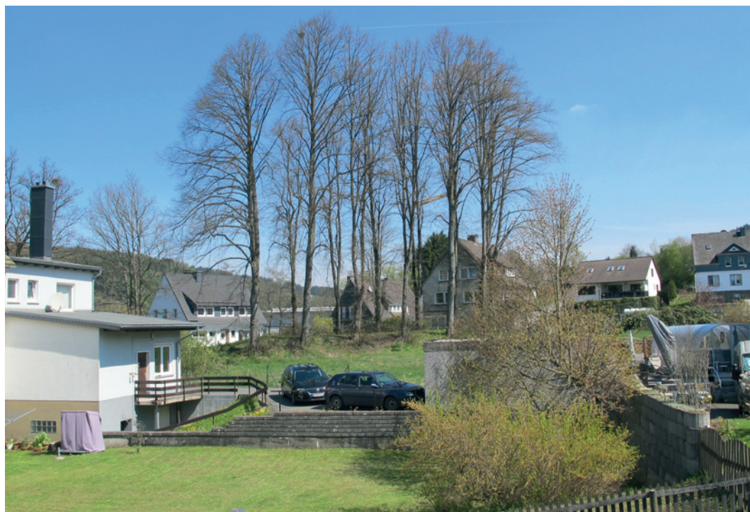
Abb. 4 Die Freifläche mit dem Lindenkrantz markiert den Standort der »Odebornskirche« bei Bad Berleburg (Foto: LWL-Archäologie für Westfalen/R. Bergmann).

Betrachtet man die Abb. 1 abschließend, so fällt auf, dass im Kreis nur das Kommunalge-