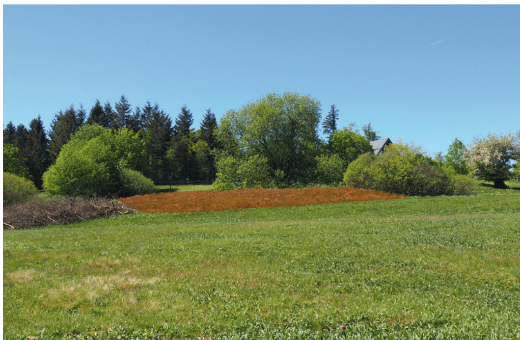
Abb. 2 Die Kirchenstelle Webach in der Ginsburger Heide bei Hilchenbach-Lützel.

gilbrecht, Gambach, Mieschenbach, Oyentorff, Patschoß, Webach, Weningen, Wiebelhausen und eine solche unbekanntes Ortsnamens in der Flur »Alte Heide« bei Freudenberg. Aus dem weiteren Umfeld von Mieschenbach ist zudem eine Töpfereiwüstung bekannt. Unter den Wüstungsobjekten des Altkreises Siegen ist die 599 m hoch gelegene Kirchenstelle Webach unweit der Ginsburg aufgrund ihres Erhaltungszustandes bedeutsam (Abb. 2). Sie ist noch 1319 als Kyrche zu Weybach bezeugt