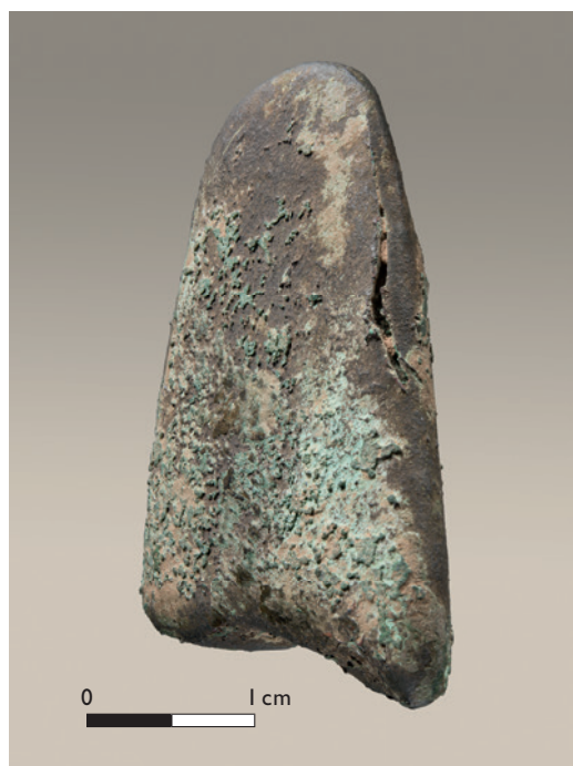
Abb. 4 Mutmaßlicher Gussfehler im Lateralbereich der Beilklinge.