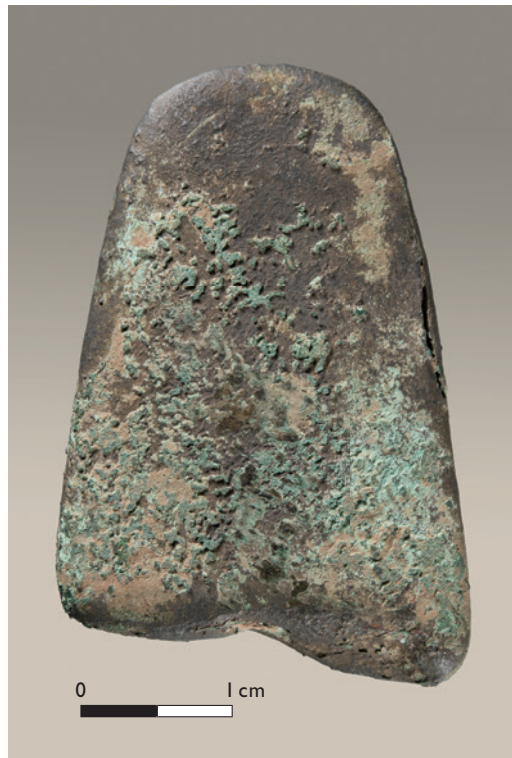
Abb. 1 Kupferbeilklinge vom jungneolithischen Erdwerk auf dem Frömkenberg bei Willebadessen-Peckelsheim, Länge 4,2 cm.