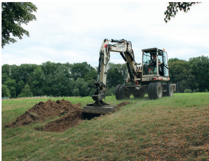
Abb. 3 Fundamentausbruchgraben der Stadtmauer an der Hangkante zum Osthagen, dem ehemaligen Stadtgraben (Foto: LWL-Archäologie für Westfalen/N. Wolpert).