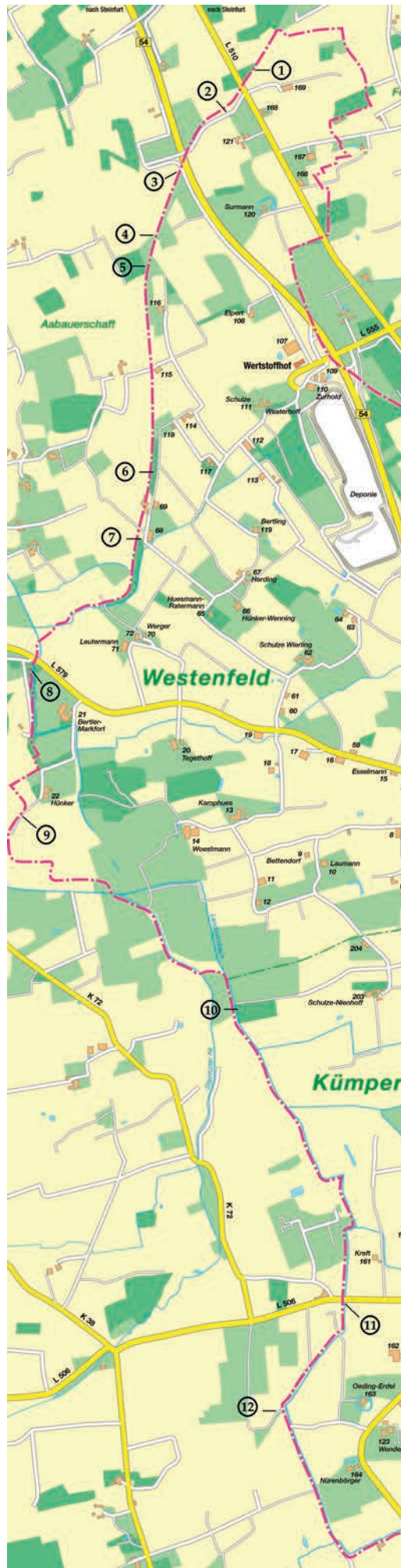
Abb. 4 An zwölf ausgewählten Stationen kann die Altenberger Landwehr erkundet werden (Kartengrundlage: Gemeinde Altenberge; Bearbeitung: W. Borgschulte).

keit zu bieten, im Schutz der Wälle Positionswechsel vorzunehmen.