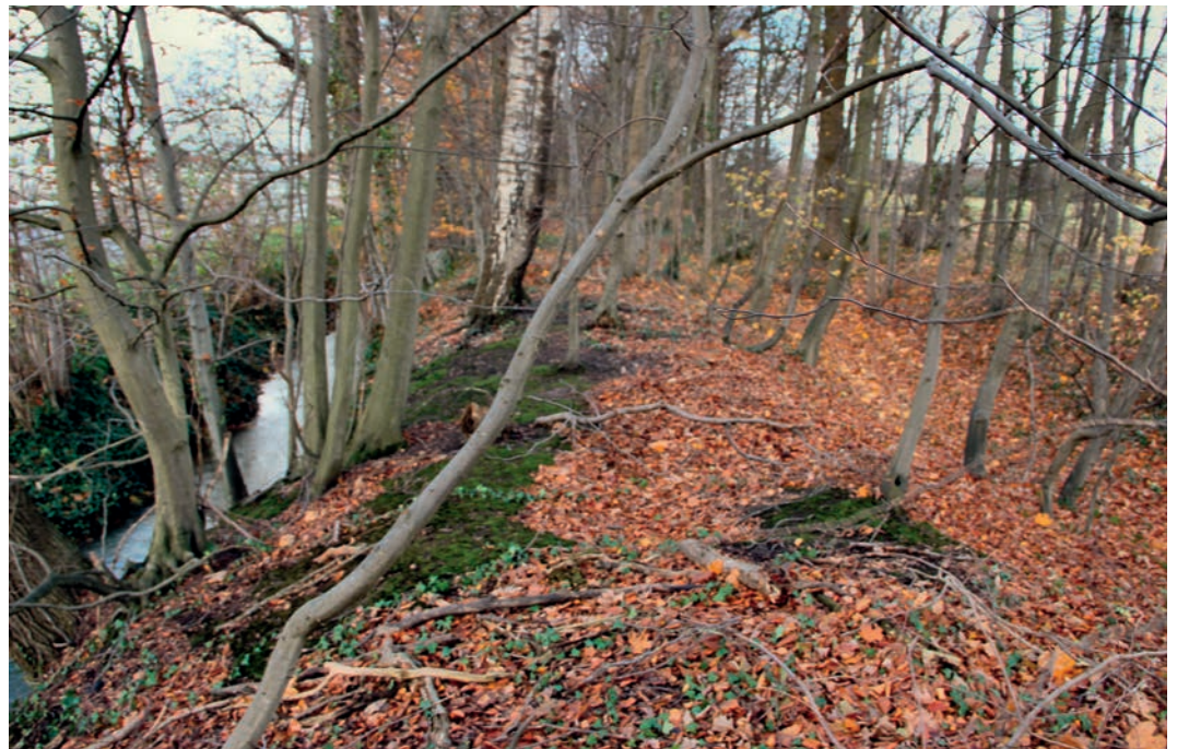
Abb. 2 Eine typische Ansicht der Altenberger Landwehr im heutigen Zustand (Foto: W. Witte).

Die Altenberger Landwehr, die ihre Fortsetzung in der nach Norden anschließenden Nordwalder Landwehr als heutige Gemeindegrenze nach Laer findet, wird erstmals 1395 erwähnt. Sie ist als Grenzsicherung der Kirchspiele auf Veranlassung des Bischofs von Münster als Landesherrn von den Kirchspielbewohnern errichtet und laufend instand gehalten worden. Ihr kontinuierlich über mehr als sechs Jahrhunderte unveränderter Verlauf ist heute noch trotz starker Beschädigungen im Gelände gut zu verfolgen. Auf einer Karte der Reichsgrafschaft Steinfurt von Heinrich Nehmer aus dem Jahr 1597 ist sie als Bestandteil von deren Ostgrenze mit den Schlagbäumen »Sturle Baum« in der Beerlage im Süden und »Plettendorfer Bäume« im Norden verzeichnet ( Abb. 1 ). Eine dritte Passiermöglichkeit wird sich an der alten Laerstiege (heute Laerstraße) befunden haben. Die beiden namentlich bekannten Durchgänge in der münsterischen Landesgrenze wurden ständig von Baumschließern bewacht, deren Wohn-