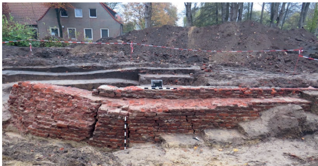
Abb. 3 Der freigelegte Abschnitt der Vredener Stadtmauer im Bereich der Baugrube für das neue Pfarrhaus St. Georg. Deutlich zeigen sich die Setzungsrisse an dem ohne stützende Pfahlgründung errichteten Mauerwerk.

In jüngster Zeit stand zudem der Bereich eines weiteren Elements der Vredener Stadtbefestigung im Fokus: das Windmühlentor. Bereits 2017 konnte im Zuge eines benach-