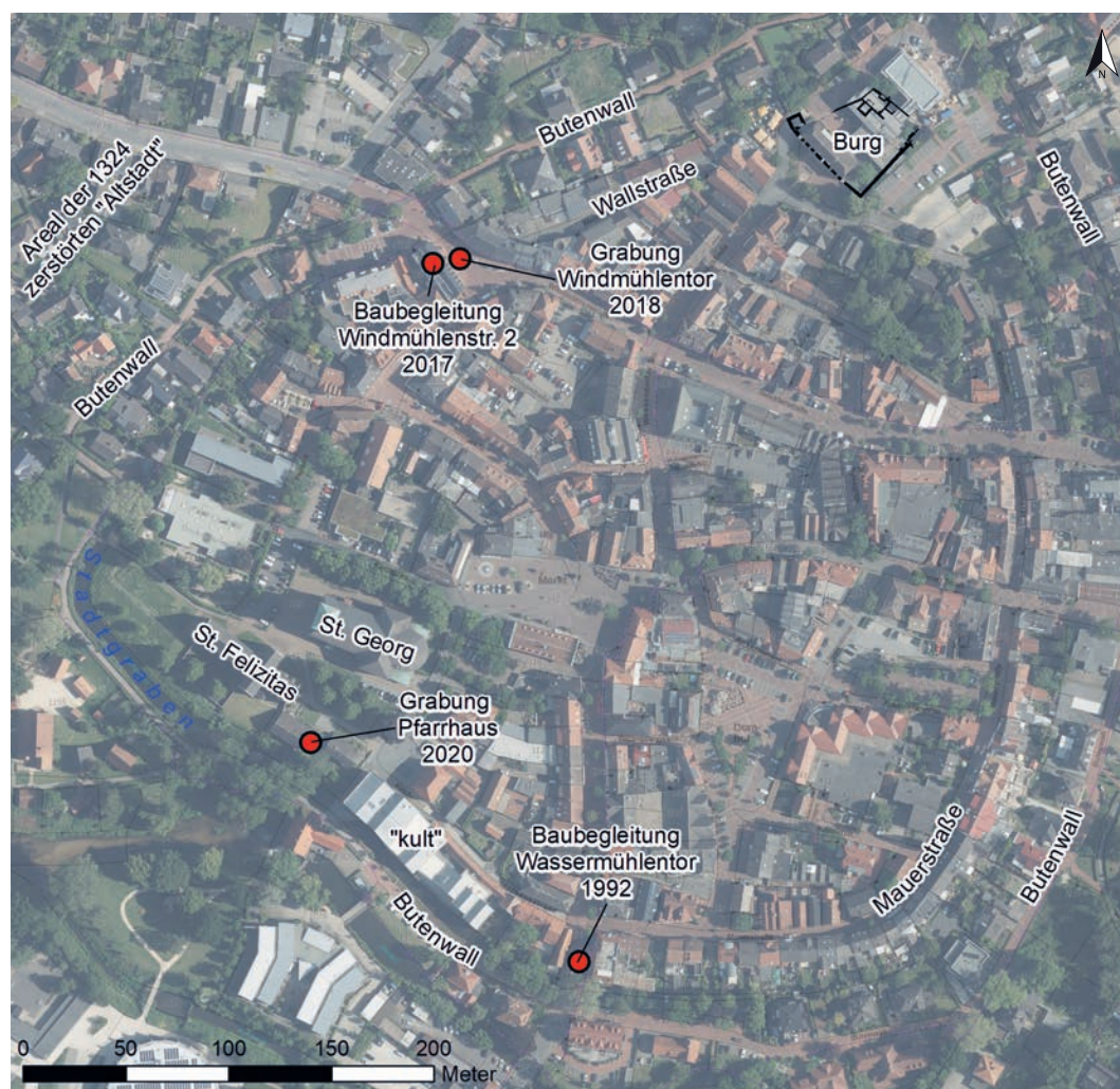
Abb. 1 Die Innenstadt Vredens im Luftbild. Hervorgehoben sind ausgewählte Lokalitäten, Straßennamen und archäologische Beobachtungen mit Hinweisen auf Verlauf und Gestalt der Stadtbefestigung (Kartengrundlage: Land NRW [2020] – Lizenz dl-de/zero-2-0; Grafik: LWL-Archäologie für Westfalen/A. Wunschel).

munitätsbezirks des auf die Karolingerzeit zurückgehenden Damenstifts (das Areal rund um St. Georg und St. Felizitas). Das Stift bildete den wesentlichen Ausgangspunkt für die weitere Entwicklung der angrenzenden Siedlung,