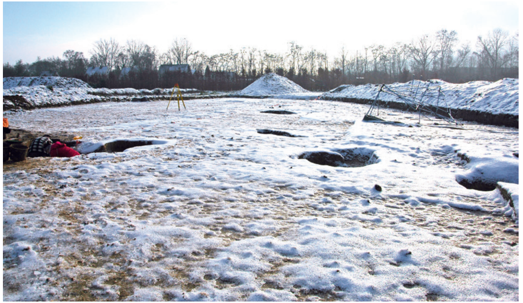
Abb. 2 Winterimpressionen auf der Grabungsfläche (Foto: LWL-Archäologie für Westfalen/E. Manz).