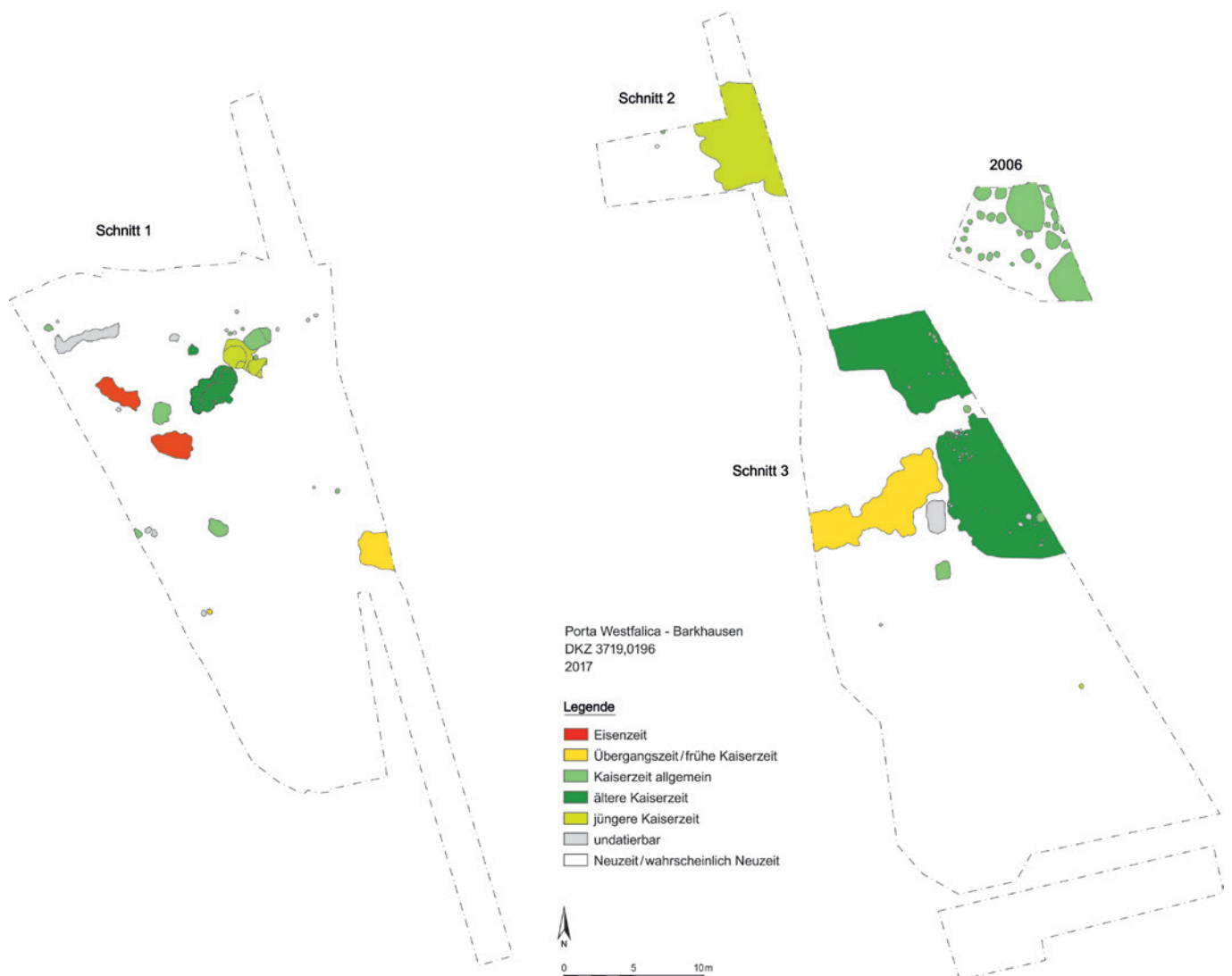
Abb. 1 Übersichtsplan der Grabung »Zwischen den Dämmen« in Porta Westfalica.