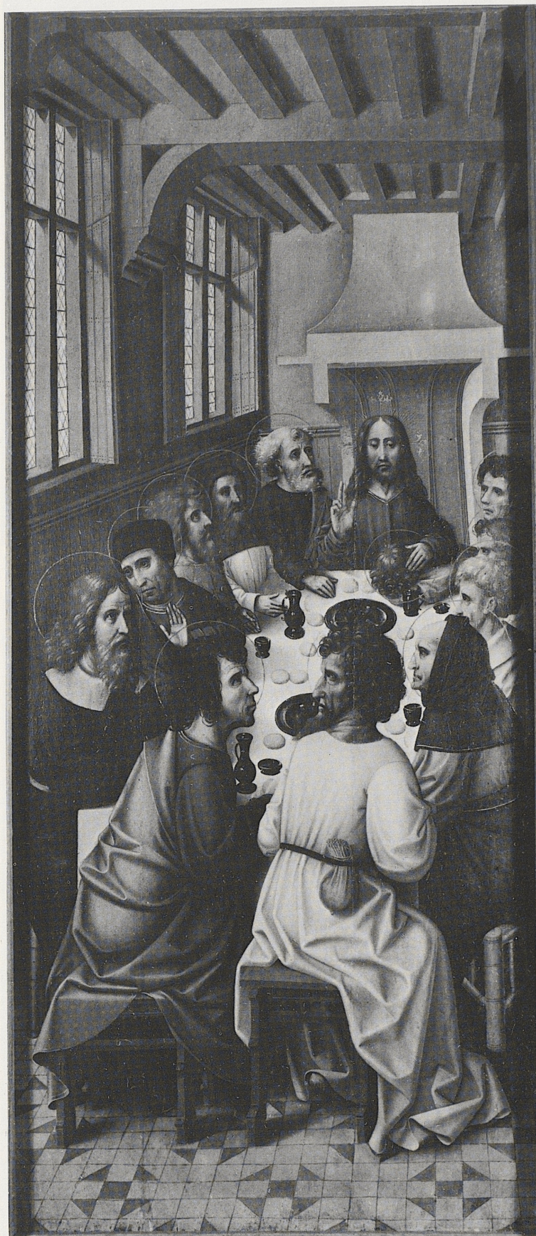
154 Das letzte Abendmahl, sog. Meister von Orsoy, Brüssel, um 1500, Kat. Nr. 123