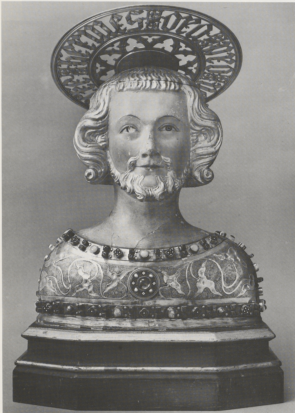
166 Büstenreliquiar des hl. Hermes, Köln, 2. Viertel des 14. Jahrhunderts, Kat. Nr. 135