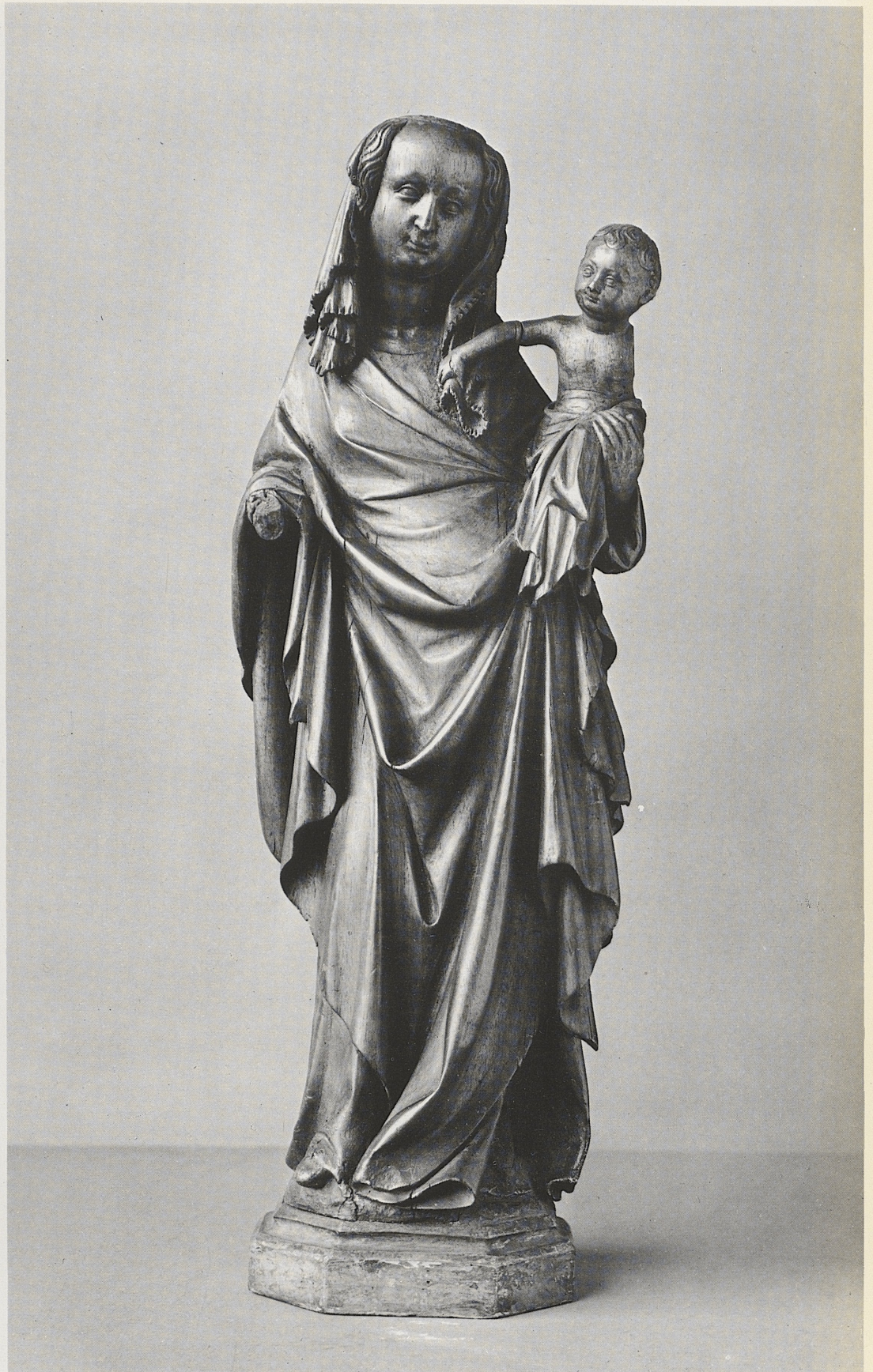
176 Muttergottes mit Kind, gelderländisch, 1. Viertel des 15. Jahrhunderts, Kat. Nr. 147