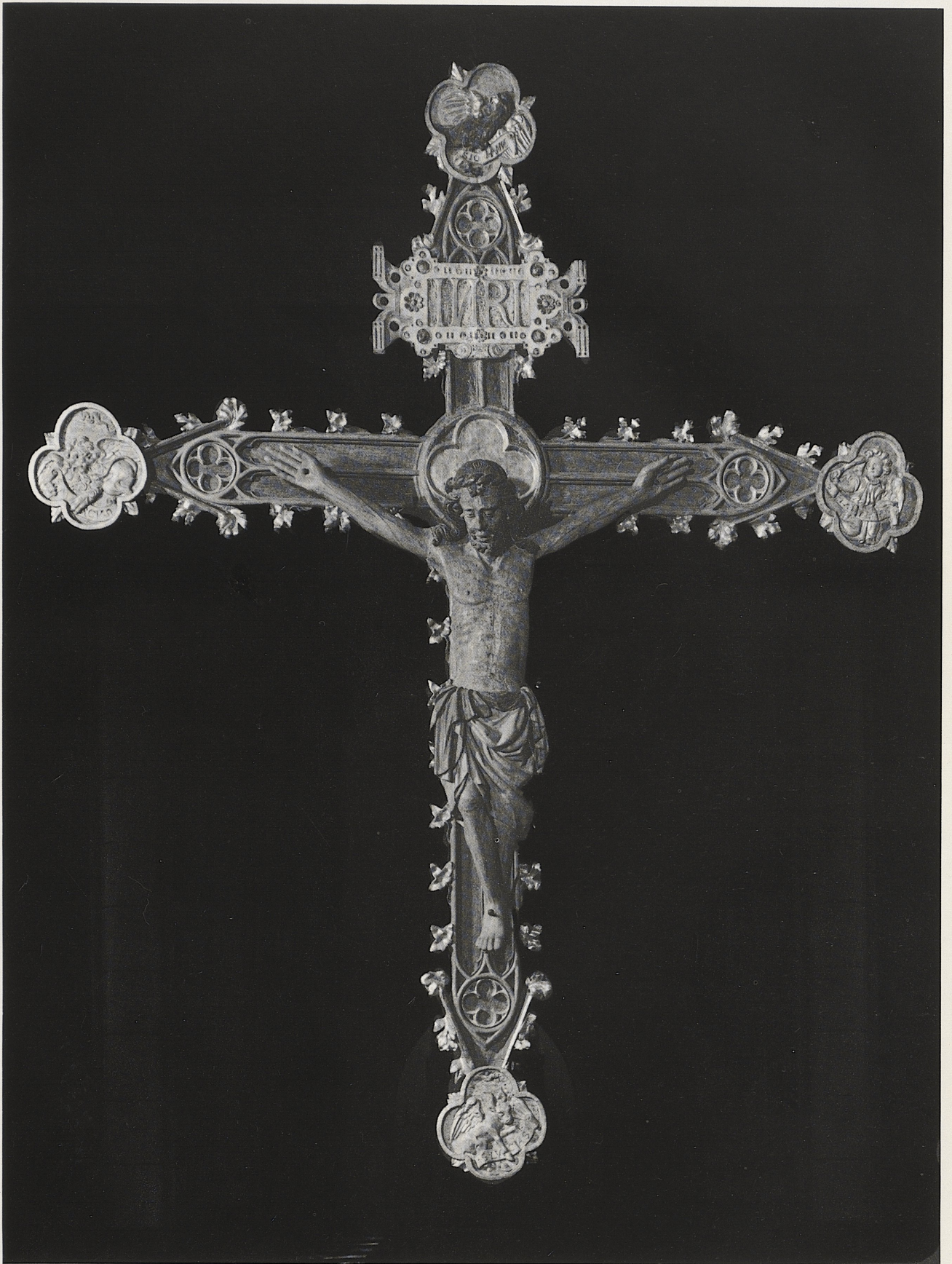
178 Kruzifixus, rheinisch, um 1410, Kat. Nr. 149