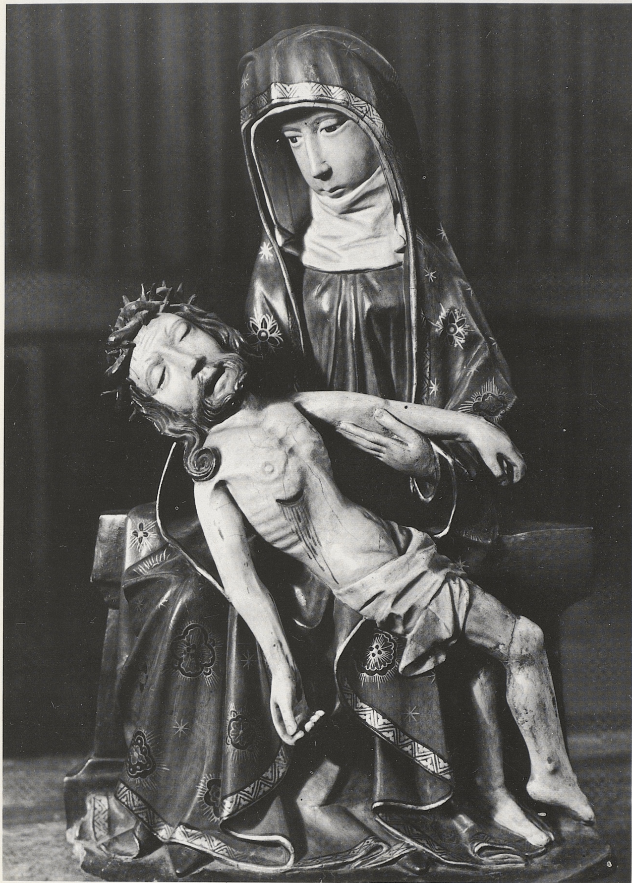
175 Marianklage, Ende des 14. Jahrhunderts, Kat. Nr. 145