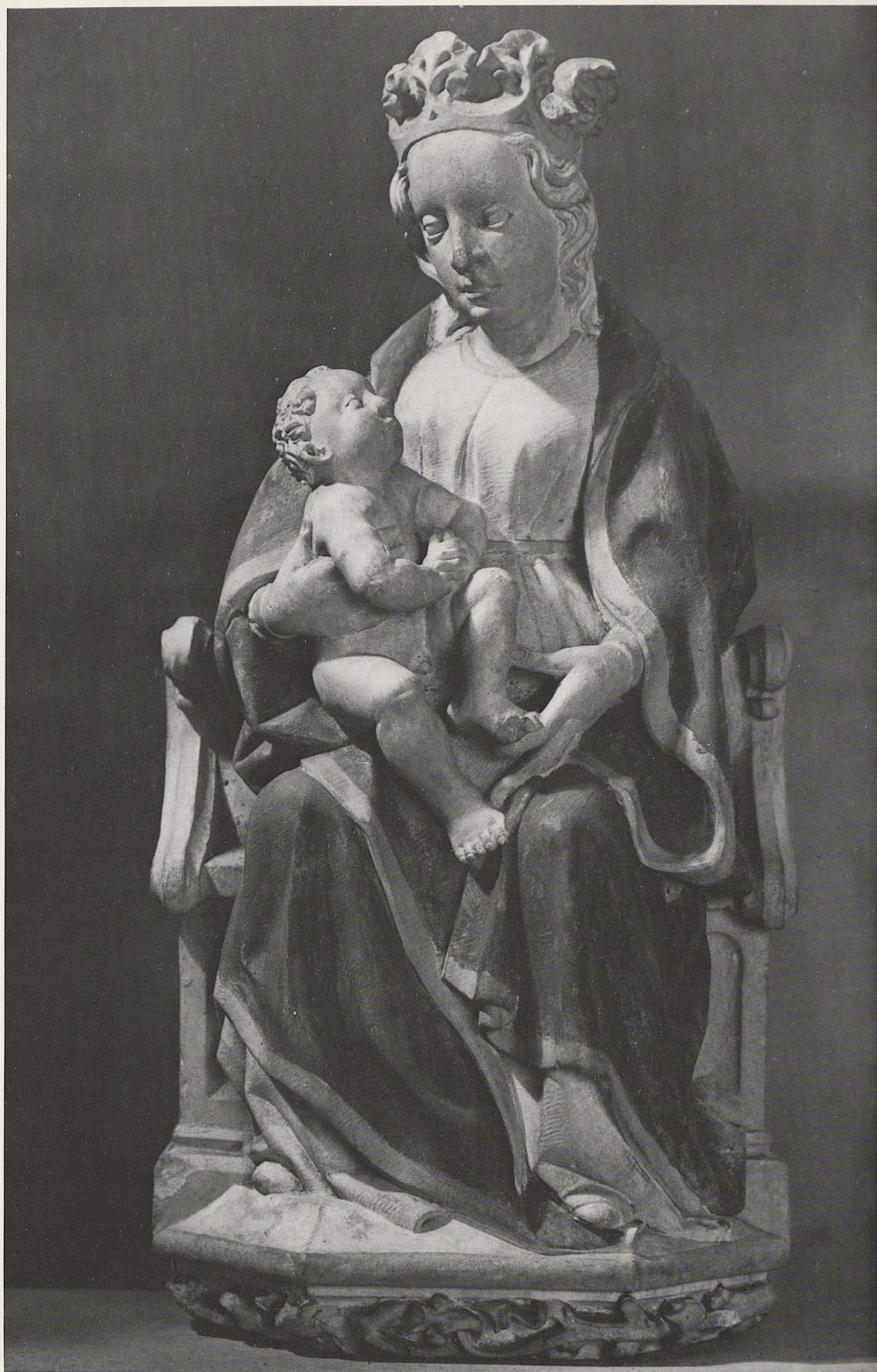
180 Madonna von einem Sakramentshaus, Konrad Kuyn, Köln, um 1461, Kat. Nr. 152