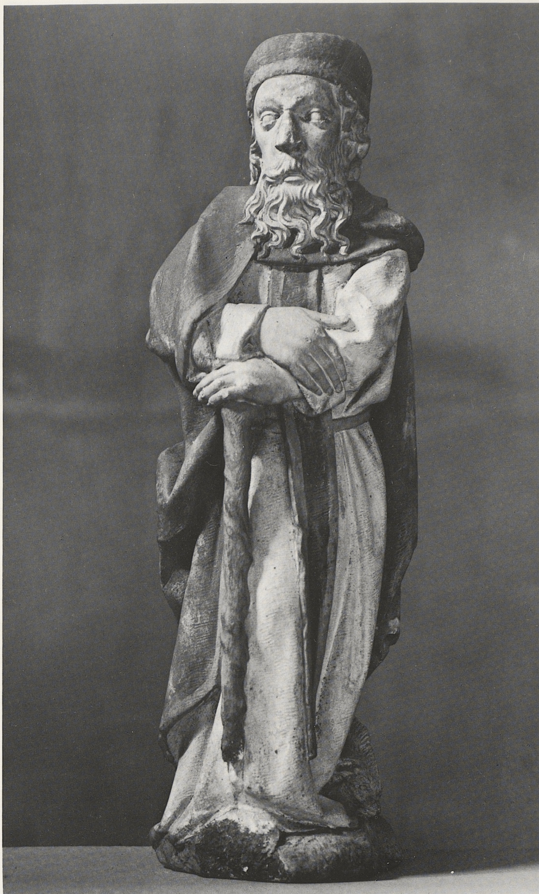
182 Hl. Antonius von einem Sakramentshaus, Konrad Kuyn, Köln, um 1461, Kat. Nr. 154