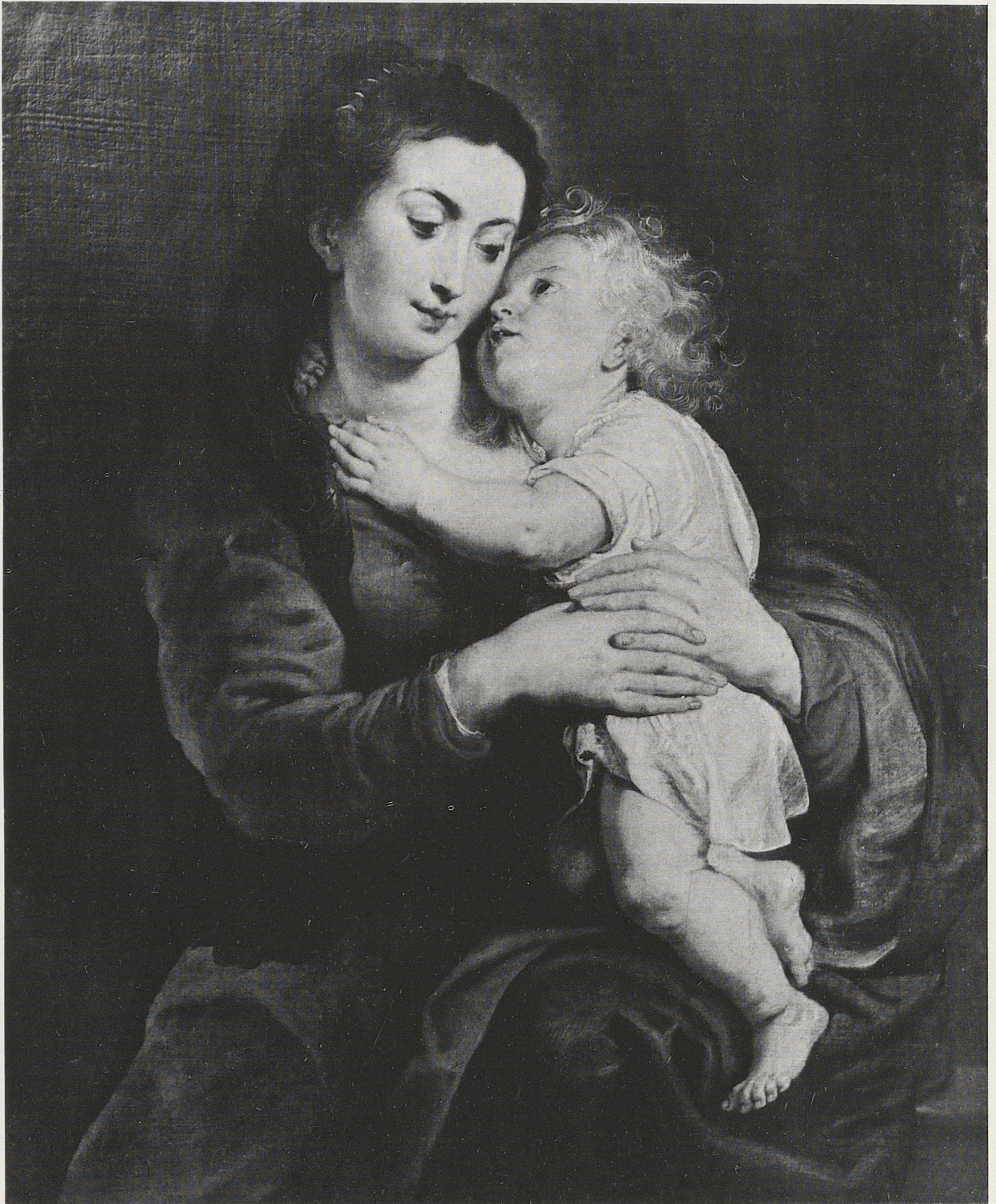
159 Maria mit Kind , P. P. Rubens (Replik), Kat. Nr. 126