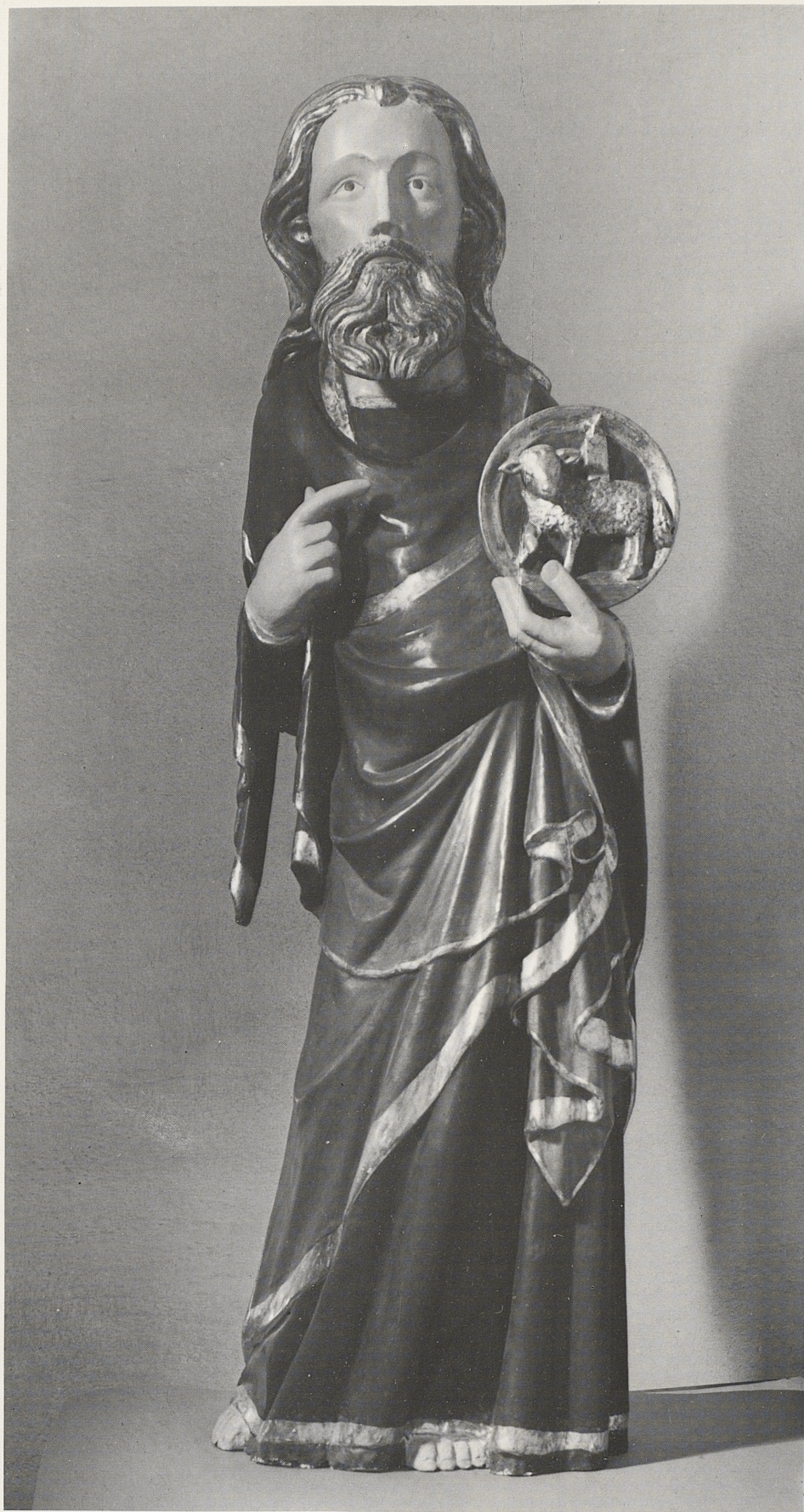
171 Hl. Johannes der Täufer, Köln, um 1350, Kat. Nr. 140