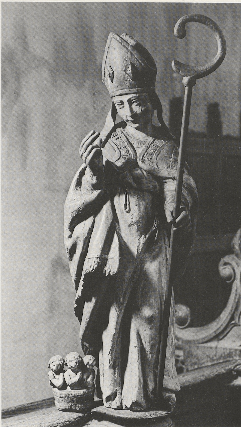
172 Hl. Nikolaus, rheinisch, spätes 14. Jahrhundert, Kat. Nr. 142