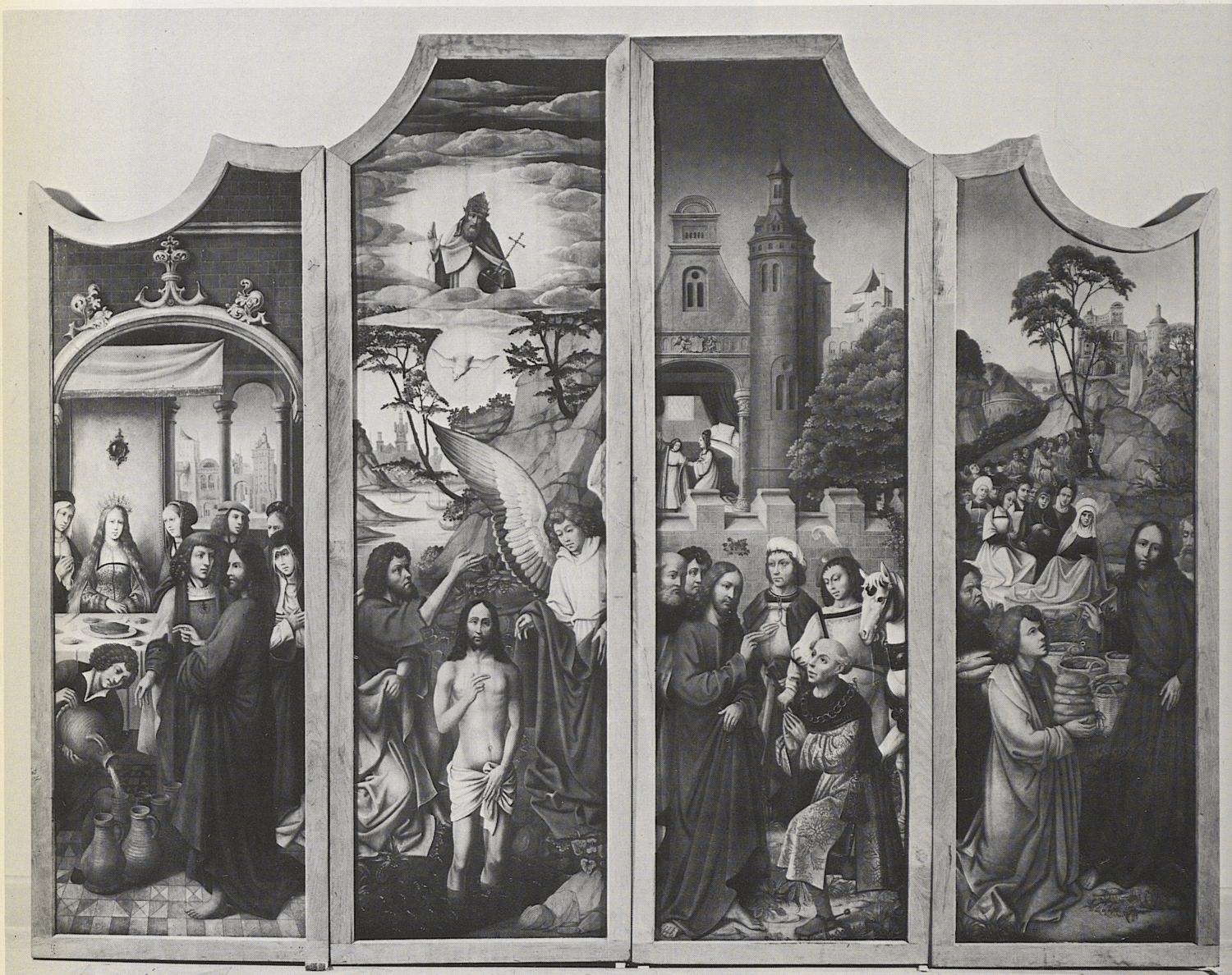
156 Bitterleidenaltar (geschlossen), Antwerpen, um 1510, Kat. Nr. 124