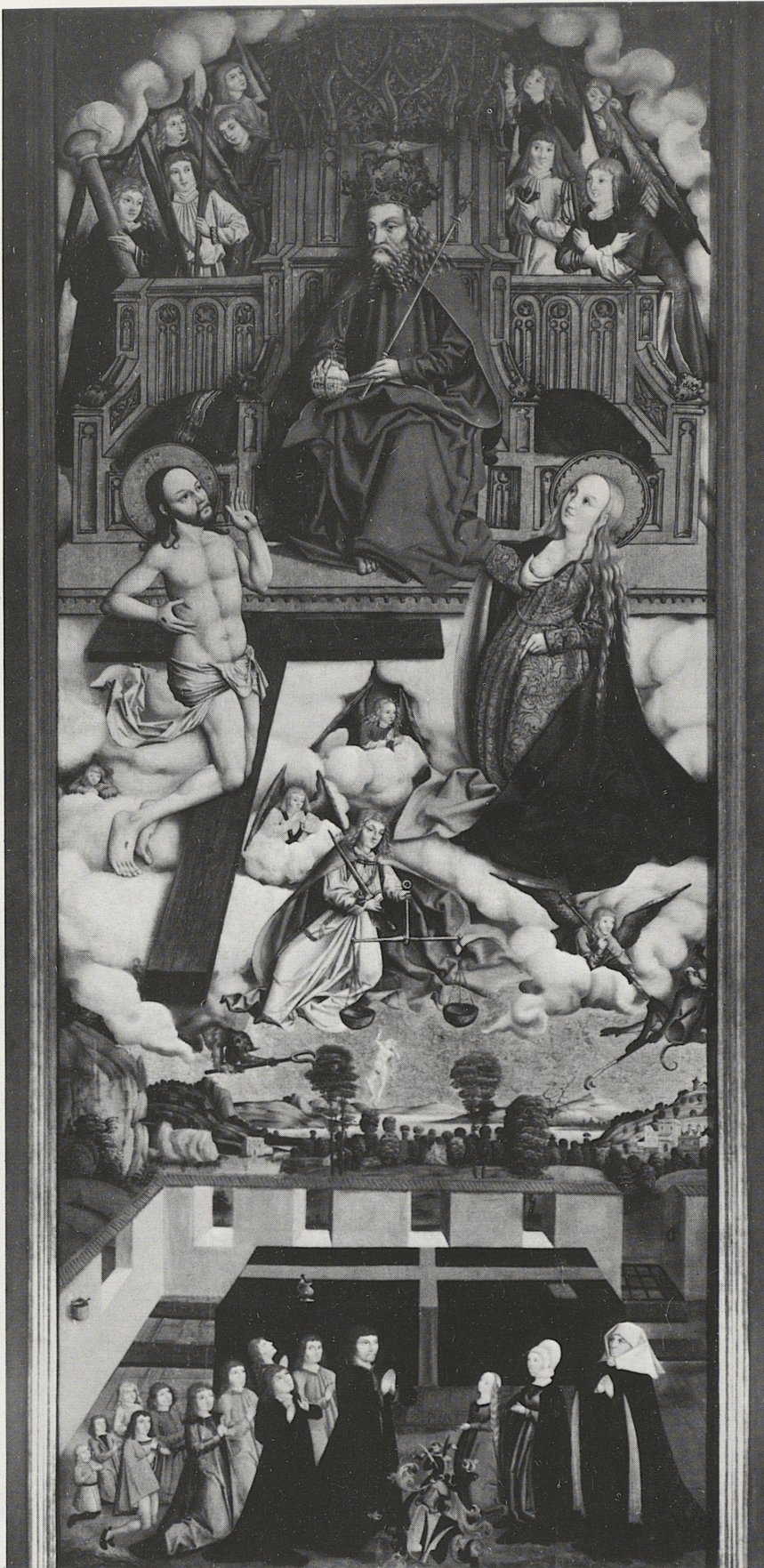
158 Fürbittebild, Schwaben, 1500/10, Kat. Nr. 125