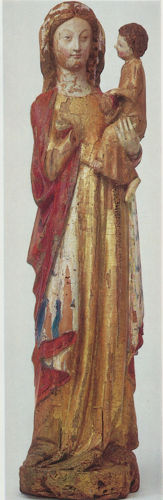
XVII Muttergottes, Köln, um 1300, Kat. Nr. 131