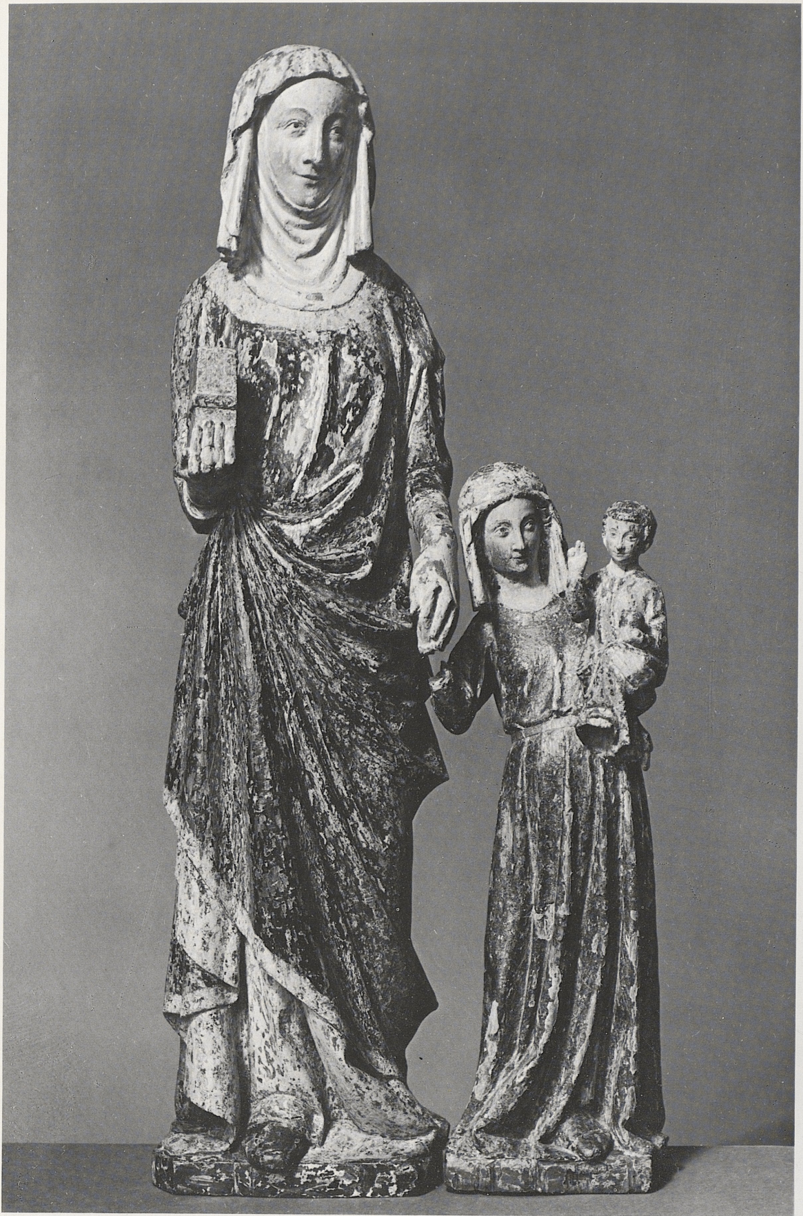
167 Anna Selbdritt, maasländisch, 2. Viertel des 14. Jahrhunderts, Kat. Nr. 136