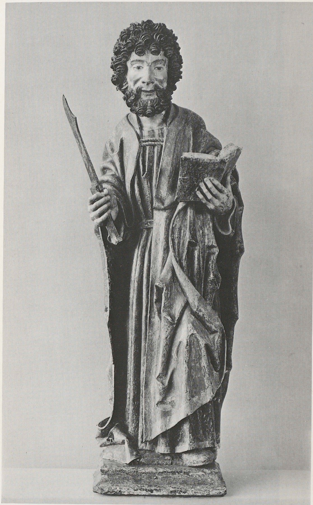
187 Hl. Bartholomäus, Niederrhein, um 1490, Kat. Nr. 160