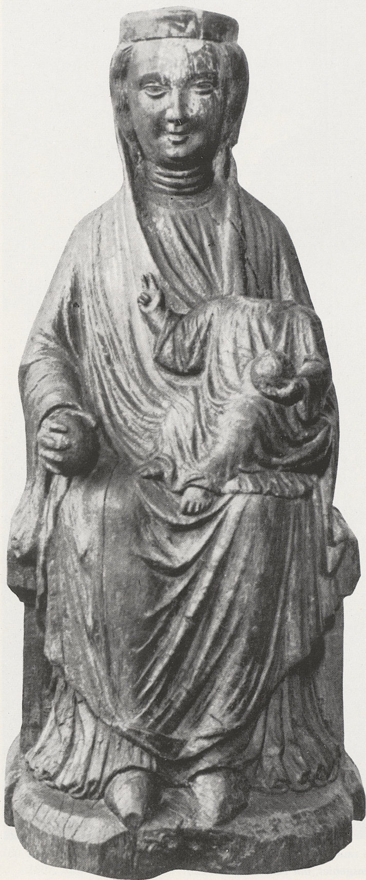
162 Thronende Muttergottes, Rhein-Maasgebiet, um 1220, Kat. Nr. 130