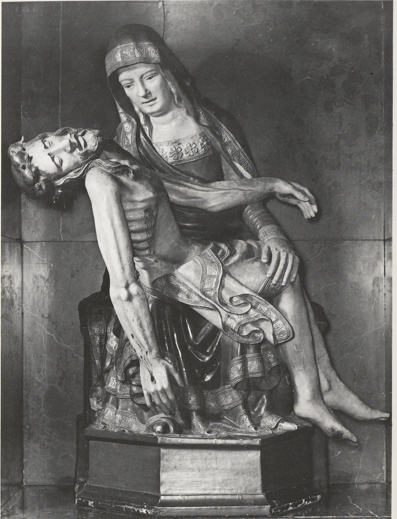
173 Marienklage, Mittelrhein, spätes 14. Jahrhundert, Kat. Nr. 143