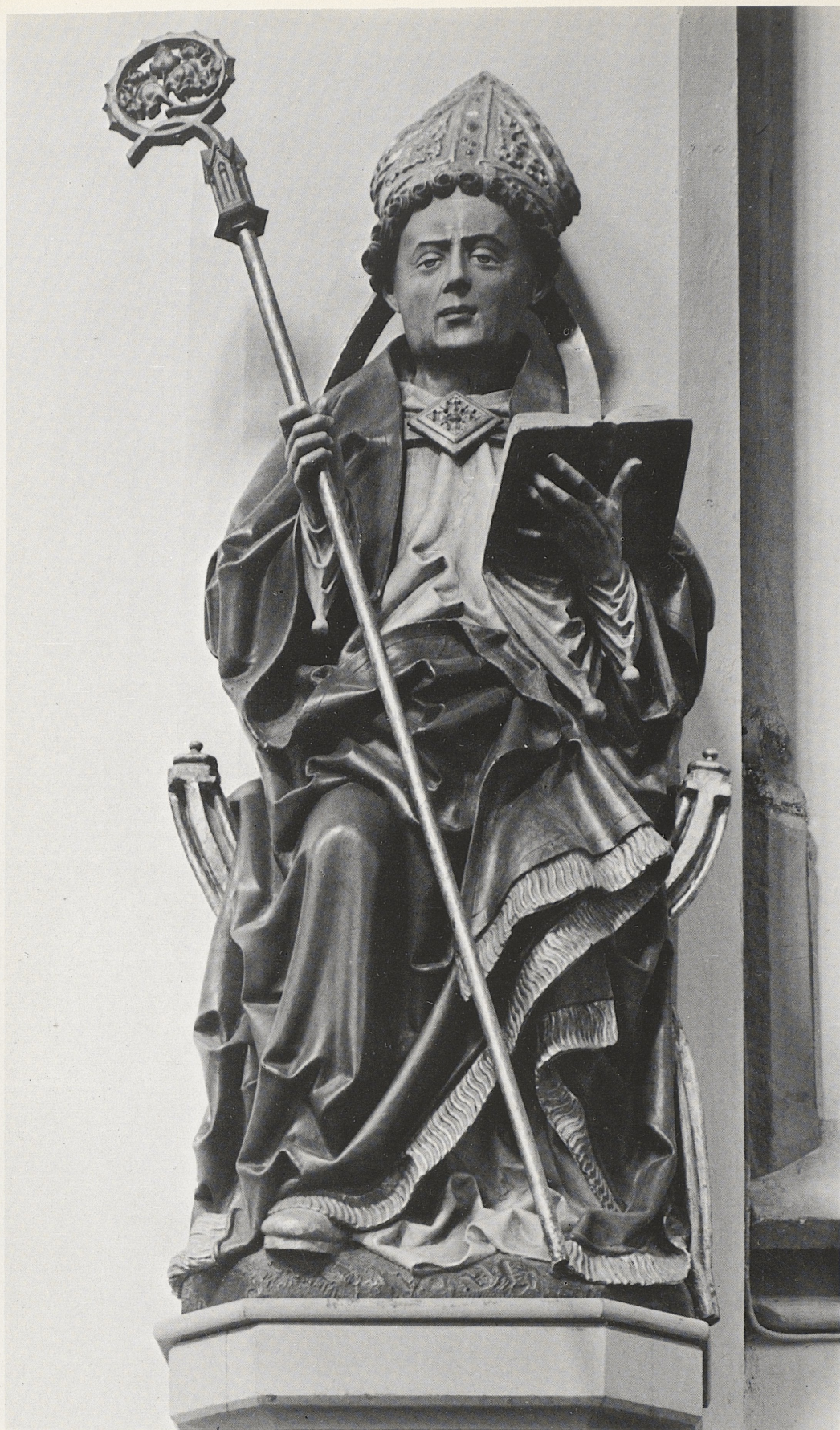
193 Hl. Lambertus, Niederrhein, um 1500, Kat. Nr. 166