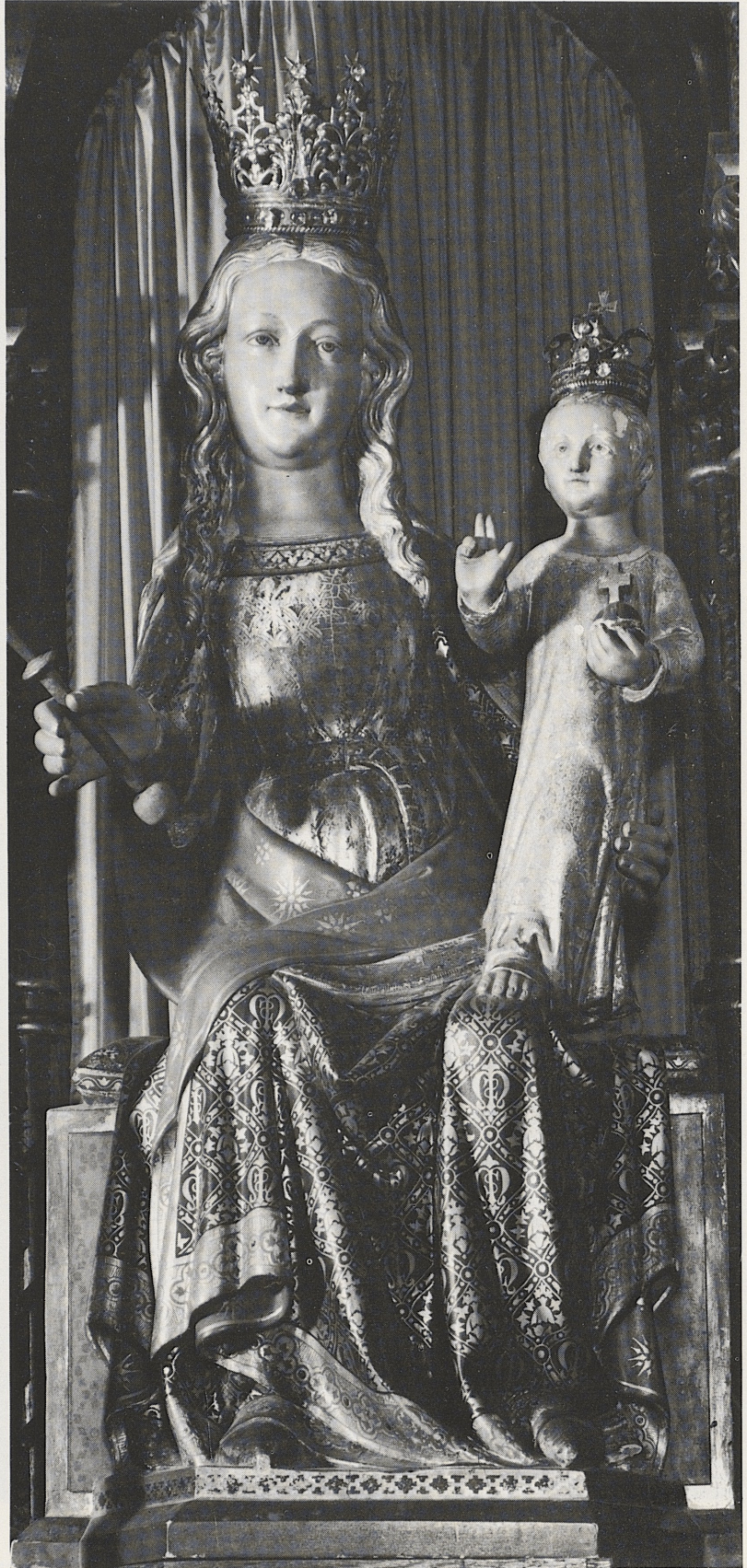
164 Thronende Muttergottes, Niederrhein, 1. Hälfte des 14. Jahrhunderts, Kat. Nr. 133