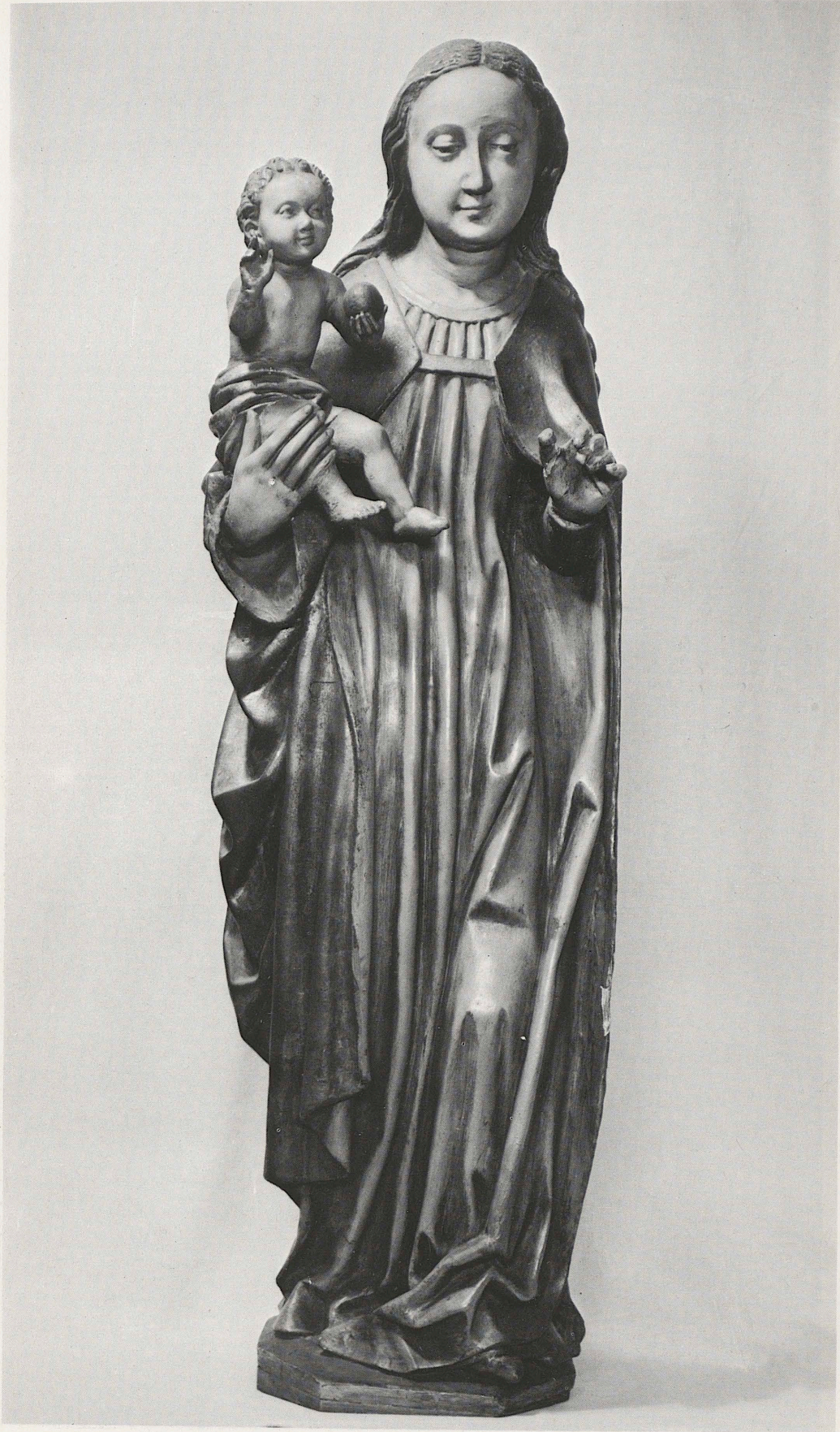
191 Muttergottes, 2. Hälfte des 15. Jahrhunderts, Kat. Nr. 164