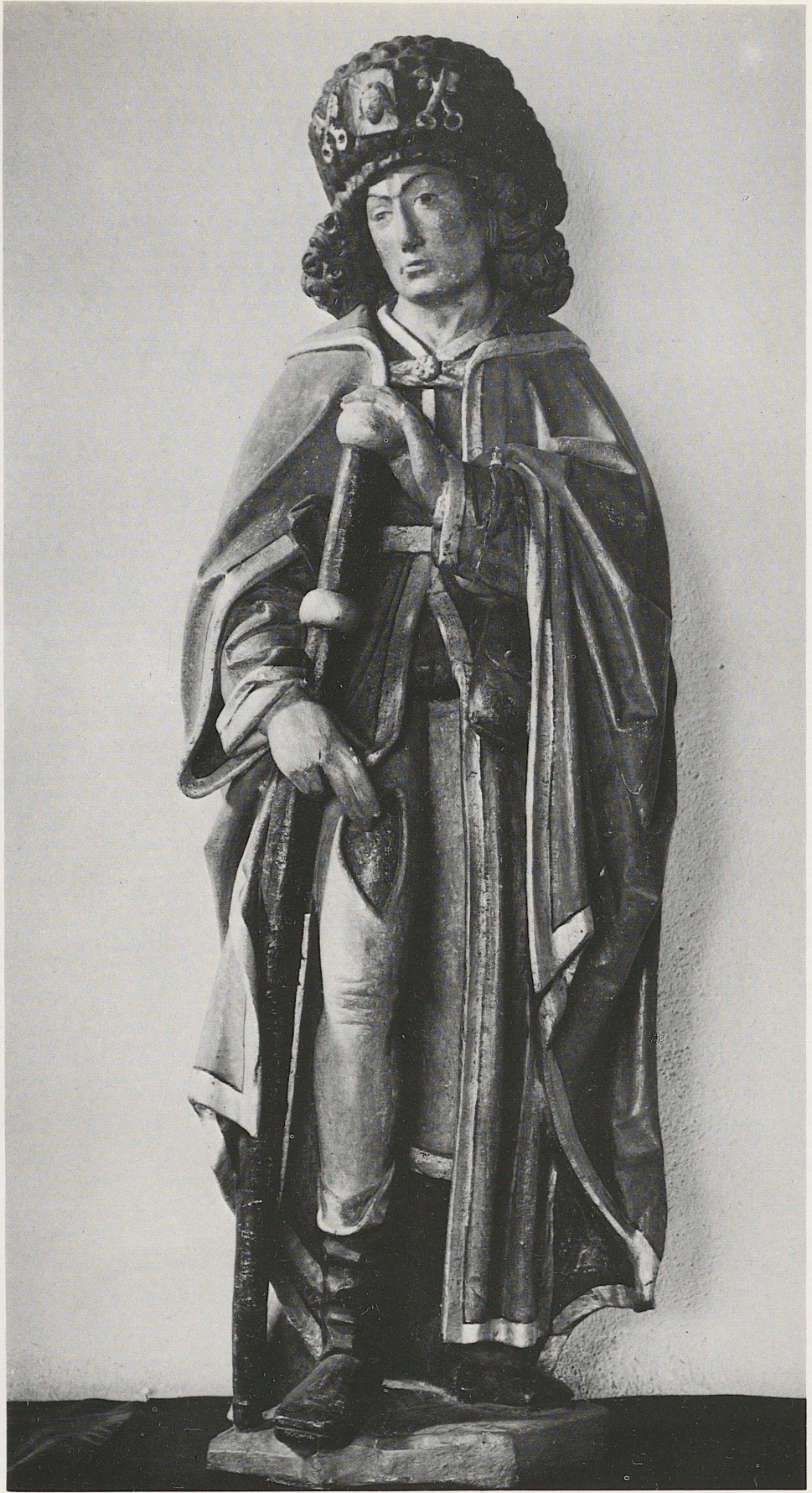
186 Hl. Rochus, Niederrhein, spätes 15. Jahrhundert, Kat. Nr. 159