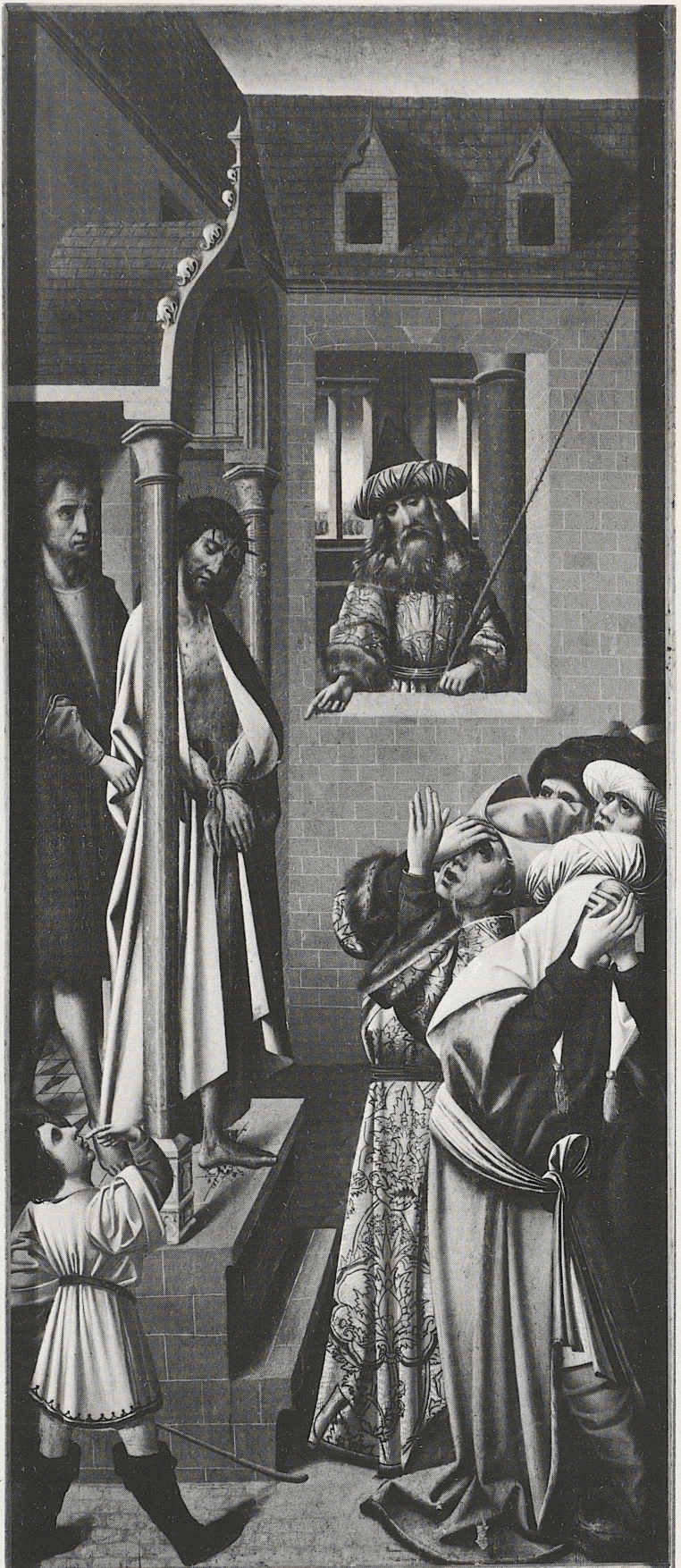
155 Christus vor Pilatus, sog. Meister von Orsoy, Brüssel, um 1500, Kat. Nr. 123