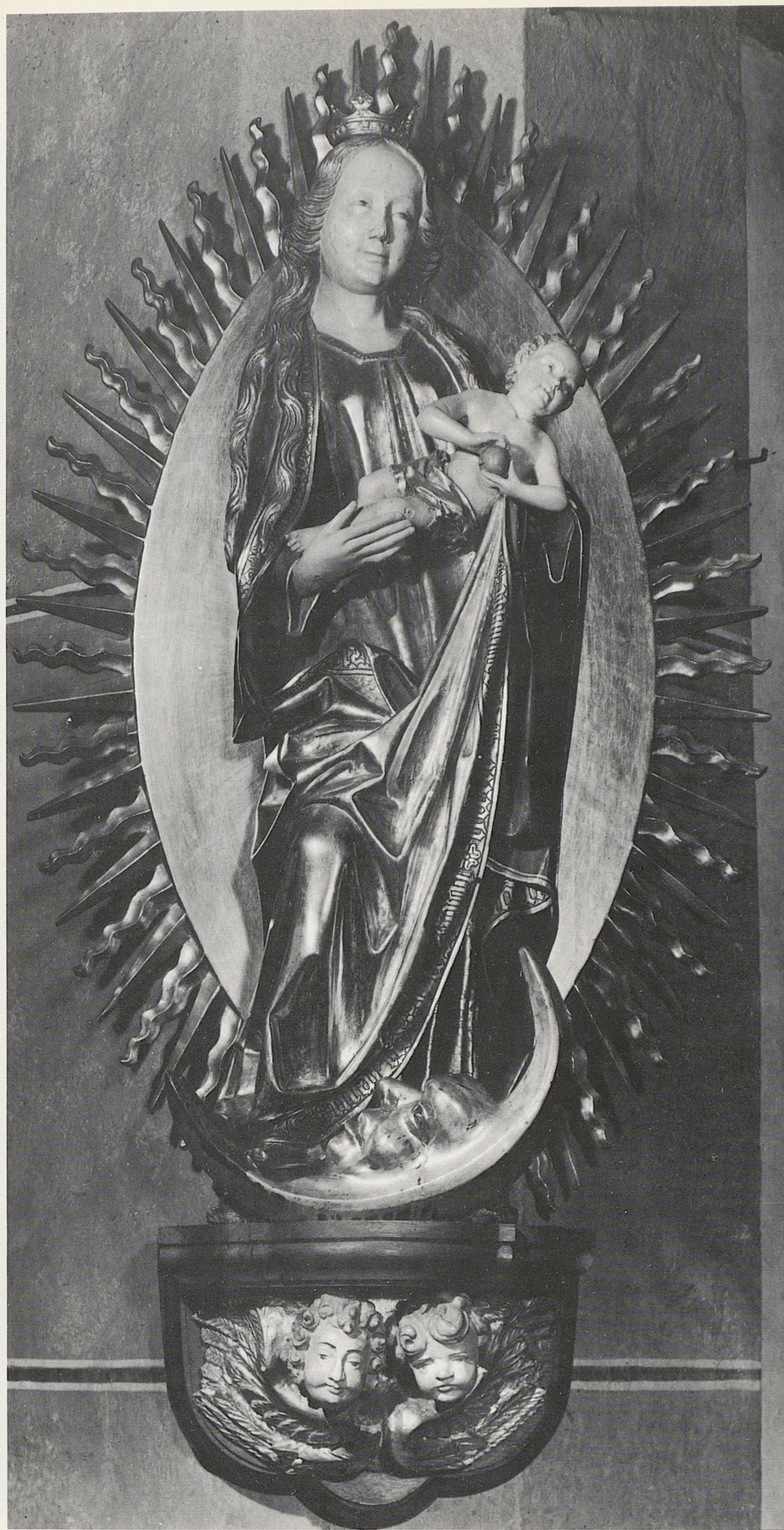
189 Muttergottes auf der Mondsichel, Köln (?), Ende des 15. Jahrhunderts, Kat. Nr. 162