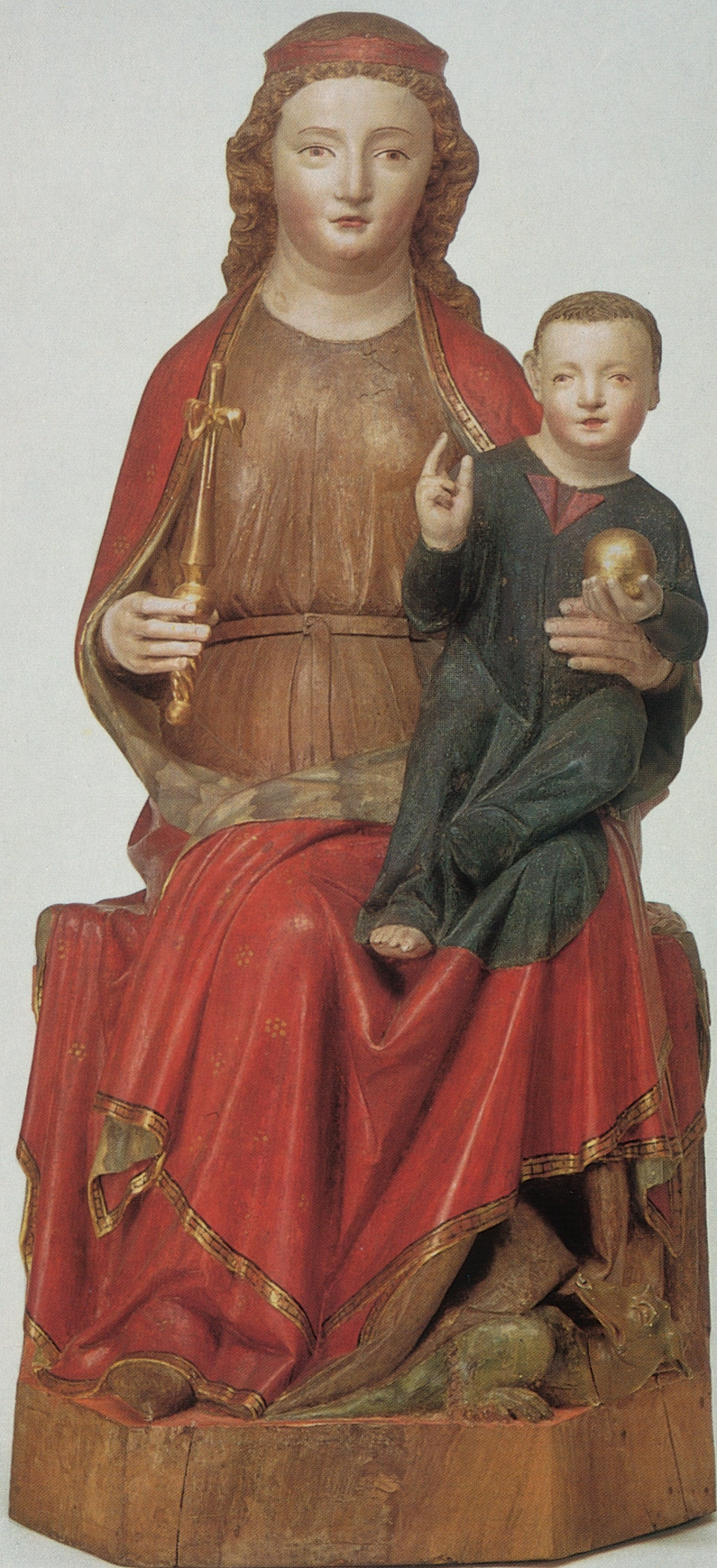
XVIII Thronende Muttergottes, Köln, um 1340/50, Kat. Nr. 138