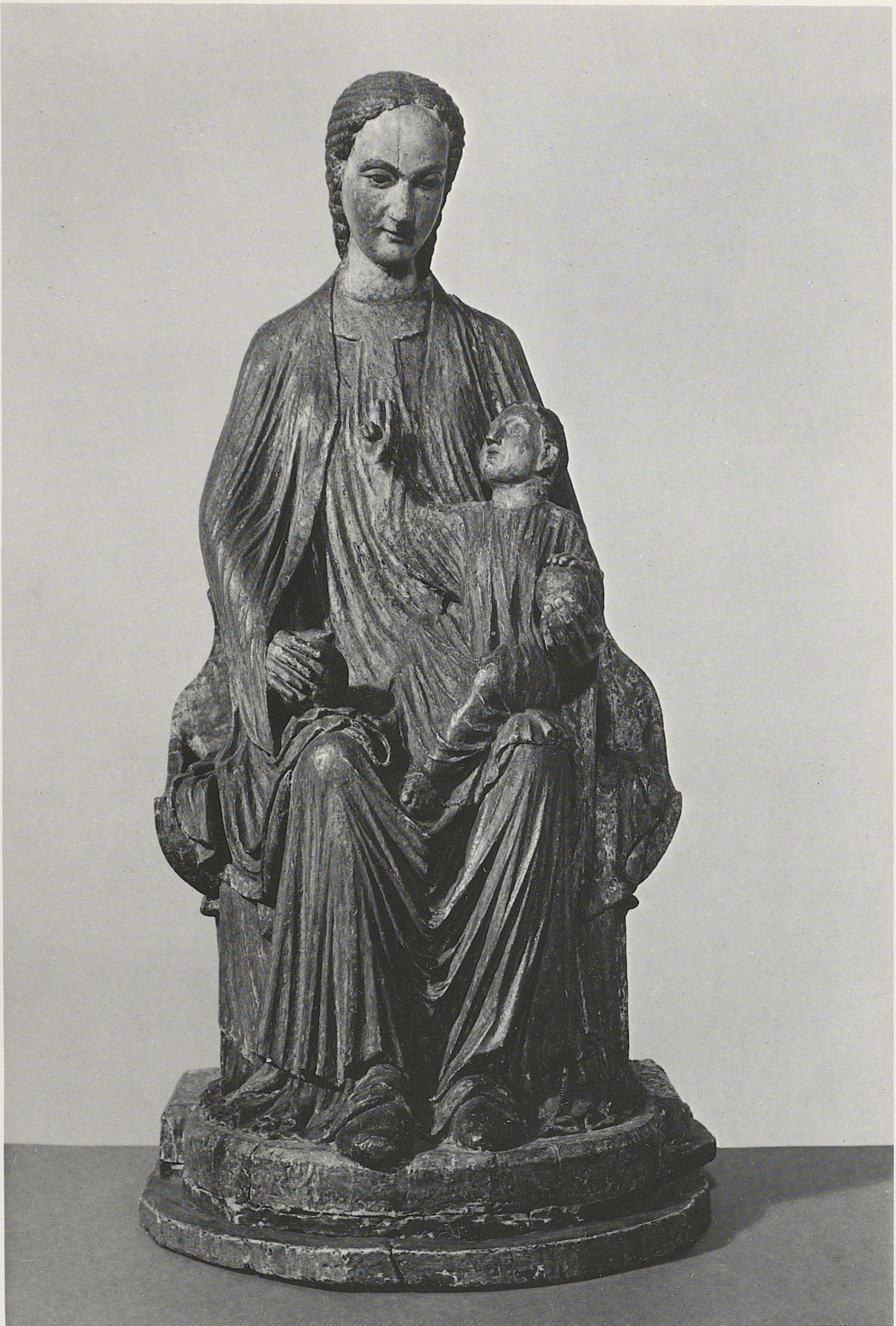
161 Thronende Muttergottes, Rhein-Maasgebiet, um 1220, Kat. Nr. 129