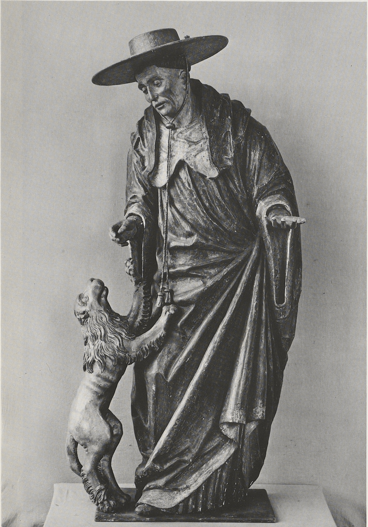
179 Hl. Hieronymus, Niederrhein, um 1450/60, Kat. Nr. 151