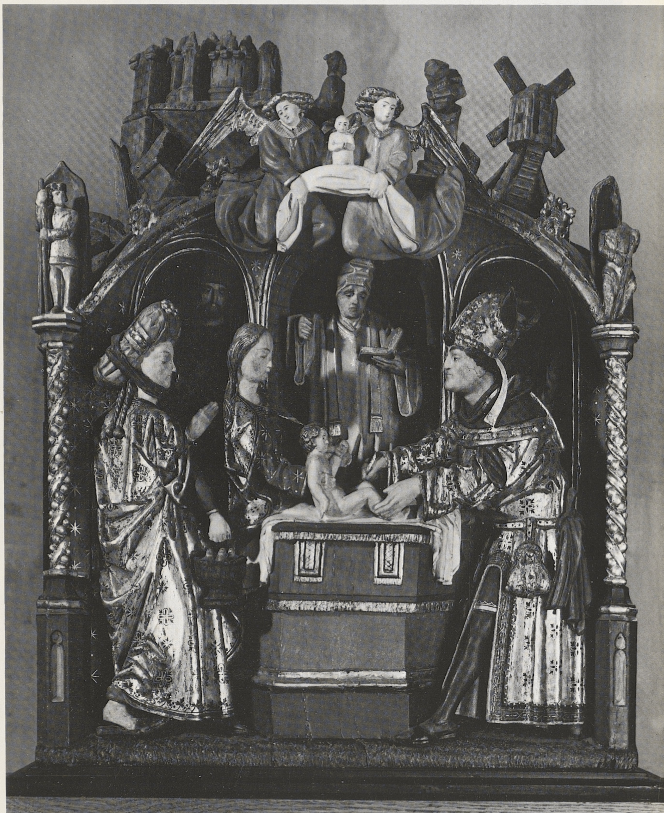
188 Beschneidung Christi, Antwerpen, Ende des 15. Jahrhunderts, Kat. Nr. 161