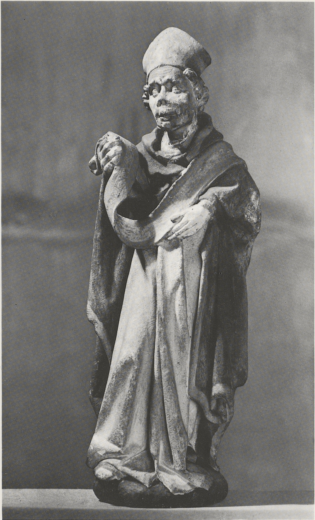
181 Hl. Bischof von einem Sakramentshaus, Konrad Kuyn, Köln, um 1461, Kat. Nr. 153