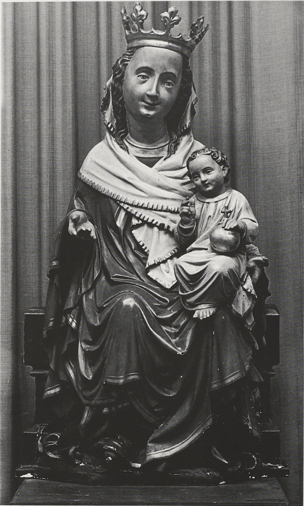
177 Thronende Muttergottes, Köln, um 1420, Kat. Nr. 148