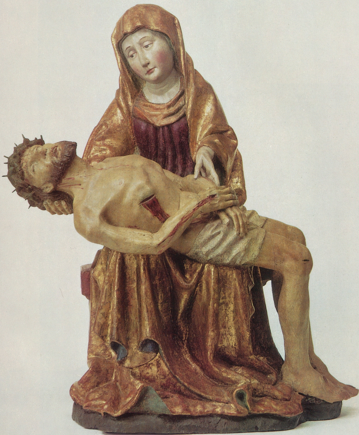
XXI Marienklage, Köln, um 1470, Kat. Nr. 155