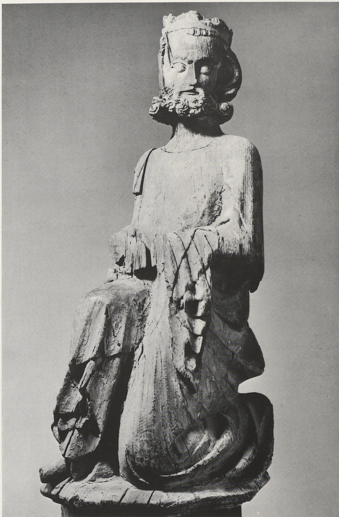
163 Karl der Große, (?), Köln, frühes 14. Jahrhundert, Kat. Nr. 132