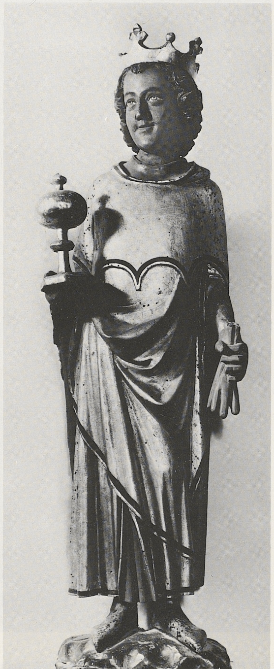
170 (s. T. 169 a und b)