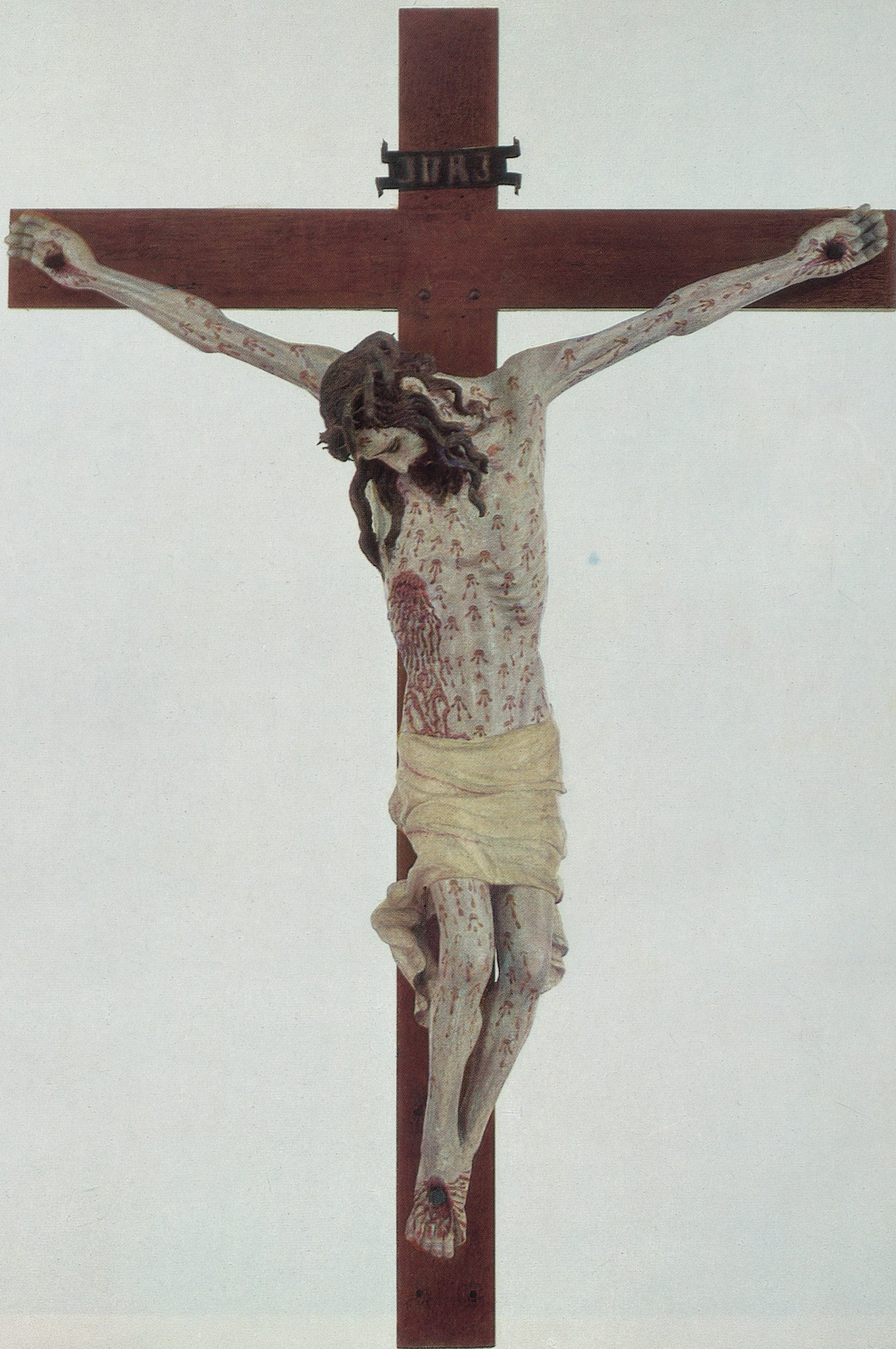
XX Kruzifixus, Köln, Anfang des 15. Jahrhunderts, Kat. Nr. 150