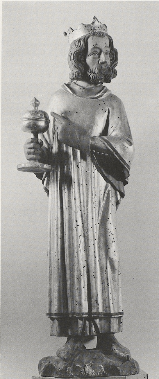
169 a und b Statuetten der hl. Drei Könige, Köln, Mitte des 14. Jahrhunderts, Kat. Nr. 141