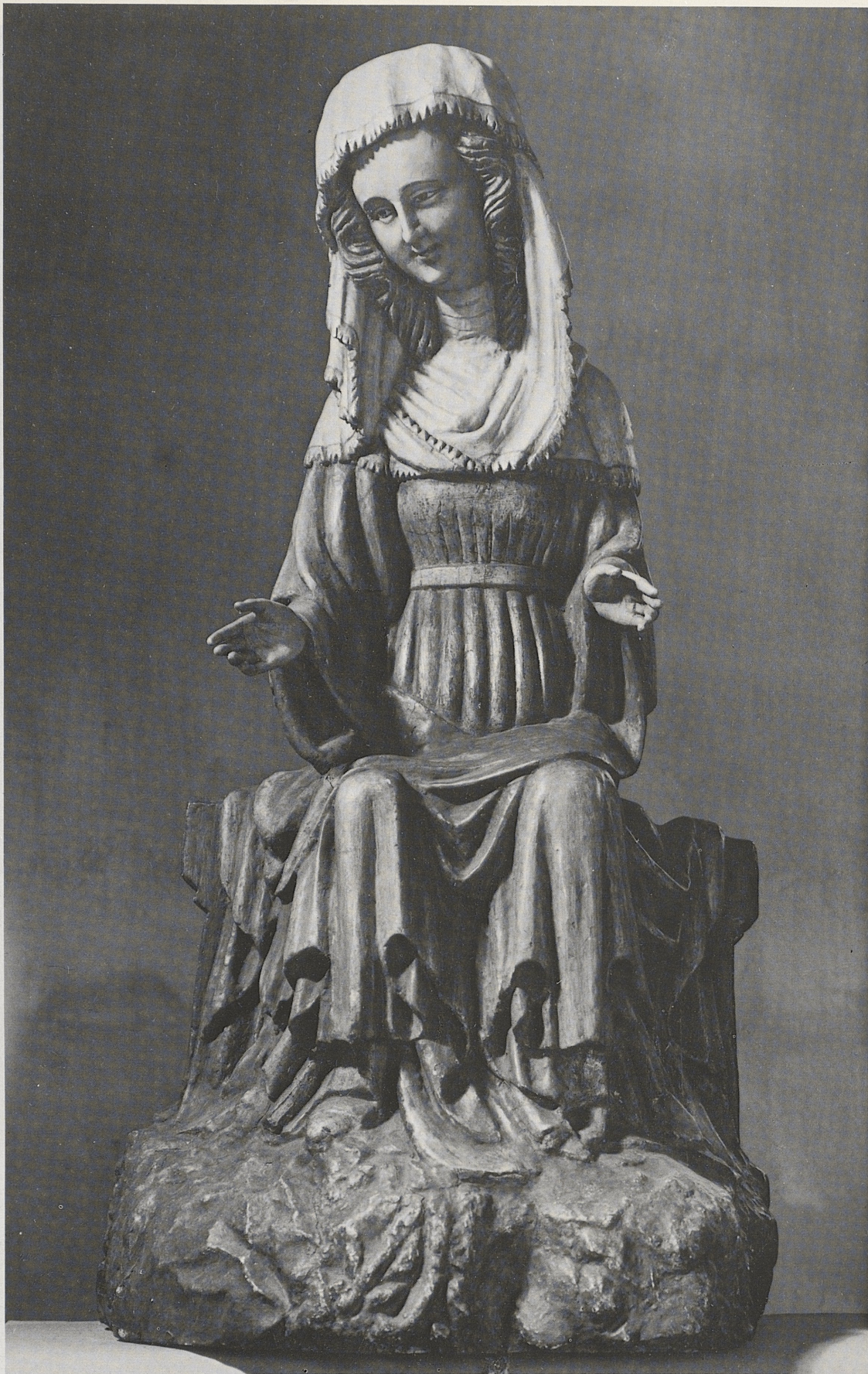
174 Marienklage, rheinisch, letztes Drittel des 14. Jahrhunderts, Kat. Nr. 144