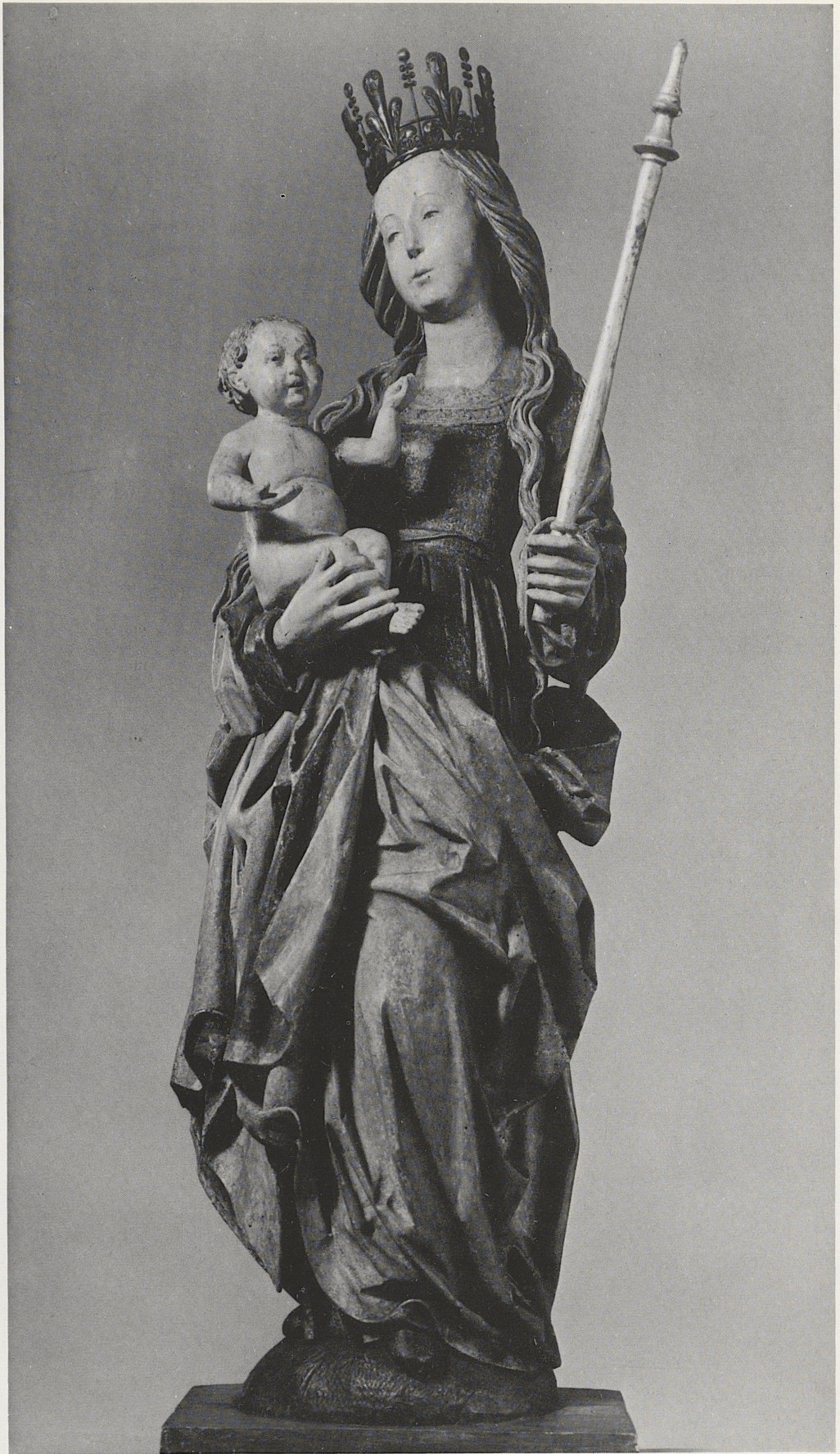
190 Maria mit Kind, rheinisch, Ende des 15. Jahrhunderts, Kat. Nr. 163