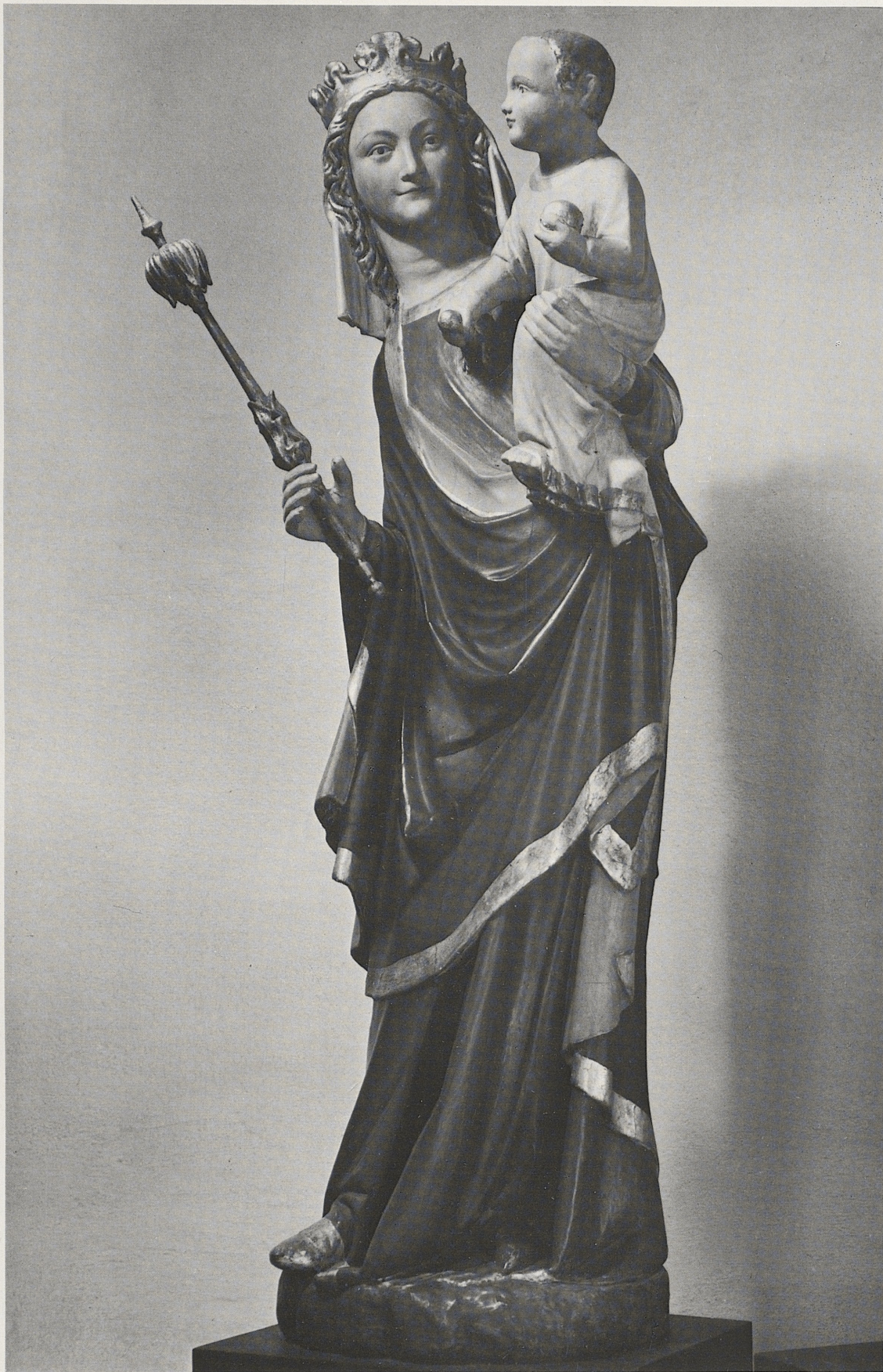
168 Maria mit Kind, Köln, um 1330, Kat. Nr. 137