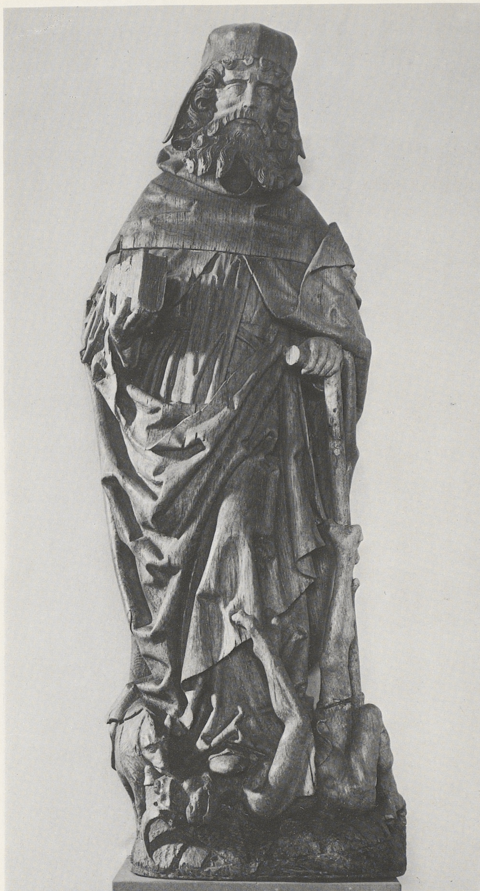
185 Hl. Antonius, Niederrhein, um 1480, Kat. Nr. 158