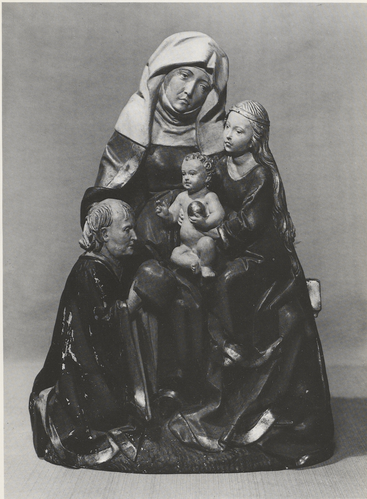
192 Anna Selbdritt mit Stifter, Niederrhein, Ende des 15. Jahrhunderts, Kat. Nr. 165