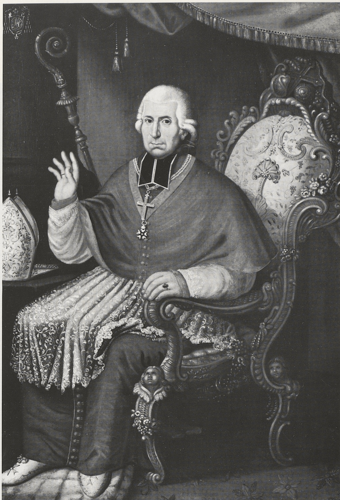
160 Markus Antonius Berdolet, Bischof des 1. Aachener Bistums von 1802 bis 1809, J. P. Scheuren, 1807, Kat. Nr. 127