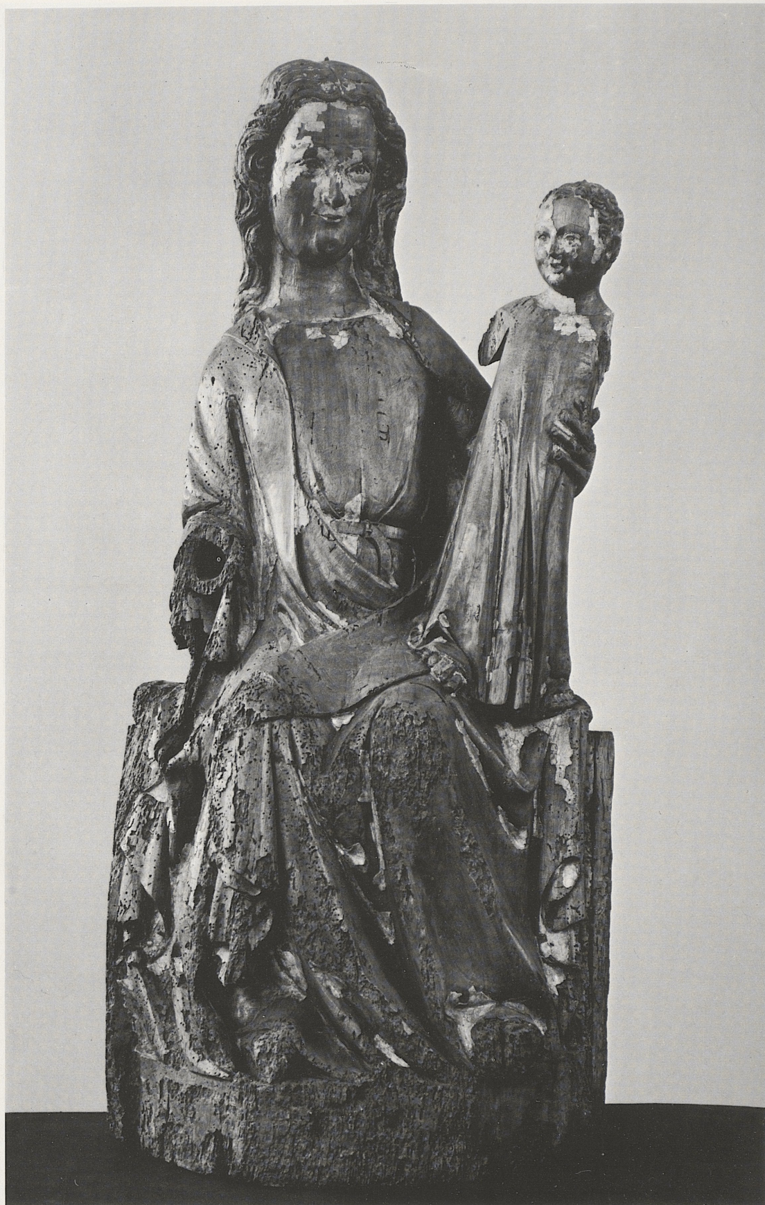
165 Thronende Muttergottes, Köln, um 1330/40, Kat. Nr. 134