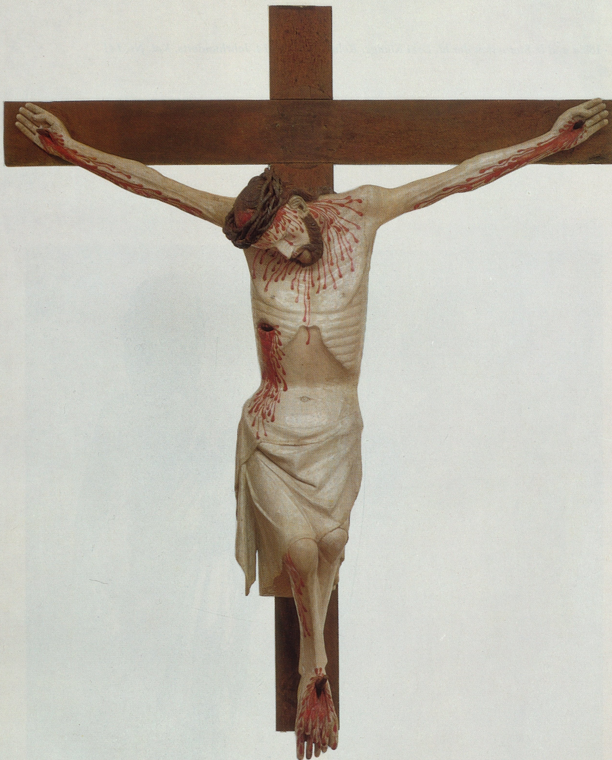
XIX Kruzifixus, rheinisch, Mitte des 14. Jahrhunderts, Kat. Nr. 139