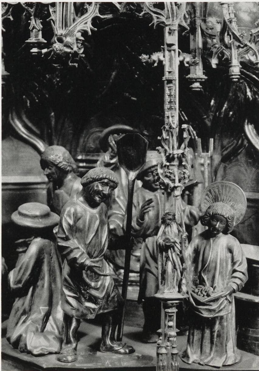
Fig. 3 Buste-reliquaire de saint Lambert. Détail de la première niche du socle. Grandeur réelle

du reliquaire des saintes Ursule et Apolline. Les putti contorsionnés tenant des phylactères entortillés qui jouent dans les baldaquins le rôle de pendentifs sont les frères jumeaux de ceux du baiser de paix-reliquaire de saint Timothée. Les statuette d'apôtres et d'évêques (en particulier celle de saint Servais) adossées aux architectures du socle, tout comme le personnage barbu et enturbanné introduit dans la scène de l'expulsion de saint Lambert, rappellent fortement les effigies de saints du pied de croix de Kreuznach. Le même drapé aux longs plis courbes brisés sans excès anime la chasuble de saint Lambert et le manteau de saint Pierre. Le même décor de canaux, d'une