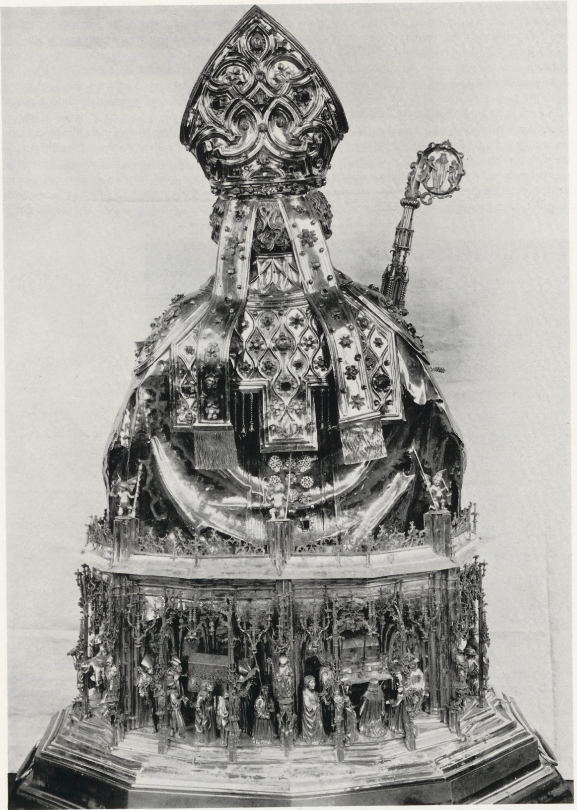
Fig. 2 Buste-reliquaire de saint Lambert. Vue d'ensemble, de dos