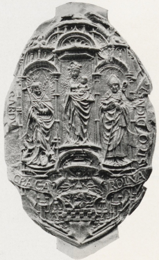
Fig. 7 Empreinte du deuxième sceau secret d'évêque d'Erard de La Marck, 1521, attribué à Hans von Reutlingen. Grandeur réelle.

A coup sûr, tout n'y est pas de la propre main du maître de l'ouvrage. Peut-être un démontage total — entreprise que seul un traitement de conservation scientifiquement conduit rendrait réalisable — révélerait-il des poinçons, et permettrait-il de ren-