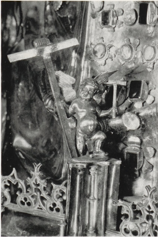
Fig. 5 Buste-reliquaire de saint Lambert. Détail: un des six angelots tenant les instruments de la Passion. Grandeur réelle