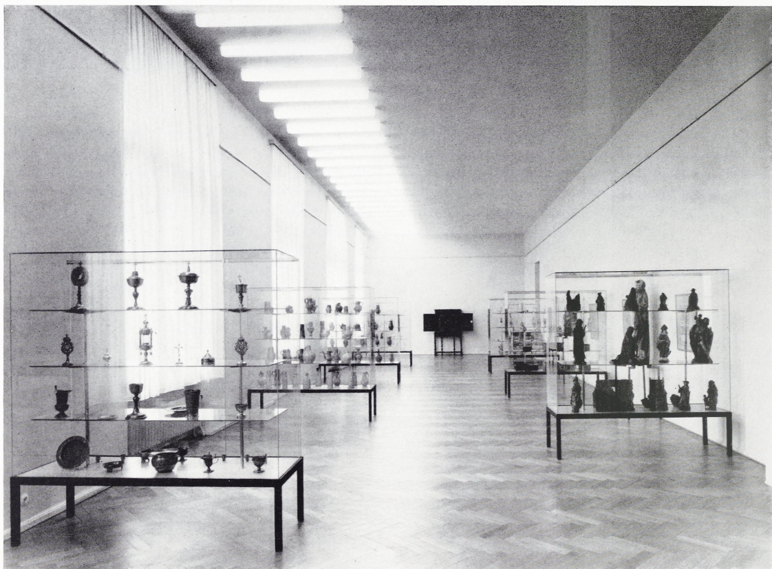
Abbildung 104 Blick in den Straßensaal des II. Stockwerkes mit der neu aufgestellten Kunstgewerbesammlung

Werke der Skulpturensammlung sowie des Kunstgewerbes beschrieben und kunstgeschichtlich eingeordnet werden. Für manche Objekte wird, wie schon angedeutet, der Standort wieder wechseln. Aber auch nach der später notwendigen Umordnung lassen sich die beschriebenen Kunstwerke uns schwer auffinden; dieser erste vorläufige Führer behält also auch nach der Neugestaltung des Museumsgebäudes seine Gültigkeit. Wenden wir unser Augenmerk zunächst den ausgestellten und in den letzten Jahren restaurierten Skulpturen zu. Da die Kunstwerke in einem Rundgang aufgesucht werden, findet die Chronologie der Entstehungszeit keine Berücksichtigung. Vom Treppenhaus kommend, wenden wir uns nach links in den Gang, der zum Straßensaal führt. Hier begegnet uns die nahe-