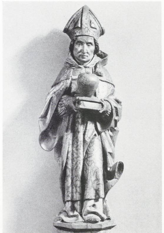
Abbildung 107: Hl. Augustinus

Der Heilige schreitet nach links hin durch das Wasser und trägt auf seiner rechten Schulter das segnende Christkind mit der Weltkugel. Die Bemalung ist alt, jedoch nicht ursprünglich. Die 52 cm hohe und aus Eichenholz geschnitzte Gruppe entstand um 1520 in Westfalen, die Zuschreibung an den Osnabrücker Meister ist falsch.