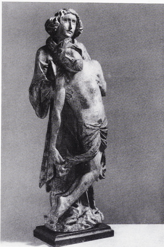
Abbildung 109: Angelus Missae

Der hl. Papst und Märtyrer trägt auf der Rechten eine große Traube, die ihn als Schutzpatron der Winzer kennzeichnet. Die erhobene linke Hand