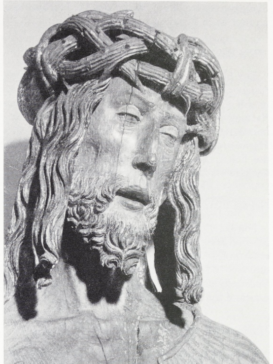
Abbildung 111: Schmerzensmann

Die lebensgroße und sehr ausdrucksstarke Eichenholzskulptur zeigt noch Reste ursprünglicher Bemalung. Die Figur stammt aus der Aachener Pfarrkirche St. Paul und dürfte als Arbeit eines Aachener Bildschnitzers aus der 1. Hälfte des 16. Jahrhunderts anzusehen sein.