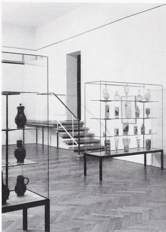
Abbildung 105: Teilansicht des Straßensaales

Der Apostel wendet den Kopf nach rechts, hält in der Linken den Schlüssel und drückt mit der rechten Hand, indem er zugleich einen Teil seines Mantels rafft, ein Buch an sich. Der Kopf ist charak-