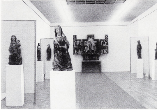
Abbildung 106: Blick in den Skulpturensaal

Die Bemalung der rückseitig ausgehöhlten Eichenholzgruppe ist nicht ursprünglich, sondern stammt aus dem Ende des 18. oder Anfang des 19. Jahrhunderts. Die Hände des Kindes sowie die Hand der Mutter Anna mit der Traube sind ergänzt. Die 72 cm hohe Skulptur ist zu Anfang des 16. Jahrhunderts am Niederrhein in der Gegend von Xanten entstanden.