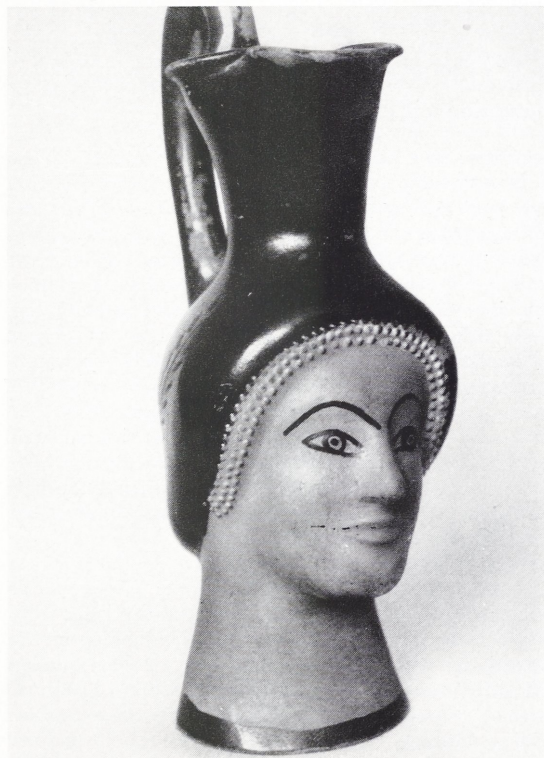
Abbildung 117: Kleines griechisches Gefäß

Die Tischvitrine an der Stirnseite des Saals gibt einen kurzen Überblick über die Entwicklung des Kruzifixus bzw. des Corpus Christi von der Romantik bis in nachmittelalterliche Zeit. Die dritte Vitrine am anderen Saalende bringt aus der Springsfeld'schen Waffensammlung drei erlesene Beispiele von Steinschloßgewehren mit reicher Elfenbeinintarsia.