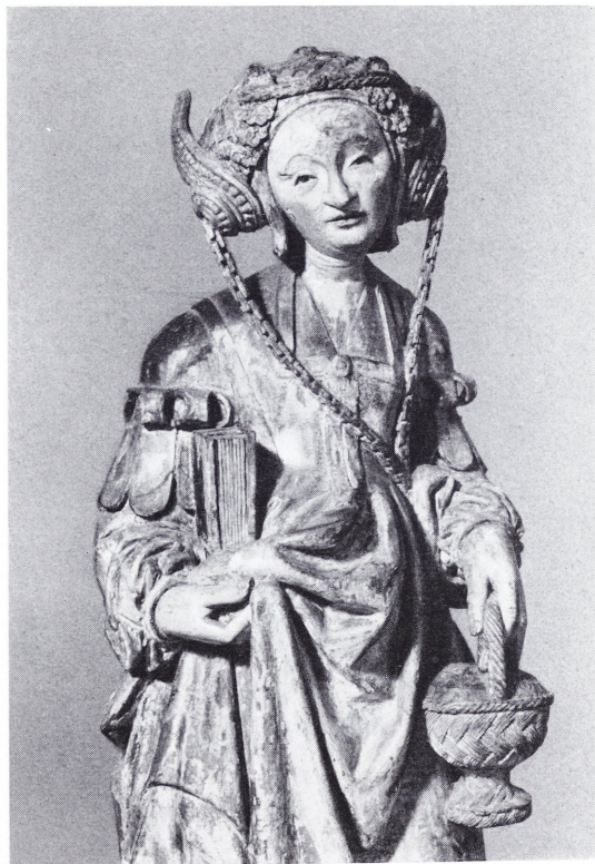
Abbildung 110: Hl. Dorothea

Die alte Bemalung und Vergoldung der 87 cm hohen Eichenholzfigur sind noch zu großen Teilen erhalten. Die Skulptur, die aus der berühmten Sammlung Oertel in München 1913 erworben