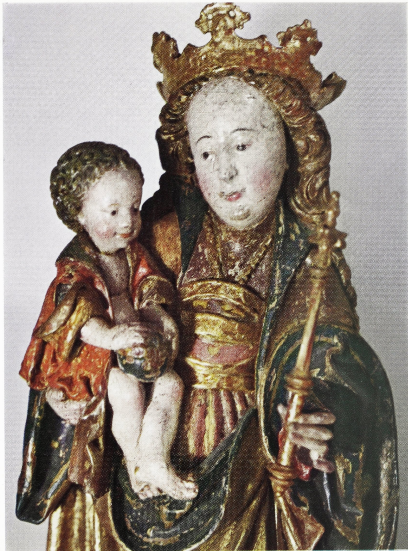
Abbildung 108: Sog. Meister von Osnabrück, Madonna mit dem Kind

Die Gottesmutter steht auf der Mondsichel. Auf ihrem rechten Arm trägt sie das Kind, das in ein nach vorn offenspringendes Röckchen gekleidet ist. In der Linken hält Maria das Szepter; das Kind trägt in seinen Händen die Weltkugel. Die Muttergottes ist in ein enganschließendes, unter der Brust gegürtetes Kleid mit rechteckigem Miederausschnitt