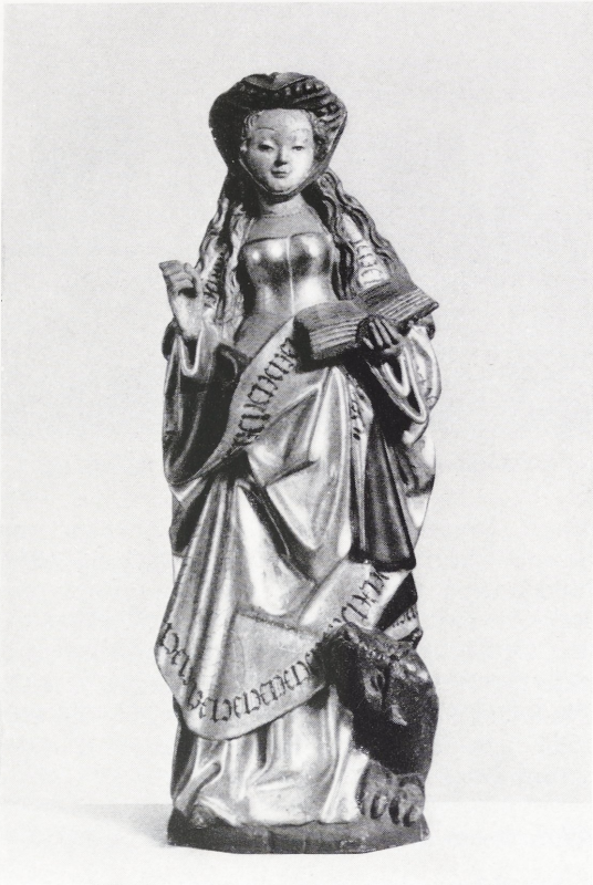
Abbildung 114: Hl. Margareta

unter dem Kinn gebundenes rot und grün gestreiftes Tuch. Der Mantel ist vergoldet und zeigt einen Saum mit gotischen Minuskeln.