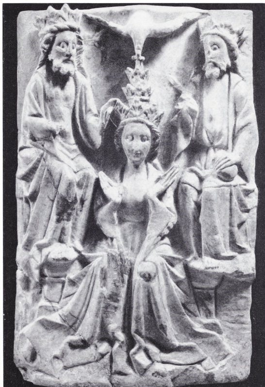
Abbildung 115: Alabasterrelief mit der Krönung Mariens

Die Darstellung folgt dem ikonographischen Schema. Maria sitzt im Vordergrund auf einer Thronbank, die Hände breitet sie wie eine Orantin zum Gebet. Gottvater und Christus thronen erhöht rechts und links von Maria und setzen ihr im Verein mit der in der Mitte des oberen Bildrandes niederschwebenden Taube des hl. Geistes die dreifache Krone aufs Haupt. – Die Sammlungen der