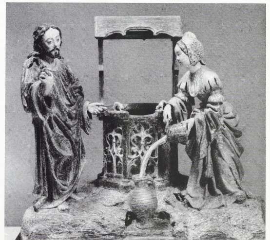
Abbildung 113: Christus und die Samariterin am Brunnen

Margareta (Abb. 114) wird mit dem Drachen zu ihren Füßen dargestellt. Sie trägt einen mit Perlen schnüren gezierten turbanartigen Kopfputz und ein