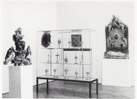
Abbildung 116: Ausschnitt aus dem Barocksaal