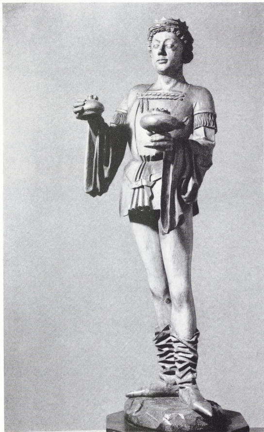
Abbildung 112: König Balthasar

Maria trägt auf dem linken Arm das Kind, das in den Händen einen Vogel hält. In der Rechten