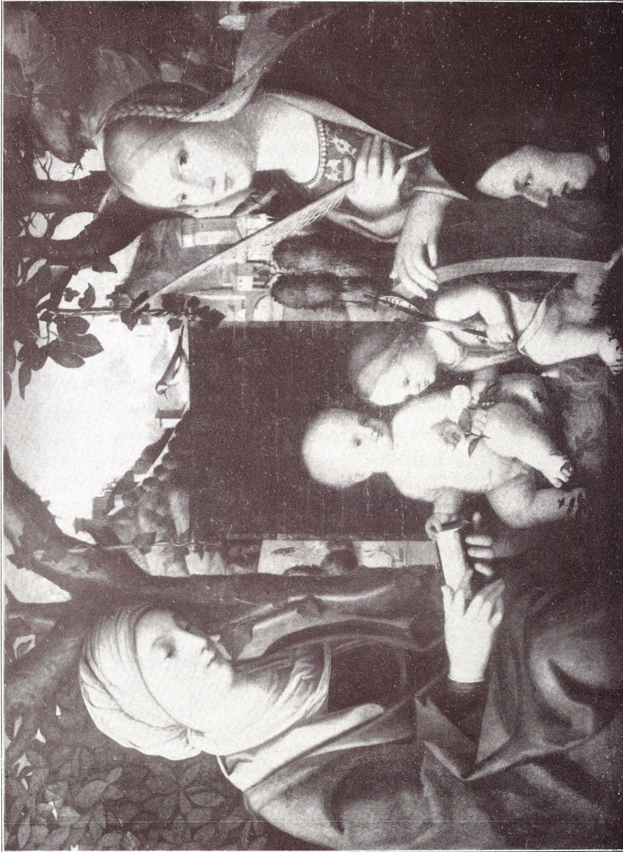
(Fig. 1.) Sante Conversazione von Francesco da Santa Croce.