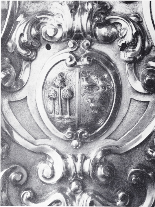
Abb. 4 Wappen des Abtes Dubois auf einem Paar der Augsburger Standleuchter