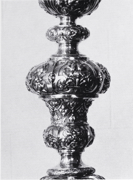
Abb. 2 Vasenmodus der Augsburger Standleuchter