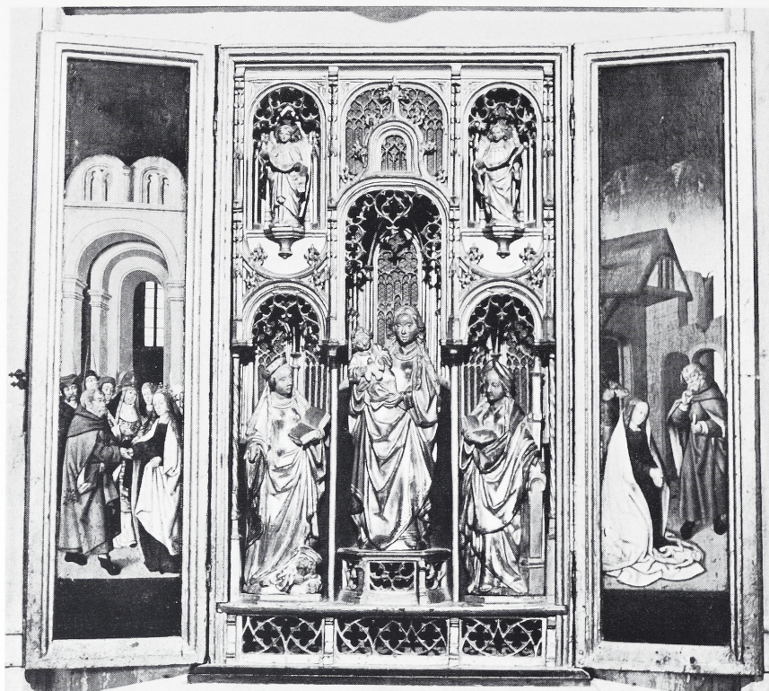
Afb. 6 Saint-Galmier (Loire), Parochiekerk. Mechels retabel met beelden.