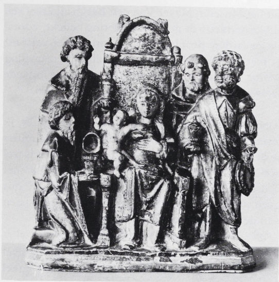
Afb. 11 London, Victoria & Albert Museum. Mechels retabelfragment: Aanbedding van de Wijzen.

Een andere opmerking heeft betrekking op het Kindje. In al de taferelen met de Aanbedding van de Wijzen uit de Mechelse retabelproductie, is het Kindje naakt uitgebeeld en in een eerder speelse houding. In al deze gevallen houdt de H. Maagd het niet al te mooi wichtje aan haar rechterzijde vast. In de Aanbedding van de Herders van het retabel van Ödeby (afb. 4) en op het gelijknamige fragment uit het Museum Curtius te Luik (afb. 12) dat tweemaal