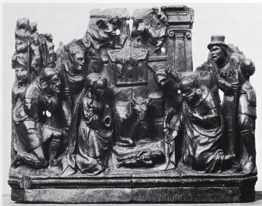
Afb. 12 Luik, Museum Curtius. Mechels retabelfragment: Aanbedding van de Herders.

Een andere opmerking heeft betrekking op het Kindje. In al de taferelen met de Aanbedding van de Wijzen uit de Mechelse retabelproductie, is het Kindje naakt uitgebeeld en in een eerder speelse houding. In al deze gevallen houdt de H. Maagd het niet al te mooi wichtje aan haar rechterzijde vast. In de Aanbedding van de Herders van het retabel van Ödeby (afb. 4) en op het gelijknamige fragment uit het Museum Curtius te Luik (afb. 12) dat tweemaal