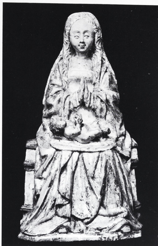
Afb. 13 Luxemburg, Musée d'Histoire et d'Art. Mechels retabelfragment: H. Maagd en het Kind.

met het Mechelse schild is gemerkt en ca. 1540 wordt gedateerd 35 , ligt het Kindje zoals in meerdere Geboorte -voorstellingen op de grond neer.