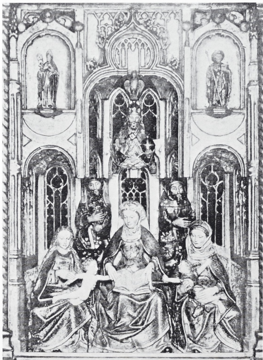
Afb. 7 Parijs, Voorm. verz. Manzi. Retabel met beeldengroef.

bovenste middennisje. In al de zijnisjes is of was een beeldje geplaatst. Het centrale nisje is meestal met maaswerk afgesloten 19 . In het retabel van Aken prijkt bovendien een beeldje in deze nis.