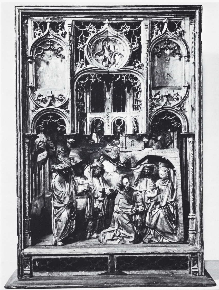
Afb. 1 Aken, Museum Suermondt. Mechels Aanbiddingsretabel

Toen ik er een afbeelding van zag in de Aachener Kunstblätter 3 , werd mijn aandacht niet in de eerste plaats getroffen door de gesneden reliëfs van dit retabel, dan wel door de structurele indeling van het schrijnwerk van de bak. Dit vertoont opvallende analogieën met de metselrie van de Mechelse retabels, zodat ik intuïtief vermoedde dat het retabel van Aken met een Mechelse keurstempel zou zijn