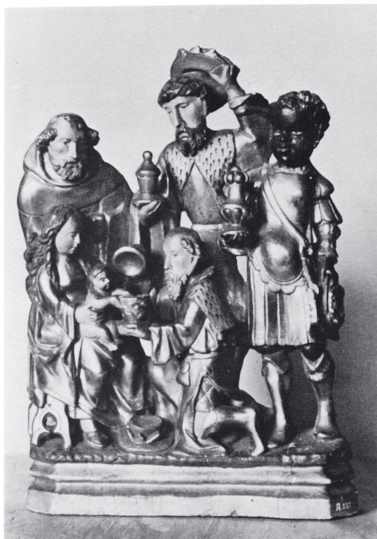
Afb. 9 Keulen, Museum Schnütgen. Mechels retabelfragment: Aanbidding van de Wijzen (Foto: Keulen, Haus Rhein. Heimat, Bildarchiv).

De polychromie van dit retabel heeft zoals gezegd veel geleden. De hoofdkleur is bladgoud dat op de mantelboorden en tegen de wand van de nissen met stippegravure is verfraaid. De sgraffiti zijn uitgewerkt als een eenvoudige parelboord of als een dambord met in het midden van elk vierkant een stippeel. Slechts op de mantelboord van de Heilige Maagd zijn opschriften door afhaaltechniek aangebracht.