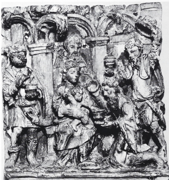
Afb. 10 Hannover, Niedersächsische Landesgalerie. Mechels retabel-fragment: Aanbidding van de Wijzen (Foto: Hannover, Nied. Landesgalerie).

Bij het aandachtig bekijken van de afbeeldingen van enkele met de Mechelse keurstempel gemerkte retabelfragmenten die de Aanbidding van de Wijzen voorstellen, kwam ik tot de volgende vaststelling dat geen enkele van de er op voorgestelde wijze een juweel draagt, maar wel eventueel een kroon bij zich heeft. In het retabeltje uit de verz. Lambert, ligt de kroon van Melchior op de grond vóór het kastje waarop de ciborie is geplaatst (afb. 5). Het is best mogelijk dat de kroon van de twee andere koningen rondom hun hoed is geschoven zoals de drie wijzen het gedaan hebben op het reliëf van Keulen (afb. 9) 32 , Melchior en Kasper op het reliëf van Hannover (afb. 10) 33 en Balthazar op het reliëf van Londen (afb. 11) 34 , terwijl Melchior een soort netje rondom het hoofd heeft aange-trokken zoals Kasper op het reliëf van Keulen.