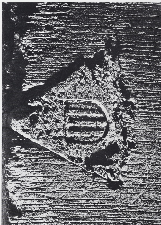
Afb. 2 Aken, Museum Suermondt. Aanbiddingsretabel: Mechelse keurstempel.

Het algemeen architectonische schema is opgevat als een ruimte met drie kapelletjes waarvan de scheidingszuiltjes boven de figurencompositie zijn