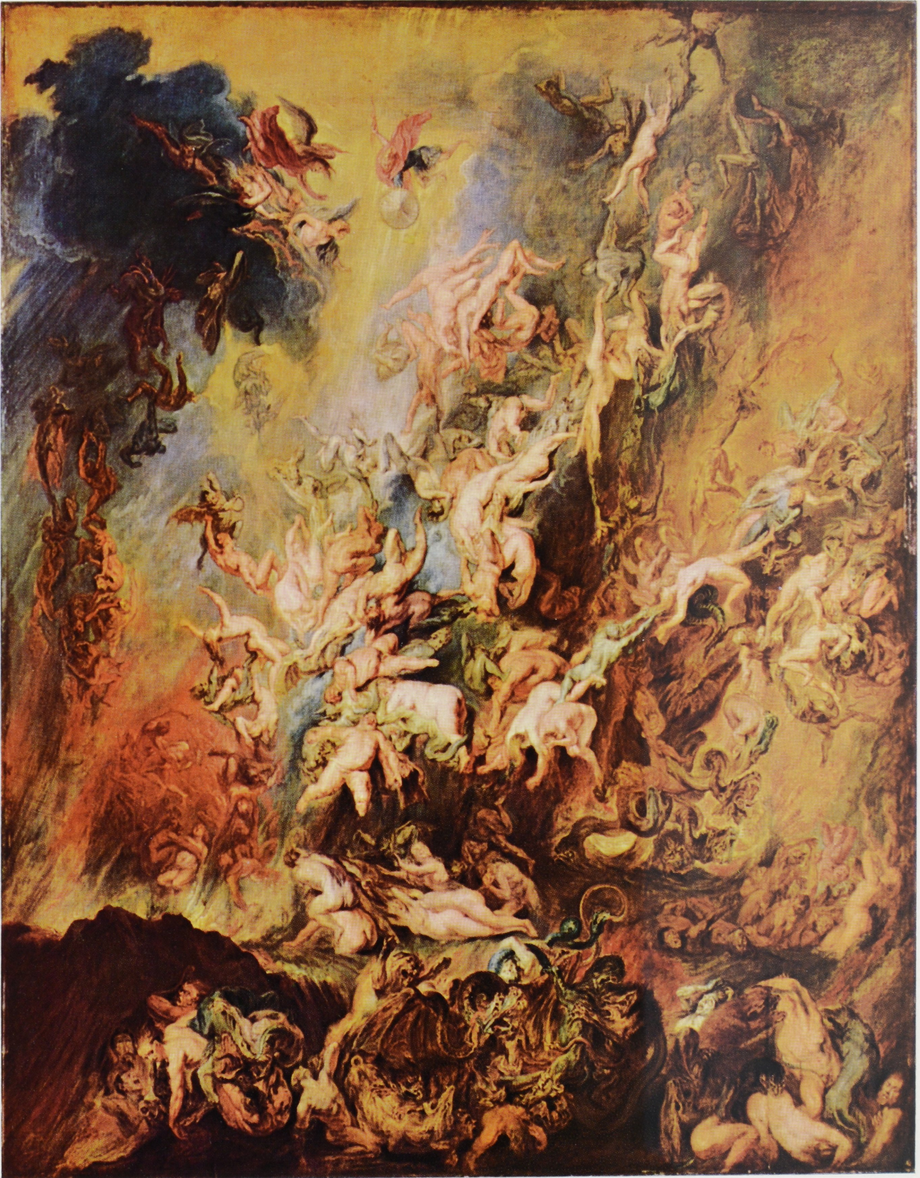
P. P. RUBENS, Der Verdammtensturz