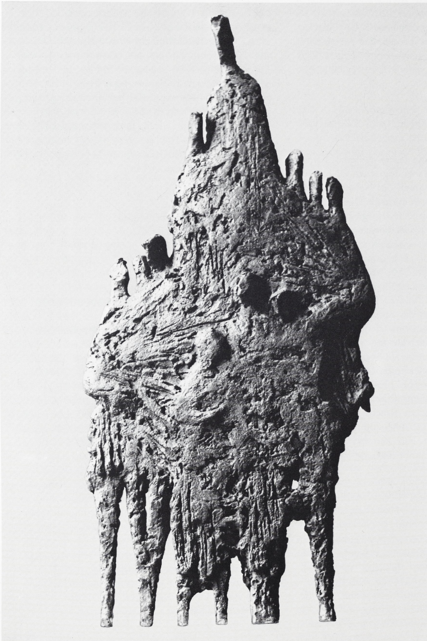
»Menschen leben miteinander«. Modell: Plastikbeton, 0,70 m