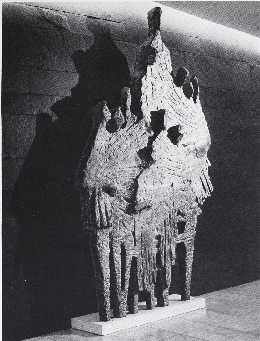
»Menschen leben miteinander«. Auftrag des Landes Nordrhein-Westfalen Standort: Foyer der Bibliothek der Kernforschungsanlage in Jülich

Ausgeführt: 1966 Aufgestellt: 1967 Bronze, Höhe 3,30 m