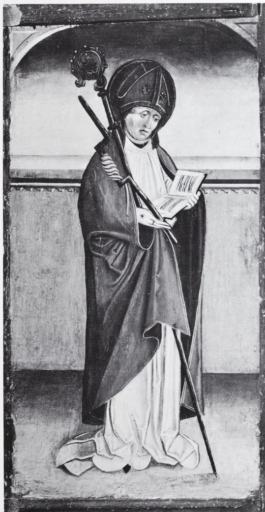
Linker Außenflügel mit bl. Erasmus