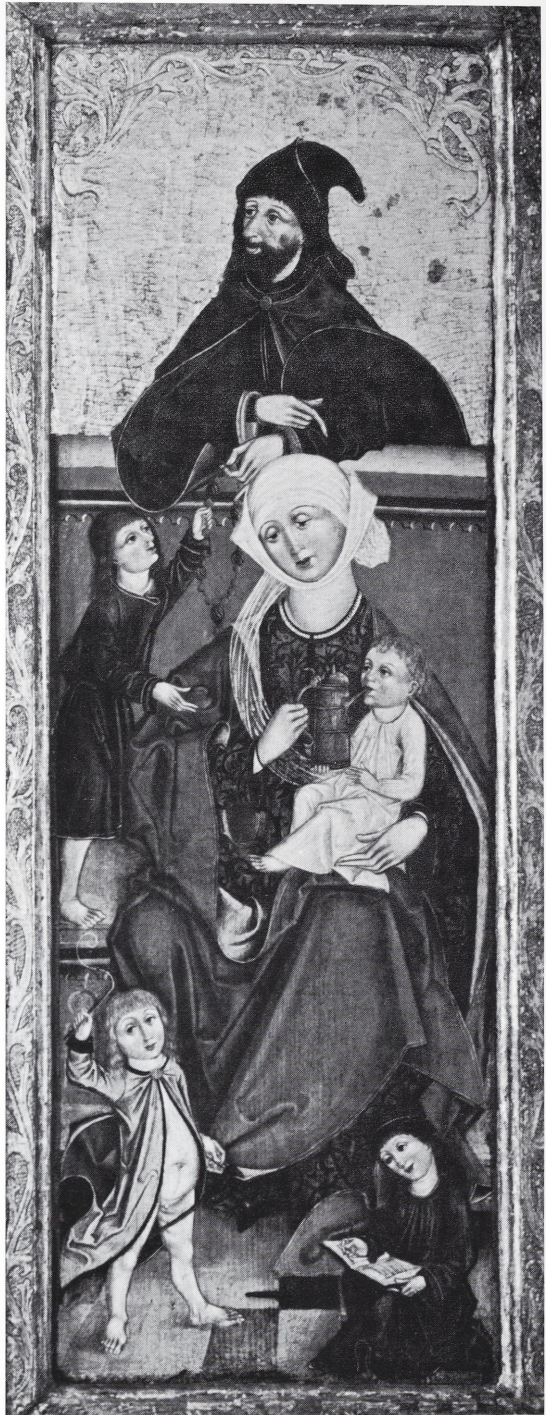
Rechter Innenflügel mit Annagruppe

sie der kleinen Maria aus einer Kanne Milch reicht, darüber – wiederum durch eine Brüstung von der Hauptgruppe getrennt – Joachim mit einem Rosenkranz. Ein Kind hat spielend nach seinen Perlen gegriffen und reicht mit seiner Rechten dem Jesus-