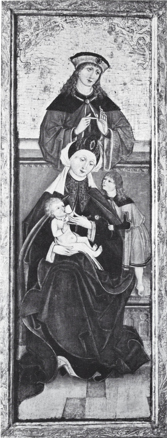
Linker Innenflügel mit Elisabethgruppe

sie der kleinen Maria aus einer Kanne Milch reicht, darüber – wiederum durch eine Brüstung von der Hauptgruppe getrennt – Joachim mit einem Rosenkranz. Ein Kind hat spielend nach seinen Perlen gegriffen und reicht mit seiner Rechten dem Jesus-