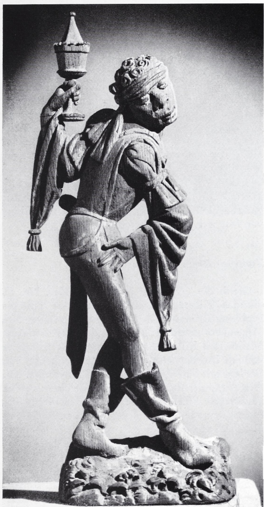
Abbildung 19: Balthasar, einer der bl. drei Könige, in gezielter tänzerischer Haltung. In der erhobenen linken Hand trägt er das Goldgefäß, während er sich mit der Rechten auf der Hüfte abstützt. Um 1520, nach Angabe des Vorbesitzers aus Kalkar. Eichenholz, abgelaugt, H = 40 cm. Rückseite flach. Der rechte Arm ist zum größten Teil ergänzt.