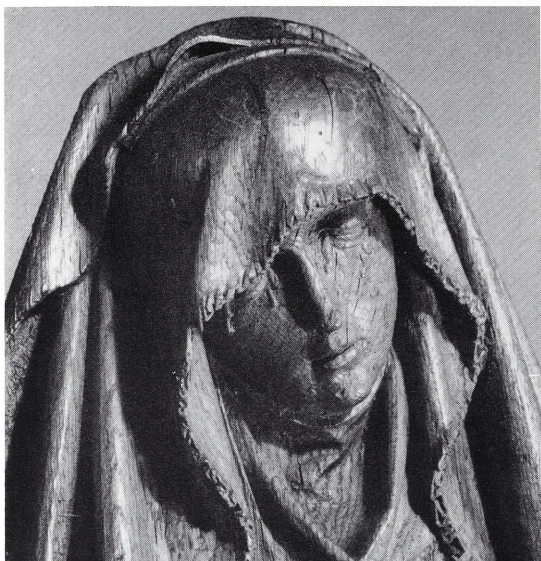
Abbildung 16: Trauernde Maria (Ausschnitt) von einer Kreuzigungsgruppe. Maria steht in Schmerz versunken, das tief beschattete Haupt leicht nach links geneigt. Niederrhein (Kalkar), um 1500; Eichenholz, H = 96 cm, vollrund. Nach Angabe des Vorbesitzers in Kalkar erworben.

Abbildung 17: Christus und der ungläubige Thomas. Der auferstandene Christus, nur mit einem Mantel bekleidet, führt die rechte Hand des neben ihm knienden Apostels Thomas an seine Seitenwunde. Thomas trägt ein langes, gegürtetes Gewand mit einem über die linke Schulter geworfenen weiten Mantel.