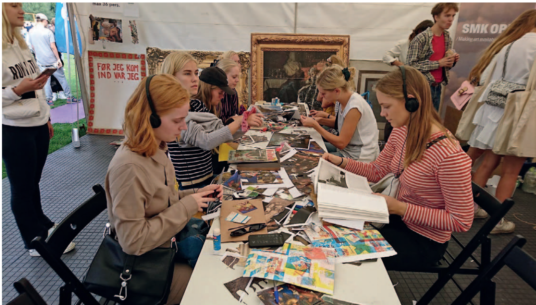
Abb. 1 Aus einem Workshop 2018 für junge Menschen, die aktiv Drucke gemeinsamer Werke aus der Sammlung des SMK neu mischen und interpretieren.

kreative und ko-kreative Fähigkeiten sowie digitale Kompetenz zu entwickeln. 10