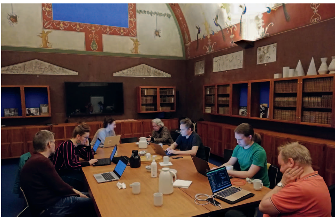
Abb. 2 Wiki Lab Culture 2022 im Thorvaldsens Museum, wo Ehrenamtliche und Personal des Museums zusammenarbeiten, um gemeinsam einzelne Aspekte des Kulturerbes zu beschreiben, offene Daten und Bilder bei Wikimedia Commons etc. einzustellen.

Ein praktisches Beispiel ist das partizipative Gemeinschaftsprojekt Wiki Lab Culture, das 2015 begonnen wurde. Bei monatlichen Treffen, sowohl online als auch in Einrichtungen des kulturellen Erbes, arbeiten ehrenamtlich tätige Wikipedia-ner*innen und Expert*innen für kulturelles Erbe zusammen, um frei zugängliche Sammlungen und forschungsbasiertes Wissen in umfassenderen und vertrauenswürdigeren Wikipedia-Artikeln zusammenzuführen, die jedes Jahr Millionen von Nutzer*innen erreichen. 11