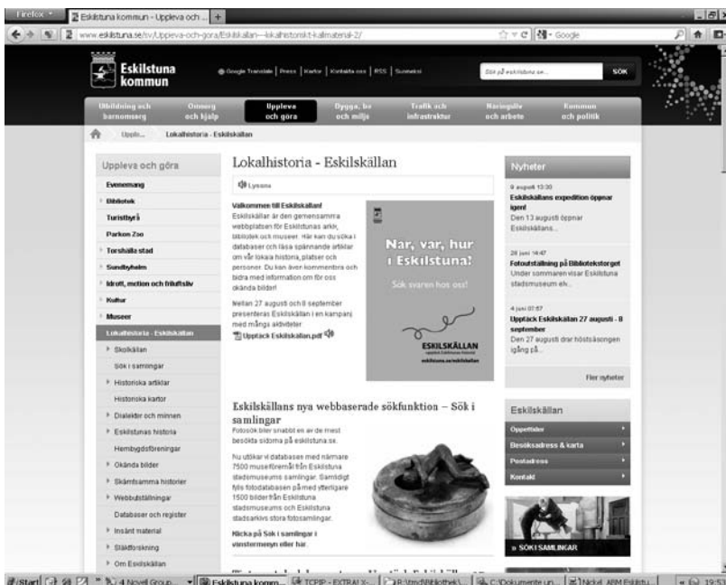
Abb. 3: Screenshot Eskilskällan Website

Die Sammlungen des Kunstmuseums ( http://www.eskilstuna.se/sv/Uppleva-och-gora/Museer-2/Eskilstuna-konstmuseum/ [letzter Zugriff: 24.07.2012]) und die Objekte des Stadtmuseums werden an einem anderen Standort in der Stadt aufbewahrt.