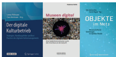
Abb. 1: Cover von deutschsprachigen Publikationen.

Der Prozess der digitalen Transformation wird in Der digitale Kulturbetrieb. Strategien, Handlungsfelder und Best Practices des digitalen Kulturmanagements behandelt. Hier werden u. a. Fallstudien aus dem deutschsprachigen Raum, nicht nur aus Museen, sondern auch aus anderen Kultureinrichtungen (Theater, Konzerthäuser) vorgestellt. 10 Die Theorie und Praxis digitaler Dokumentation musealer und universitärer Sammlungen und ihrer Verfügbarkeit im Internet diskutiert die Publikation Objekte im Netz. Wissenschaftliche Sammlungen im digitalen Wandel . Sie ist als Ergebnis eines Forschungsprojektes entstanden, das zum Ziel hatte, eine Dokumentations- und Digitalisierungsstrategie für die fast 30 wissenschaftlichen Sammlungen der Friedrich-Alexander-Universität Erlangen-Nürnberg zu entwickeln. 11