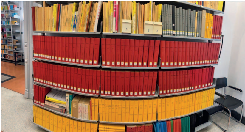
Abb. 3 + 4: Berliner Telefonbücher (ab 1949) im Lesesaal der Bibliothek. Zur Erläuterung: graue Bände = Ost-Berliner Bestand von 1955 bis 1989, die Reihe darunter West-Berlin, dieselbe Zeit.