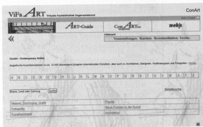
Abb. 2: ConART: Contemporary Artists

CONART – CONTEMPORARY ARTISTS. EINE KÜNSTLERDATENBANK ( http://vifaart.slub-dresden.de/csp/vifaart/conart/conart.csp )