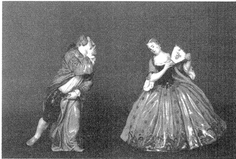
Abb. 2: J. J. Kaendler: Die Kusshand, um 1936, Staatliches Museum Schwerin, Inv.-Nr. KG 967/968

Als in Vorbereitung der großen Landesausstellung 1000 Jahre Mecklenburg auf Schloss Güstrow 1995 das 1945 in Krumbeck verloren gegangene Reliefbildnis Martin Luthers von Albert von Soest gefunden wurde, rückte das Thema Kriegsverluste erneut in den Fokus. 5 Erfreulicherweise gelang es 1997, die Holztafel nach Zahlung eines Finderlohnes – finanziert durch die Ostdeutsche Sparkassenstiftung im Land Mecklenburg-Vorpommern und die Ostseesparkasse Rostock – für das Staatliche Museum Schwerin zurückzuführen. Seither ist das Werk, das vermutlich als Modell für die Negativ-Gipsform zur Herstellung von Reliefs aus Papiermasse diente, im Renaissanceschloss Güstrow der Öffentlichkeit zugänglich.