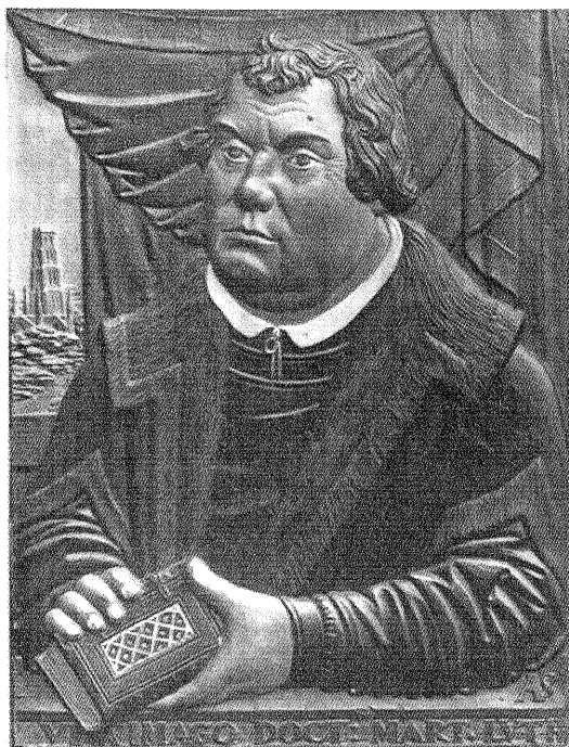
Abb. 1: Albert von Soest: Bildnis Martin Luther um 1560/70, Staatliches Museum Schwerin, Inv.-Nr. Pl 614.

Diese Schweriner Bestände wurden im Herbst 1961 durch Tausch mit Kunstwerken aus der Albrechtsburg in Meißen an das Suermondt-Ludwig-Museum in Aachen zurückgegeben. Zahllose andere Werke waren im Frühjahr 1946 der eiligen Räumung des Schweriner Schlosses ausgeliefert. Auch wenn vieles, z. T. durch intensive, langjährige Recherchen, aufgefunden und dadurch gerettet wer-