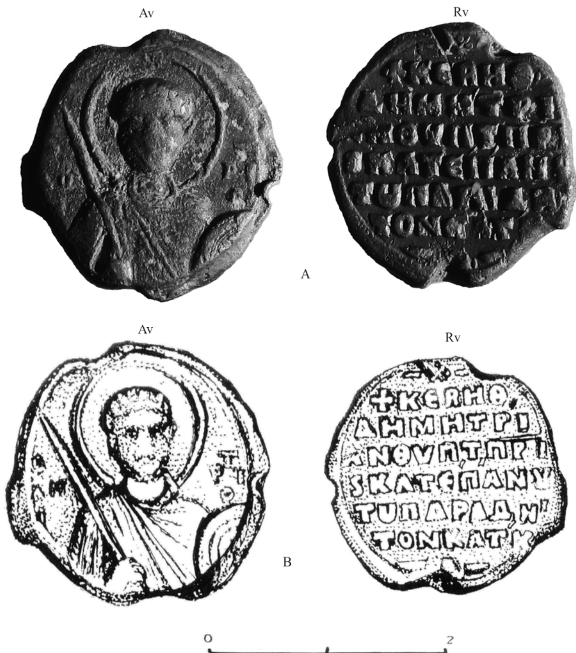
Pl. 4. Sigiliul lui Katakalon, de la Cataloi (jud. Tulcea) (sec. XI). A. foto; B. desen.