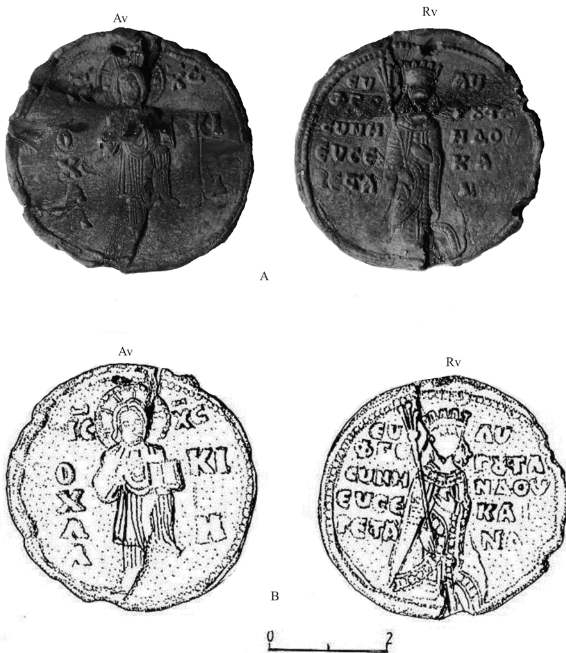
Pl. 2. Sigiliul împărătesei Euphrosyna Kamaterina Doukaina (1195–1203), descoperit în jud. Constanța, passim . A. foto; B. desen.