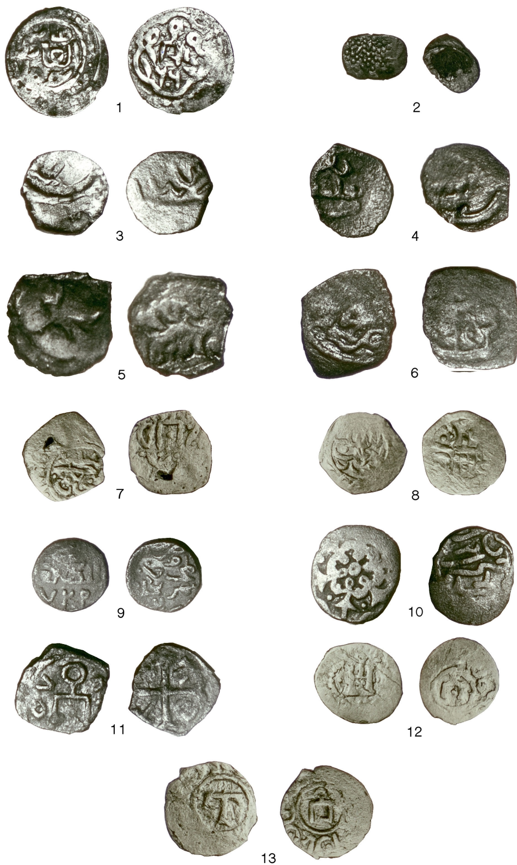
Pl. 1. Monede emise de Hoarda de Aur (1-10); monede tătaro-genoveze (11-12); emisiune de Tana (13).