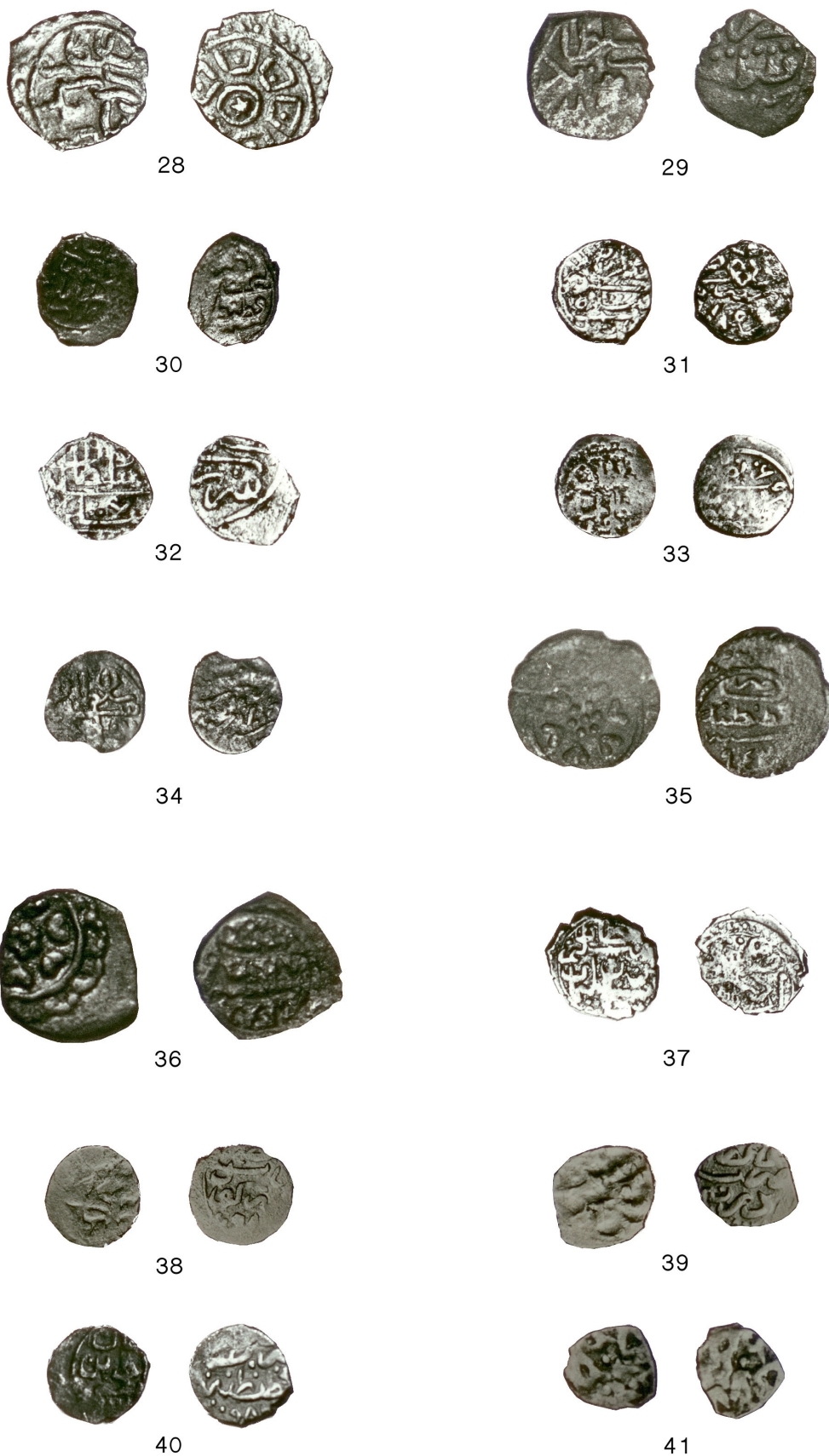
Pl. 3. Emisiuni otomane (28–41).