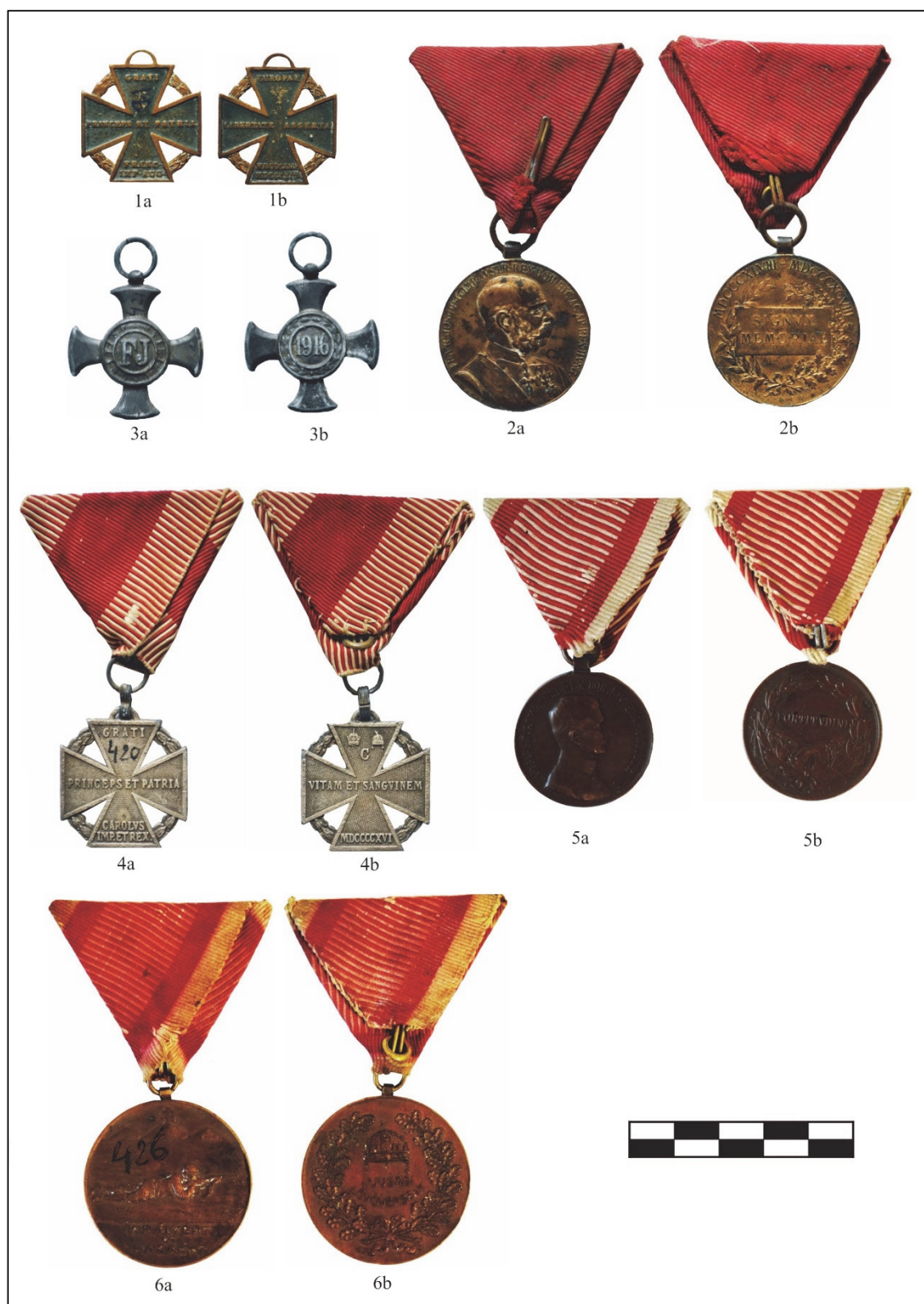
Pl. I. 1 (a-b). Crucea militară austriacă 1813-1814 (1814); 2 (a-b). Medalia militară jubiliară pentru 50 de ani de domnie a împăratului Franz Joseph (1898); 3 (a-b). Crucea de fier pentru merit - tip 3 (1916); 4 (a-b). Crucea lui Carol pentru trupă (1916); 5 (a-b). Medalia pentru vitejie - clasa de bronz, var. Carol (1917); 6 (a-b). Medalie maghiară de tir (cca. 1910).