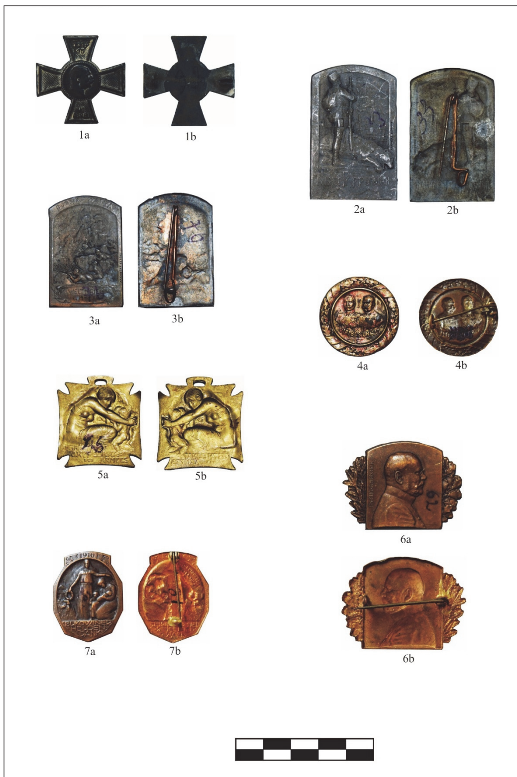
Pl. III. 1 (a-b). Insigna VII Armee. 1914-15; 2 (a-b). Insigna Brigade Papp Dandár; 3 (a-b). Insigna Dorna-Watra. Weltkrieg 1914-1916; 4 (a-b). Insigna Viribus Unitis; 5 (a-b). Medalion Orphelinat des Armees; 6 (a-b). Insigna Erzherzog Friedrich; 7 (a-b). Insigna Bukowiner helden Dank (1916).