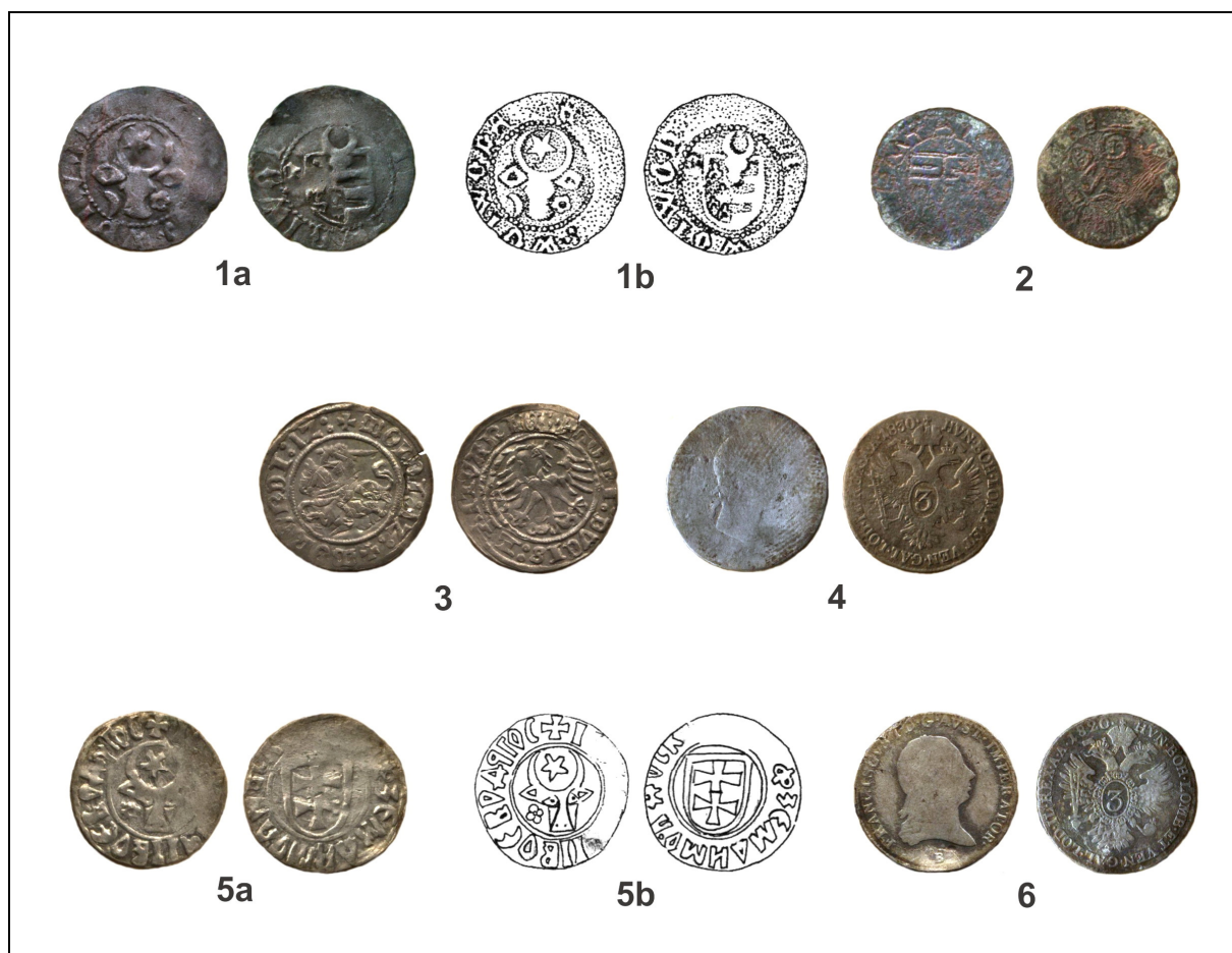
Fig. 2. Monede descoperite în așezările medievale de la Borniș „Mălești” (nr. 1–4) și „Obârșia” (nr. 5–6).