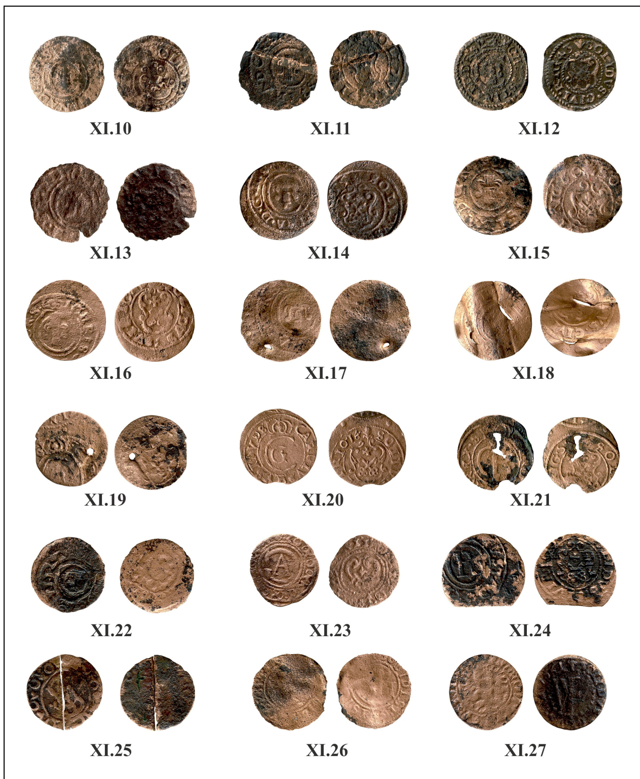
Fig. 3. Monede descoperite în Moldova (nr. XI.10 – XI.27).