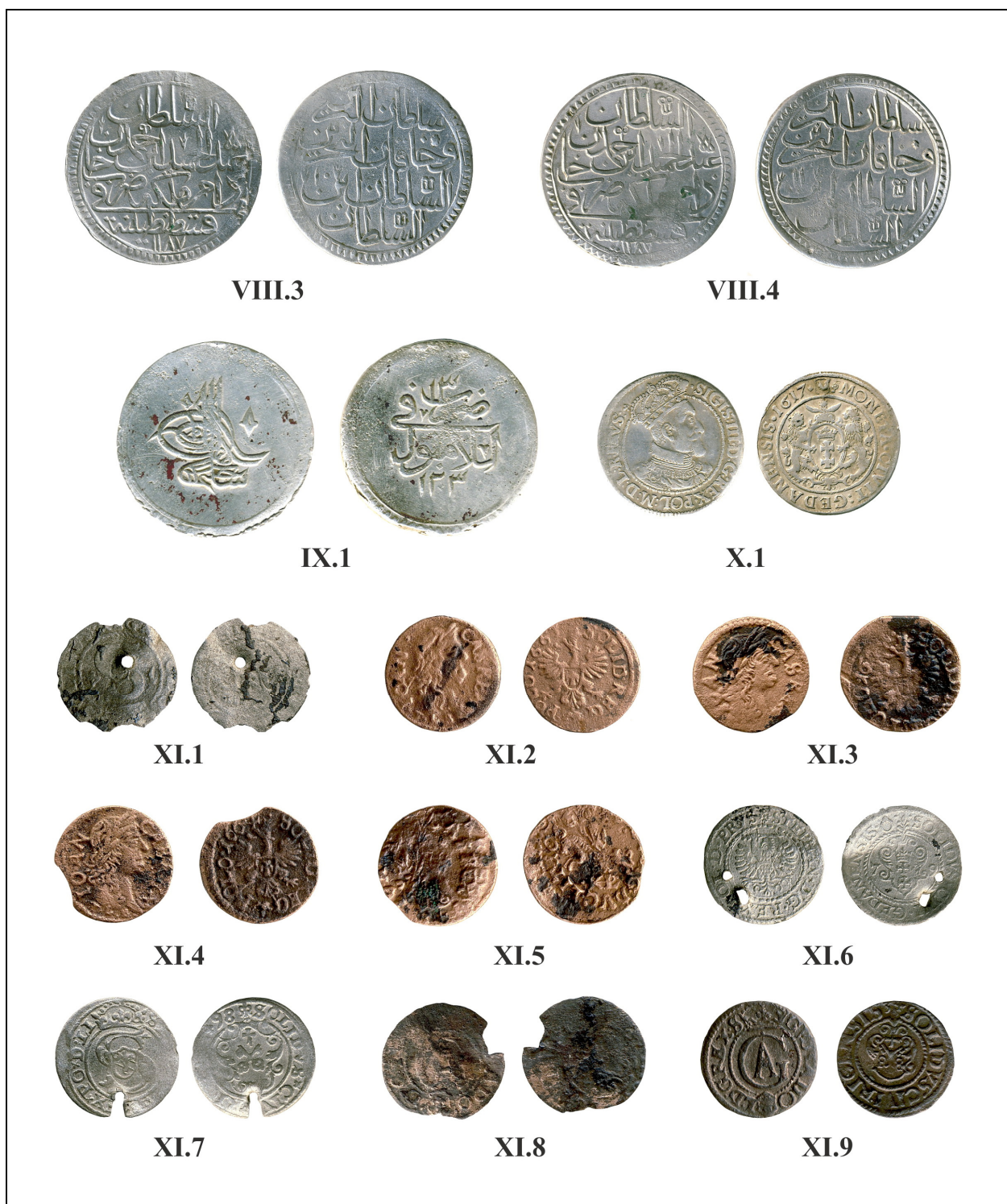
Fig. 2. Monede descoperite în Moldova (nr. VIII.3 – XI.9).