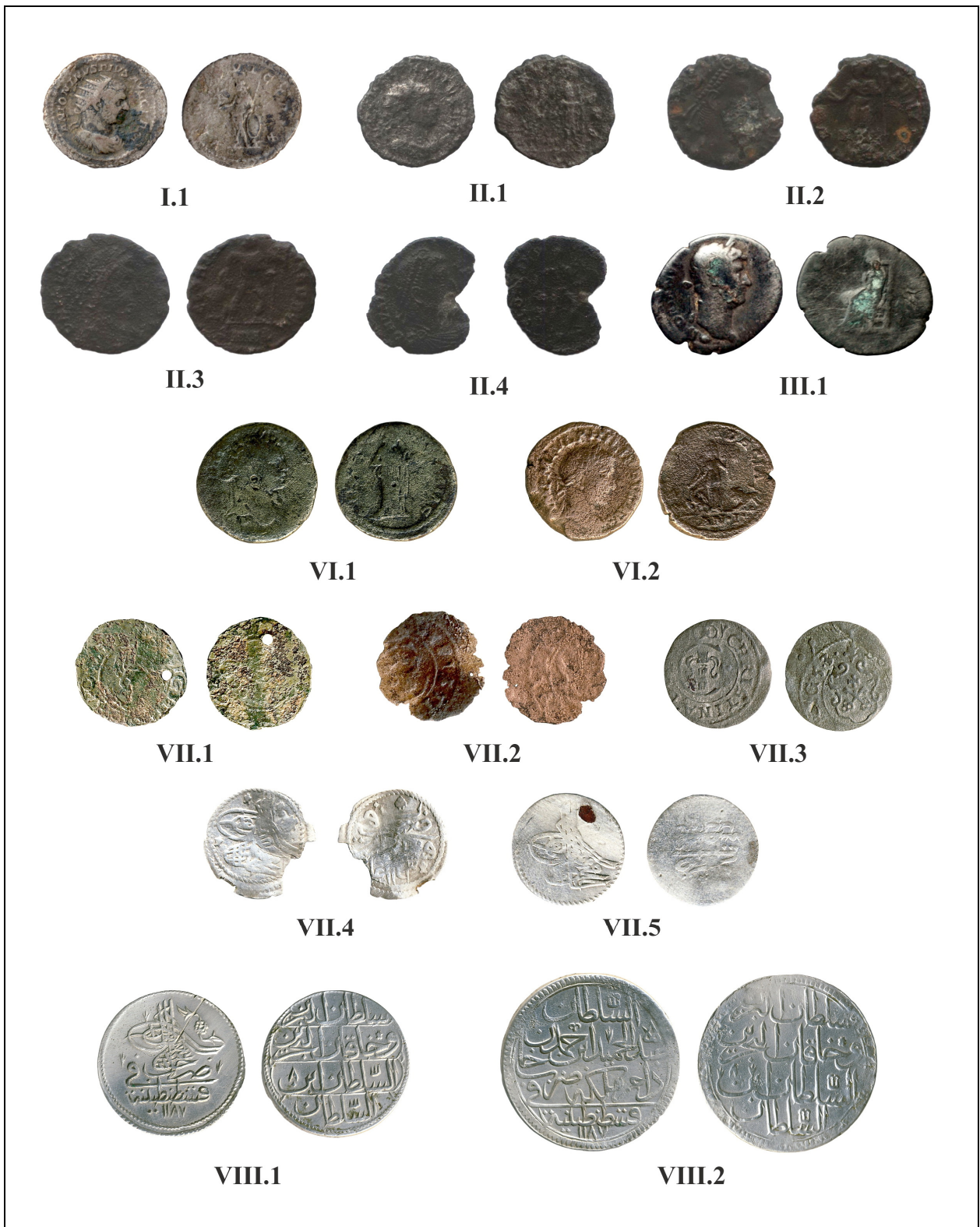
Fig. 1. Monede descoperite în Moldova (nr. I – VIII.2).