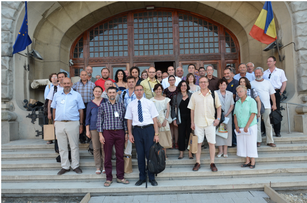
Fig. 2. Participanții la Simpozion (Muzeul Național de Istorie și Arheologie din Constanța)