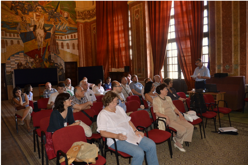
Fig. 1. Aspecte din timpul lucrărilor Simpozionului