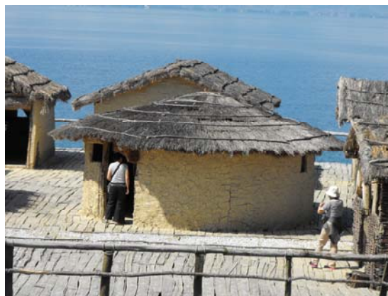
Fig. 5. Construcție circulară din Golful Oaselor..