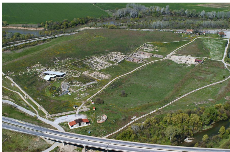
Fig. 6. Imagine panoramică cu situl Stobi.