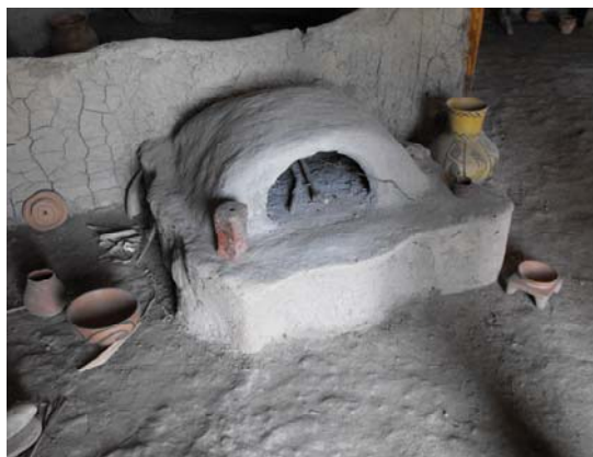
Fig. 4. Interior de casă, Tumba Madzari.