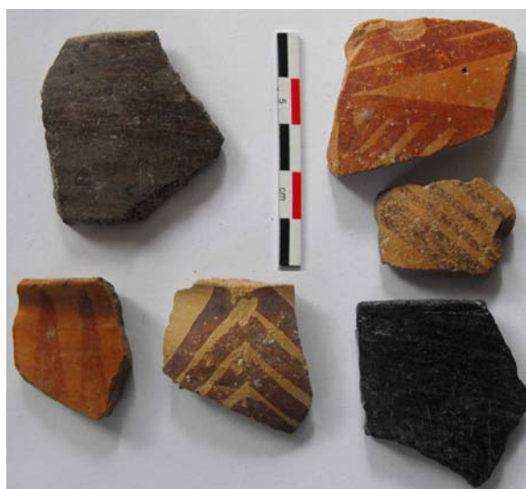
Fig. 7. Stobi, ceramică pictată neolitică.