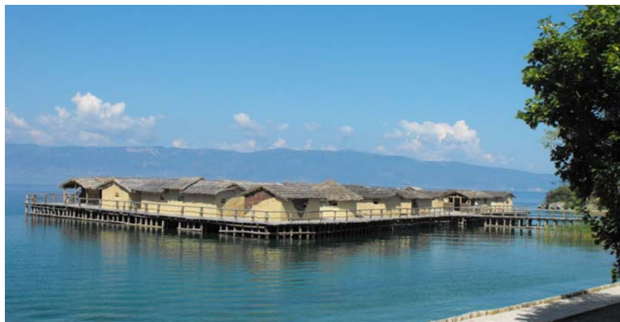
Fig. 3. Muzeul din Golful Oaselor, Ohrid.