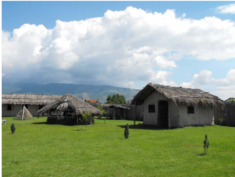
Fig. 1. Muzeul în aer liber de la Tumba Madzari, Skopje.