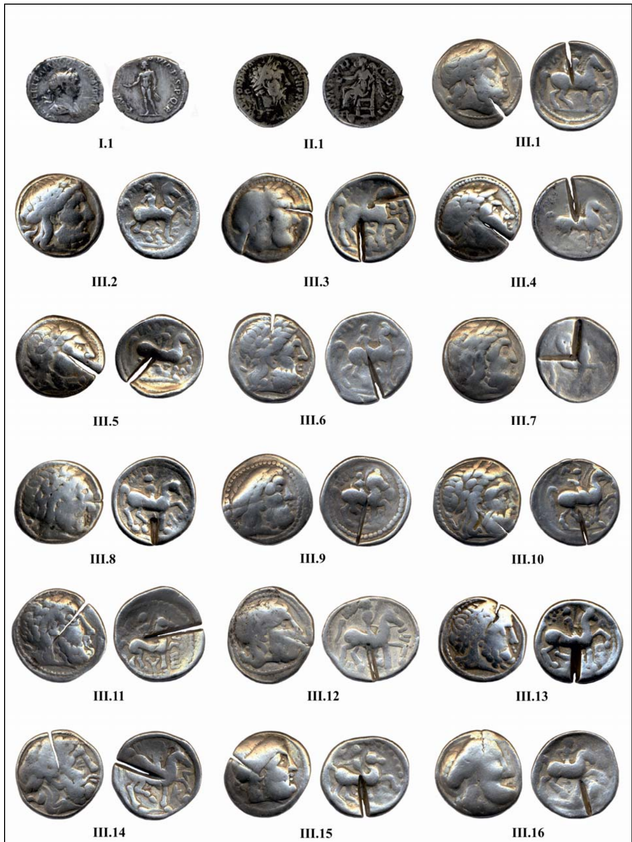
Fig. 1. Monede descoperite în Moldova (nr. I-III.16).