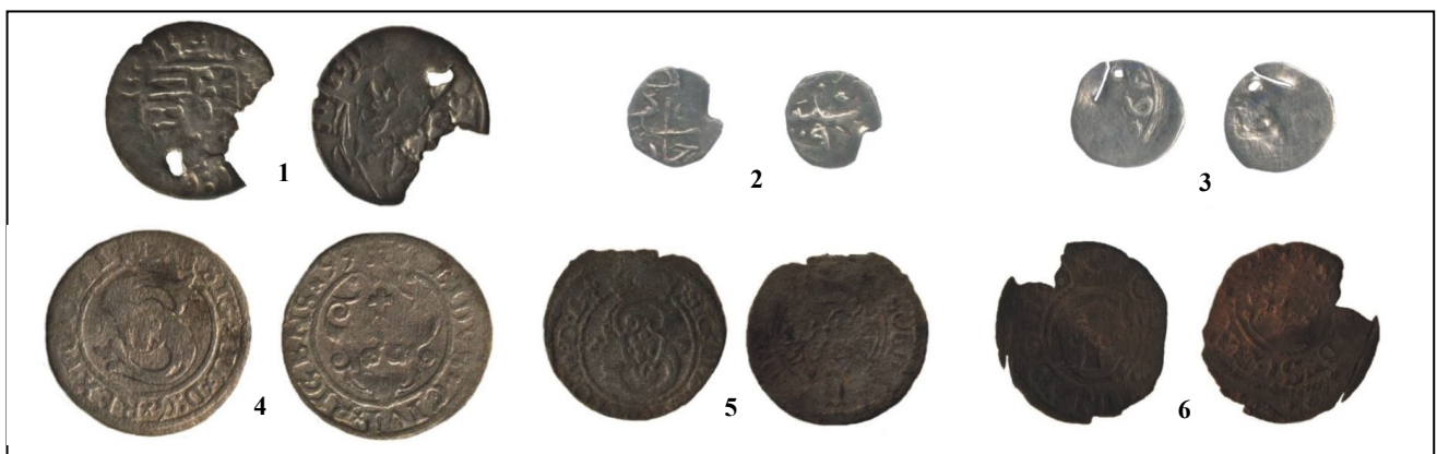
Pl. 2. Monede descoperite în situl medieval de la Negrești „Dolhești” (jud. Neamț).