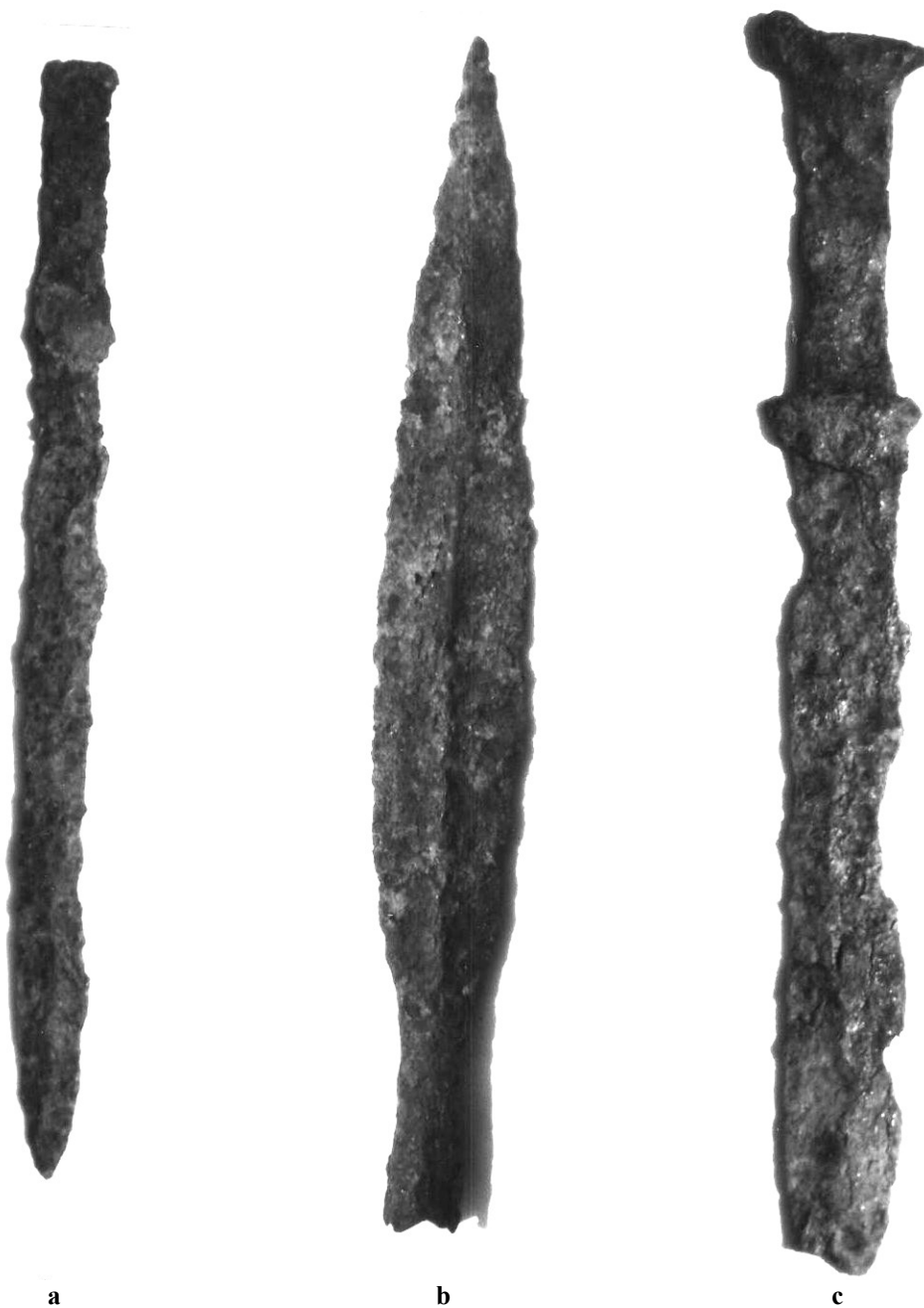
Fig. 1. Cozia-Iași, a. Akinakes; b. Vârf de lance; c. Akinakes cu antene