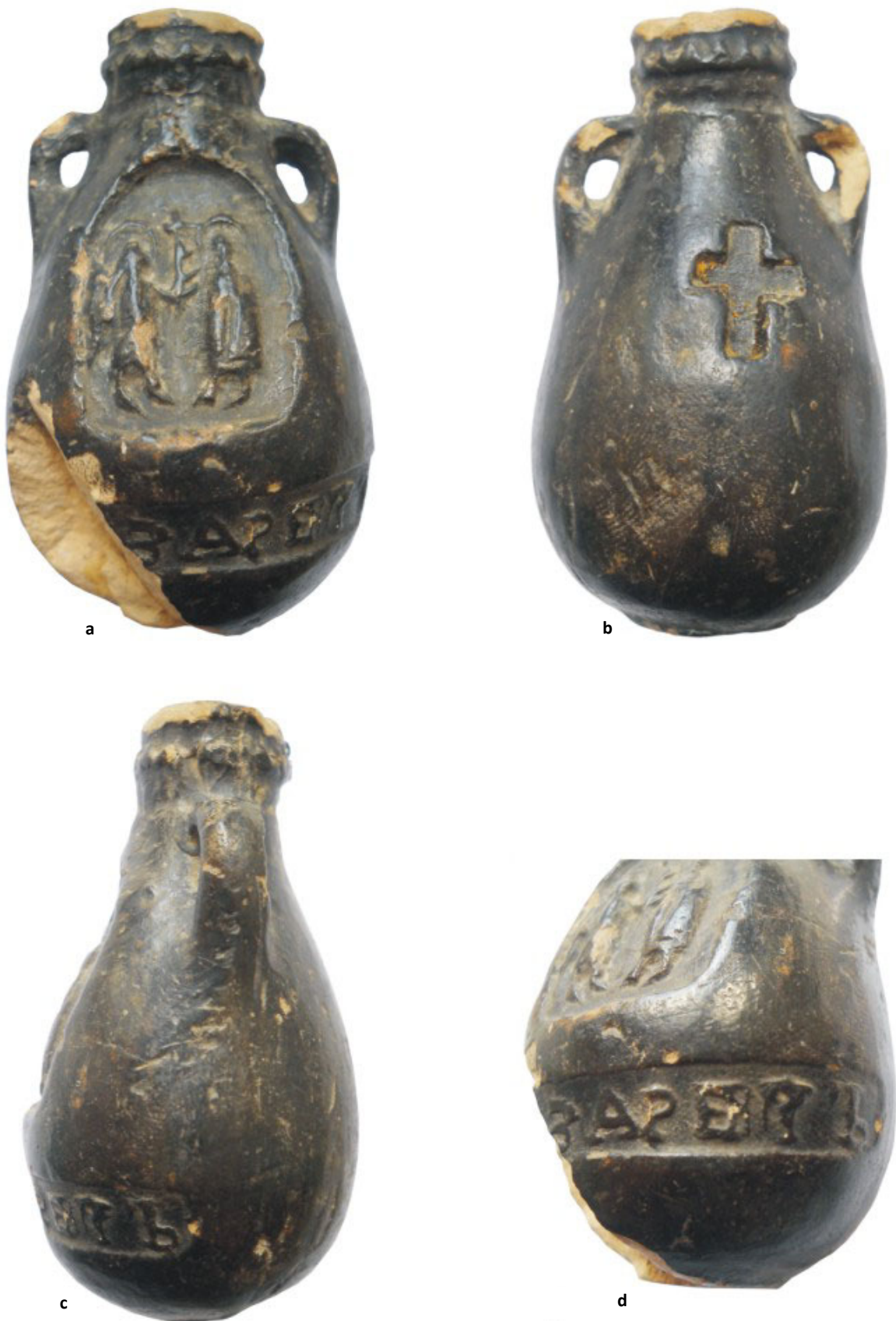
Fig. 2. a, b, c, d – Ampulla din ceramică descoperită la Iași (foto).