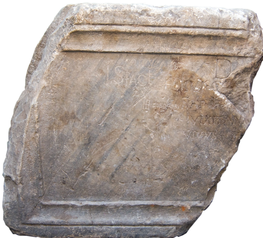
Fig. 2. Inscripție romanică, latină, descoperită în Curtea Domnească din Suceava