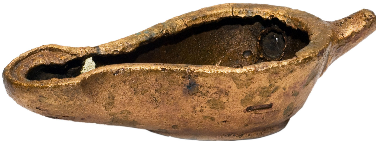
Fig. 1. Opaț din bronz, secolele I–II p. Chr., descoperit în Curtea Domnească

Chiar dacă în Moldova Renașterea nu s-a manifestat plener, limitându-se la folosirea unor detalii de arhitectură vehiculate de meșteri pietrari care lucrau în teritoriul est-carpatic, veniți din Apusul sau Centrul Europei, trebuie să acceptăm ideea că unii moldoveni, recrutați dintre cei care au circulat în spațiul european, au avut preocupări legate de istoria antică, preocupări manifestate și prin colecționarea de inscripții sau obiecte legate de lumea greco-romană.