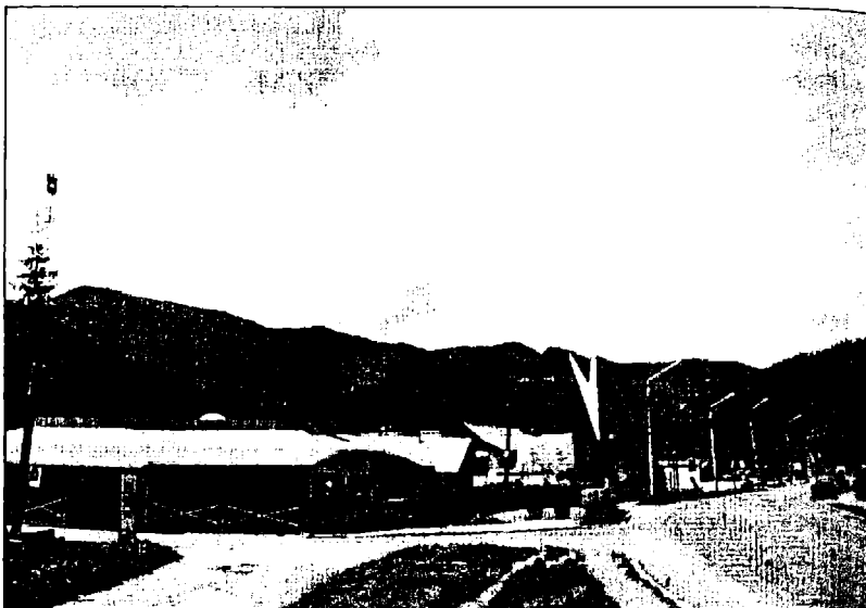
Fig. 2. Valea Bistriței la Bicăz (săgeata indică locul descoperirii).