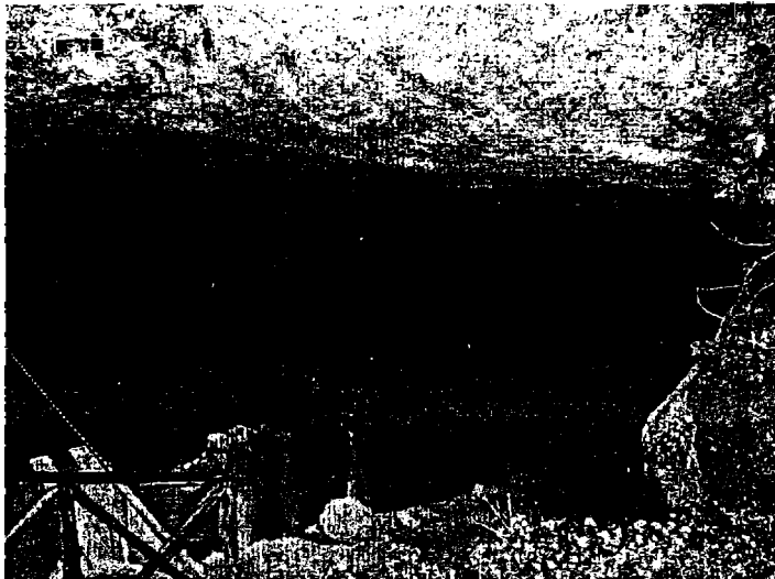
Fig. 2. Peștera Settecannelle.