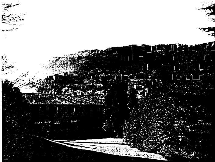
Fig. 1. Bellagio, villa Serbelloni

Centrul este amplasat în două clădiri principale, Villa Serbelloni (fig. 1) și Maranese, ambele dotate cu tot confortul, la care se adaugă câteva mici studiouri, răspândite în parcul proprietății, în care rezidenții lucrează pe perioada de timp cât sunt la Bellagio. Villa Serbelloni are o sala de conferință de 50 persoane, dotată cu aparatul necesar, iar o altă sală mai mică de conferințe de circa 20 de persoane, se află lângă clădirea principală.