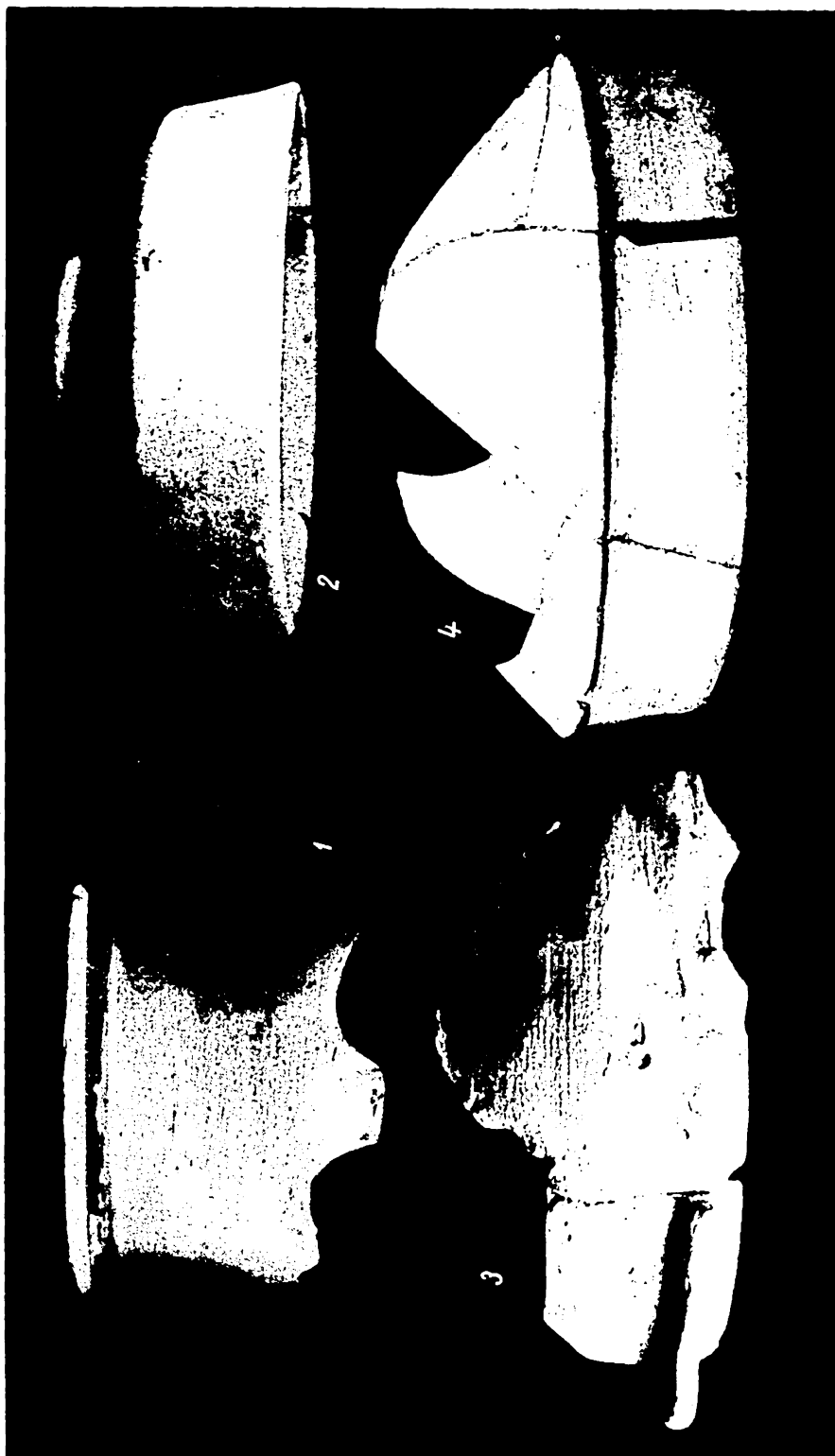
Fig. 2. — Vase lucrate la roată (1 = 1/3 m. nat.; 2 = 1/2 m. nat.; 3 = 3/5 m. nat.; 4 = 2/5 m. nat.).