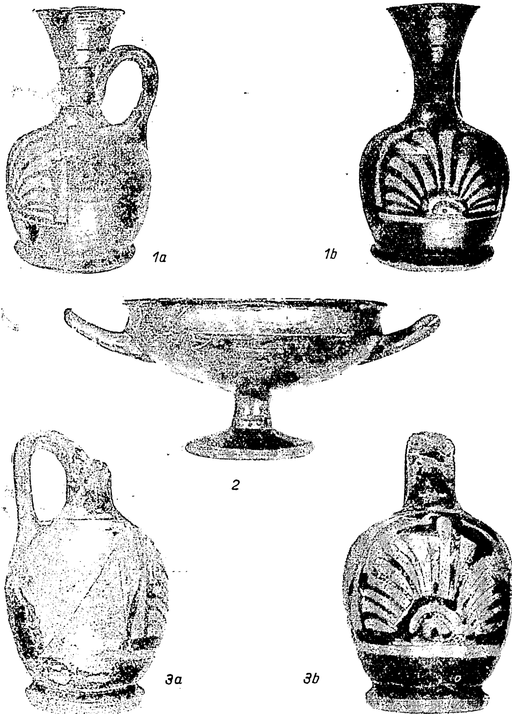
Fig. 4. — Ceramică grecească — seria atică (1 : circa 1/1 ; 2 : circa 1/2 ; 3 : circa 2/3).