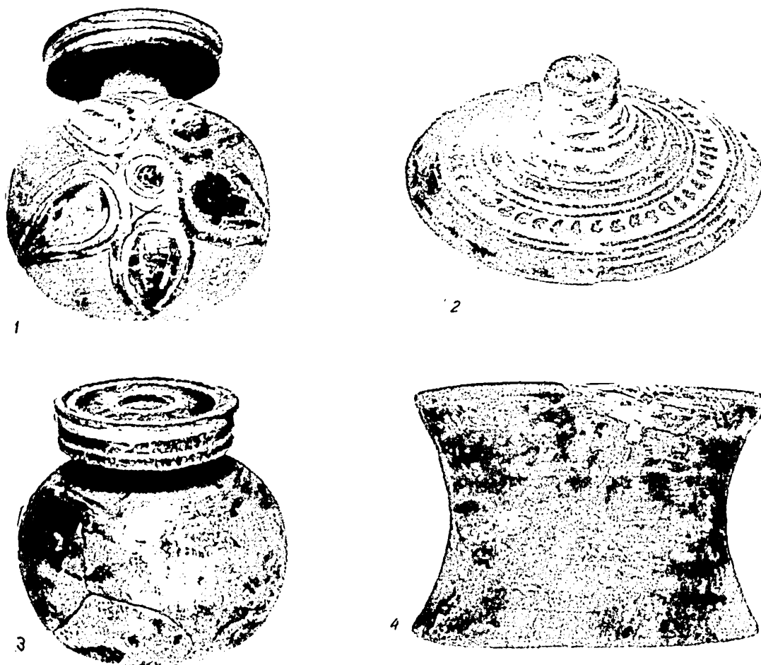
Fig. 1. — Ceramică grecească — seria corintică (circa 1/1).