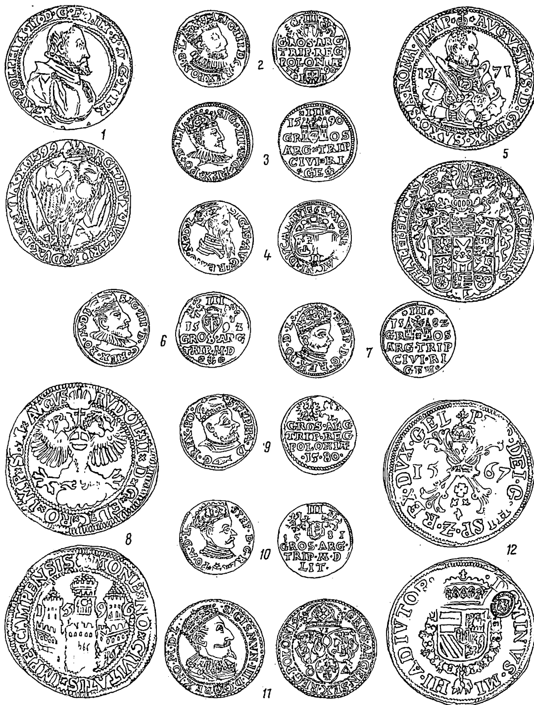
Fig. 2. — Monede din tezaurul de la Păun, secolul al XVI-lea (circa 1/1).