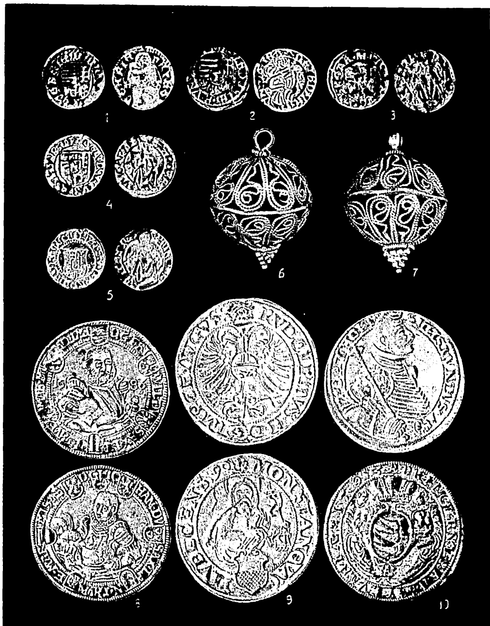
Fig. 1. — Stăuceni. Monede (1, de la Matei Corvin; 2 — 3, de la Vladislav al II-lea; 4, de la Ludovic al II-lea; 5, de la Ferdinand I; 8, de la Frederic-Wilhelm I asociat cu Johann; 9, de la Rudolf II; 10, de la Sigismund Báthory) și nasturi (6, 7) de argint.